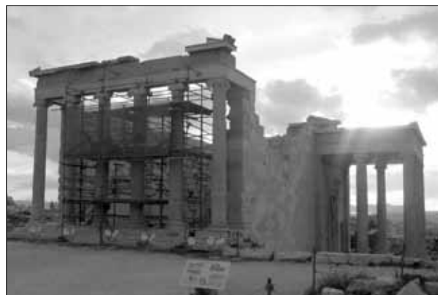
Το Ερέχθειο από ΒΑ μετά την αποκατάσταση της βορειοανατολικής γωνίας. Φωτ. Φ. Μαλλούκου-Τυφάνο, Μάρτιος 2006