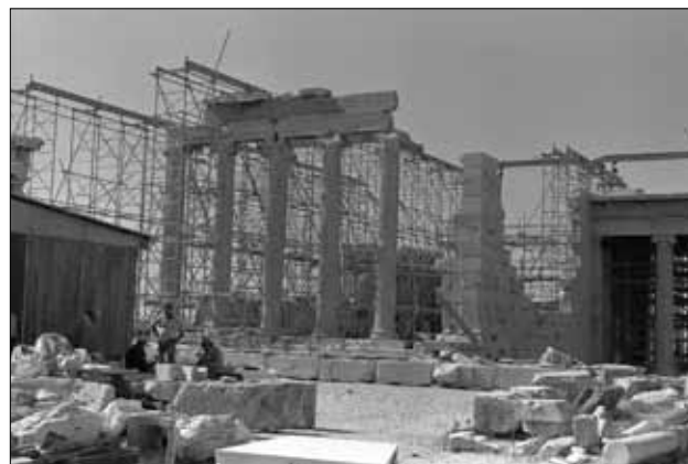
Το Ερέχθειο από ΒΑ πριν την αποκατάσταση της βορειοανατολικής γωνίας. Φωτ. Κ. Ζάμπας, Οκτώβριος 1980

Ξαναγυρίζοντας στην επικείμενη δημοσίευση της απόδοσης του έργου της αποκατάστασης του Ερεχθείου επισημαίνεται ότι αυτή αποτελεί την πρώτη του είδους, η οποία, ελπίζεται, ότι θα αποτελέσει την αφητηρία πολλών άλλων. Έτσι τα αναστηλωτικά έργα της Ακρόπολης, που εκτελούνται με την επιστημονική ευθύνη και επίβλεψη της ΕΣΜΑ, υποδειγματικά και πρότυπα από κάθε άποψη, θα ολοκληρώνονται και με την τελική τους δημοσίευση, σύμφωνα άλλωστε και με τις επιταγές της διεθνούς αναστηλωτικής δεοντολογίας.