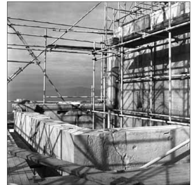
Οι ορθοστάτες της ανατολικής και της νότιας πλευράς του βάθρου της νότιας πρόστασης μετά την αποσυναρμολόγηση των υπερκείμενων λίθων της επίσκεψης. Νοέμβριος 1979