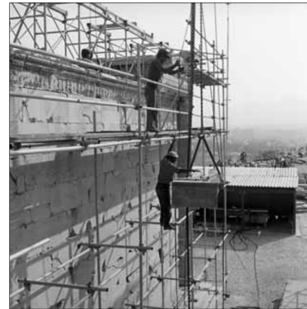
Χειροκίνητη καταβίβαση μέλους κατά την αποσυναρμολόγηση του νότιου τοίχου με αναρτημένο από τη γερανογέφυρα παλάγκο. Σεπτέμβριος 1979