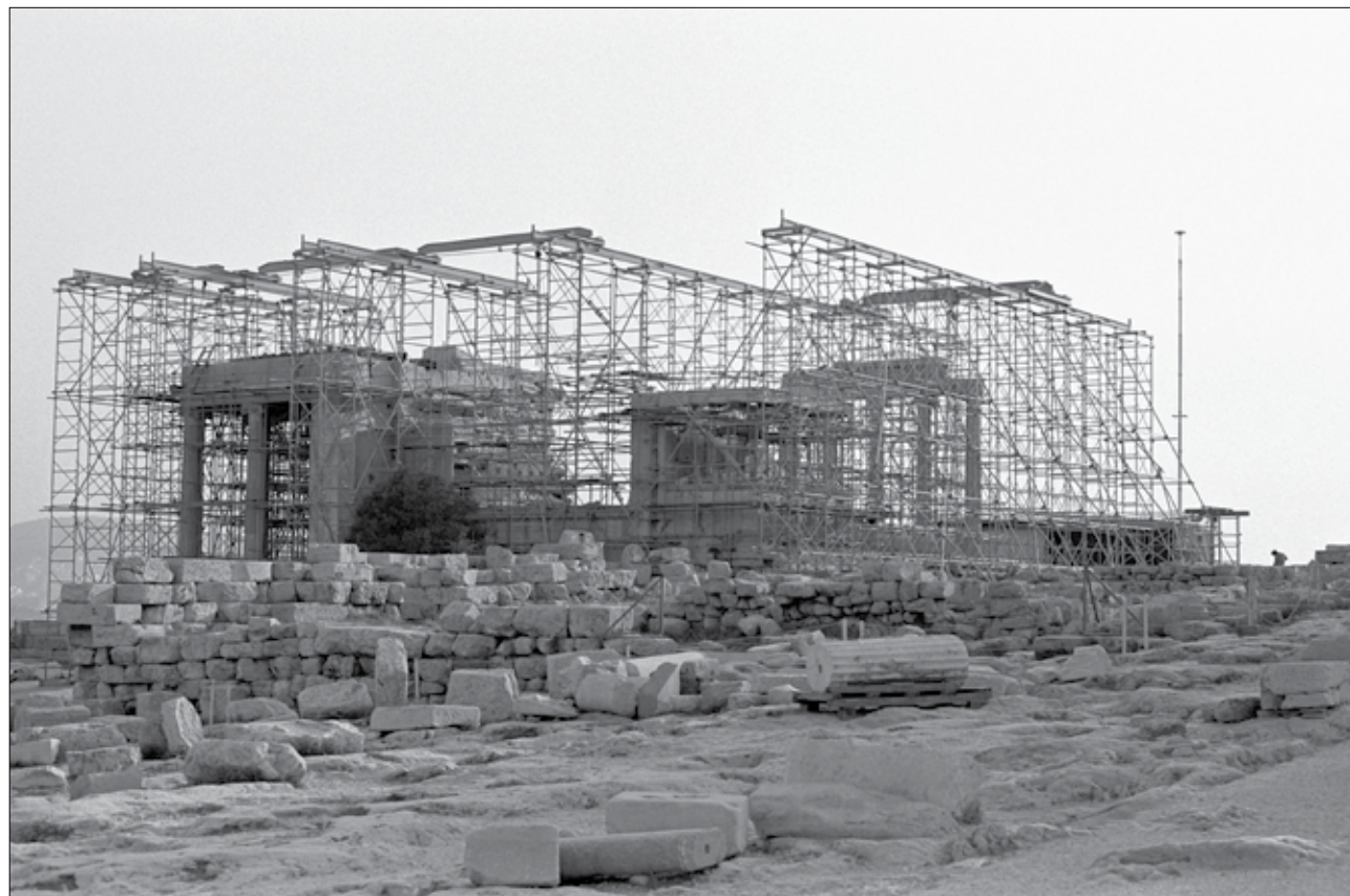
Το Ερέχθειο στο μέγιστο σημείο της αποσυναρμολόγησής του. Οκτώβριος 1980

μέρος της συντήρησης εκτενέστερες αναφορές γίνονται σε ορισμένες ειδικές περιπτώσεις δομικής αποκατάστασης μελών, όπως, λ.χ., της 2ης από τα ανατολικά φανωματικής πλάκας της οροφής της νότιας πρόστασης ή των μαρμαρίνων δοκών της οροφής της βόρειας ή ορισμένων ημικιώνων του δυτικού τοίχου. Το τρίτο μέρος, της ανασύνθεσης του μνημείου, περιλαμβάνει την αναλυτική τεκμηρίωση με βάση την οποία έγιναν, κατά την οριστική ανατοποθέτηση, αναδιατάξεις μελών στους μακρείς τοίχους του σηκού, στην επίσκεψη του βάθρου της νότιας πρόστασης ή στην οροφή της βόρειας. Τέλος, στο κείμενό του, ο Α. Παπανικολάου παραθέτει νέα στοιχεία που προέκυψαν κατά την εκτέλεση της επέμβασης σχετικά με την αποκατάσταση του Ερεχθείου στα ρωμαϊκά χρόνια ή τις μεταγενέστερες μεταμορφώσεις του μνημείου ως χριστιανικής εκκλησίας ή κατοικίας στα χρόνια της οθωμανικής κυριαρχίας, τις οποίες απέδωσε και σε σχέδια, που περιλαμβάνονται στον υπό έκδοση τόμο.