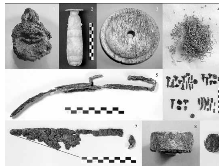
Εικ. 4. Ευρήματα του τάφου. 1. ασημένιο κόσμημα, 2. λίθινο αλάβαστρο, 3. οστέινο ασπίδιο, 4. χρυσές κλωστές και ελάσματα, 5. σιδερένια στλεγγίδα, 6. σιδερένια καρφιά, 7. λεπίδα ψαλιδιού, 8. δακτυλίδι, 9. χάλκινο δισκάριο

στο οποίο ήταν τοποθετημένος ο νεκρός. (εικ. 4) Τελικά, όμως, εκείνο που πιθανόν να κρατάει το κλειδί του τάφου της Κοίλης, είναι το μικρό ασημένιο ωσειδές περίαπτο ή εξάρτημα περιδεραίου. Στις δύο όψεις του κοσμήματος, καθώς και στη ζώνη ανάρτησης διακρίνονται σειρές με έκκρουστες διακοσμητικές στιγμές, ενώ στην κύρια όψη του αναγνωρίζουμε έκτυπη την παράσταση μιας κωμικής μάσκας. Συγκρίνοντάς την με τους τύπους που βρίσκουμε στις μάσκες της Νέας Κωμωδίας πλησιέστερο της παράλληλο θεωρούμε την μάσκα του πονηρού δούλου. Τούτο, το ασημένιο αντικείμενο αφενός μας υποψιάζει για την πιθανή ύπαρξη