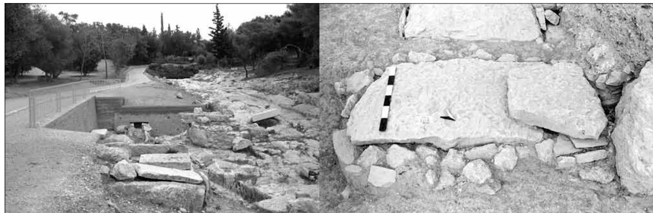
Εικ. 1. Ο τάφος 108 στο νεκροταφείο της αρχαίας οδού Κοίλης

Ο τάφος βρίσκεται στον κεντρικό τομέα της οδού Κοίλης, στο βόρειο κράσπεδο της οδού και σε μικρή απόσταση από την μνημειώδη εξέδρα. Η ανασκαφή του τάφου πραγματοποιήθηκε τον Σεπτέμβριο του 2000. Πρόκειται για κιβωτιόσχημο τάφο με προσανατολισμό από τα ΒΔ προς τα ΝΑ, που καλυπτόταν από μια μεγάλη αδρά λαξευμένη λίθινη πλάκα (διαστάσεων 2,10x0,73μ.), σπασμένη στα ΒΔ σε δύο τμήματα, πάνω από τα οποία είχε τοποθετηθεί μια πρόσθετη πλάκα μικρότερων διαστάσεων. Ο τάφος ήταν σφραγισμένος περιμετρικά με την τοποθέτηση μιας σειράς από μικρούς αργούς λίθους και τα πλευρικά του τοιχώματα ήταν επενδεδυμένα με λίθινες πλάκες. Η επίχωση του τάφου ξεκινούσε σε βάθος 0,45μ. από την επιφάνεια του και, μετά την αφαίρεση ενός αμμώδους στρώματος και ενός στρώματος λάσπης, εμφανίστηκαν, σε βάθος 0,69μ. στα ΒΑ, οστά, μέσα σε ένα στρώμα κόκκινο με λίγα χαλίκια. Τα σκελετικά κατάλοιπα από το κάτω μέρος δύο νεκρών, με προσανατολισμό ΝΑ-ΒΔ, φαίνονταν διαταραγμένα και από τους δύο σκελετούς δεν βρέθηκαν τα κρανία. Κάτω από τους δύο