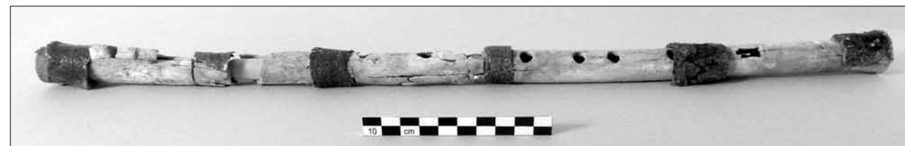
Εικ. 2. Ο πλαγιάυλος του τάφου 108 του αρχαίου νεκροταφείου της Κοίλης

αυτούς σκελετούς, σε βάθος 0,78μ., αποκαλύφθηκαν οστά από τα κάτω άκρα ενός άλλου νεκρού και άλλα διάσπαρτα μαζί με τμήματα κρανίου. Οι αλληπάλληλες αυτές ταφές φαίνεται ότι δεν ήταν κτερισμένες, καθώς στο στρώμα εμφάνισής τους και δίπλα στους νεκρούς δεν εντοπίστηκαν κτερίσματα.