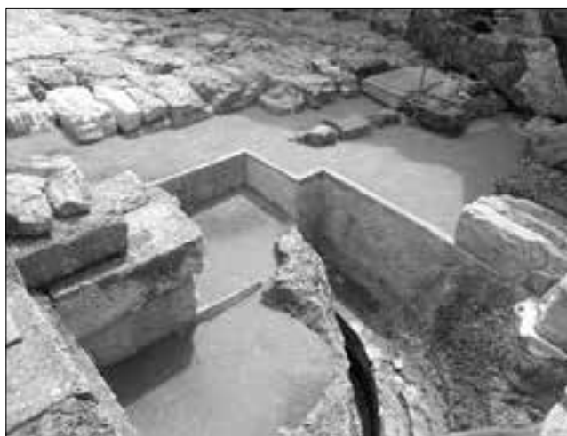
Εικ. 10. Η αυλή της Κλεψύδρας μετά τις εργασίες αποκατάστασης