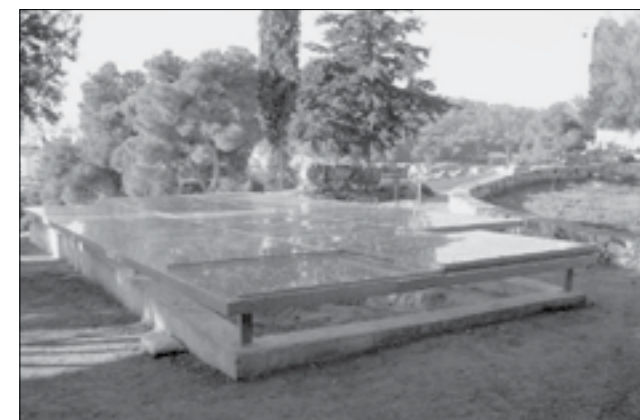
Εικ. 3. Το στέγαστρο του νέου Χαλκουργείου λήψη από Β.