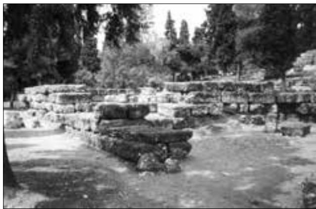
Εικ. 4. Αρχαιολογικός χώρος του Ιερού του Διονύσου Ελευθερέως: Ο νεότερος ναός του Διονύσου πριν τις επεμβάσεις

εξασφάλισε την προστασία του ευπαθούς κροκαλοπαγούς πετρώματος, αφήνοντας παράλληλα ορατή, για διδακτικούς λόγους, την ανώτερη επιφάνεια της αρχαίας θεμελίωσης. Συμπληρώσεις από τεχνητό υλικό τόσο στους τοίχους, όσο και στο βάθρο του αγάλματος, συμπλήρωσαν την κάτοψη του μνημείου (εικ. 4-5), ενώ για την βελτίωση της αντιληπτικότητας του ναού, αλλά και του Ιερού, τοποθετήθηκαν και δύο νέες ενημερωτικές πινακίδες.