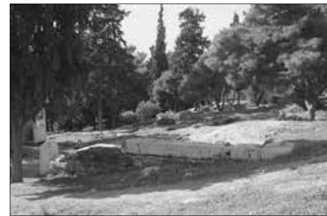
Εικ. 6. Το χορηγικό μνημείο του Νικία στη Νότια Κλιτύ της Ακρόπολης πριν τις εργασίες διδακτικής αποκατάστασης

τοίχους, εξαιτίας του ιδιαίτερα ευπαθούς πετρώματος. Η επέμβαση, η οποία ολοκληρώνεται άμεσα, προβλέπει τη συστηματική συντήρηση της επιφάνειας όλων των λίθων του δαπέδου και των τοίχων της αυλής, καθώς και τη δομική αποκατάσταση του βόρειου τμήματος του ανατολικού τοίχου, η οποία περιελάμβανε την