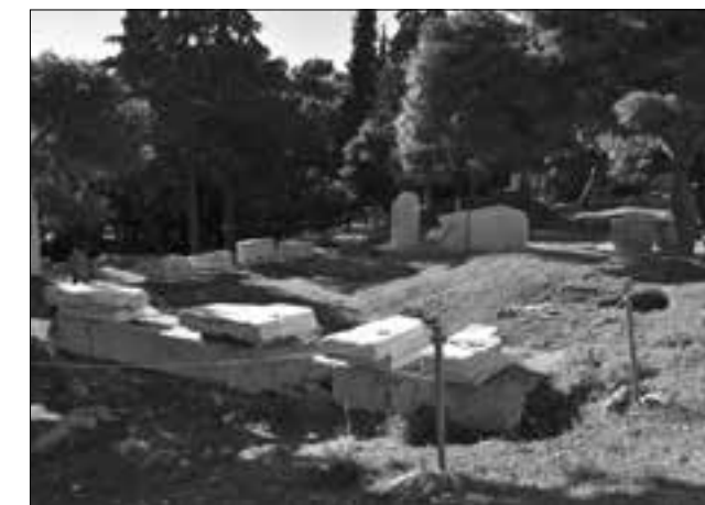
Εικ. 7. Το χορηγικό μνημείο του Νικία στη Νότια Κλιτύ της Ακρόπολης μετά τις εργασίες διδακτικής αποκατάστασης