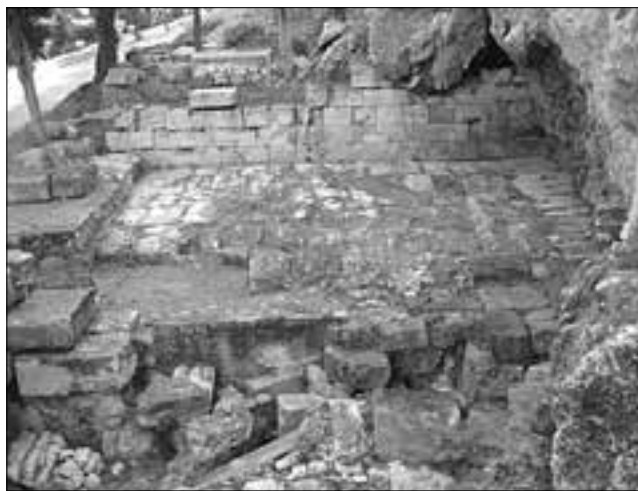
Εικ. 9. Η αυλή της Κλεψύδρας πριν τις εργασίες αποκατάστασης