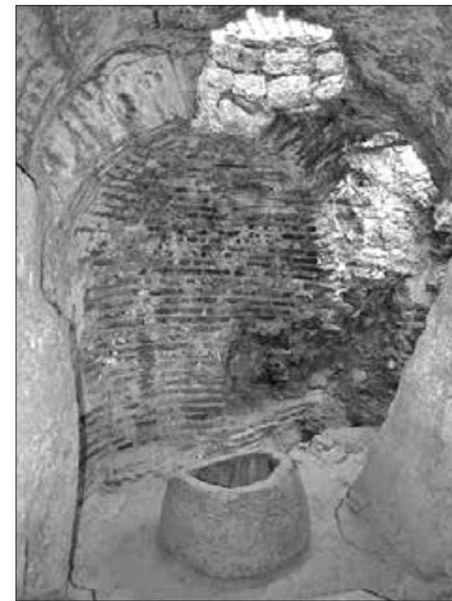
Εικ. 11. Το εσωτερικό της θολωτής κατασκευής της Κλεψύδρας

Τανούλας Τ., Τα Προπύλαια της Ακρόπολης κατά τον Μεσαίωνα , Αθήνα 1997, 266