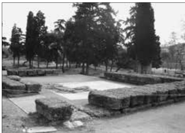
Εικ. 5. Αρχαιολογικός χώρος του Ιερού του Διονύσου Ελευθερέως: Ο νεότερος ναός του Διονύσου όπως διαμορφώθηκε μετά τις επεμβάσεις

προνάου, την αποκατάσταση των ελλειπόντων τμημάτων της θεμελίωσης με χυτό υλικό, τη διδακτική τοποθέτηση σημαντικών αρχιτεκτονικών μελών της ανωδομής, καθώς και την τοποθέτηση ενημερωτικής πινακίδας. Στο μνημείο επανεντάχθηκαν συνολικά 14 συνολικά διάσπαρτα αρχιτεκτονικά μέλη, τα οποία πε-