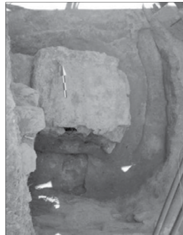
Εικ. 2. Νέο Χαλκουργείο Η βάση για την κατασκευή του καλουπιού στο εσωτερικό του λάκκου

Χαλκουργείων που έχουν αποκαλυφθεί στην περιοχή δυτικά του Ασκληπιείου, η οποία βρίσκεται σε εξέλιξη, αναμένεται να δώσει νέα στοιχεία στην χρονολόγηση