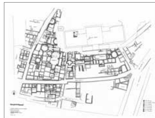
Γενικό σχέδιο (κάτοψη) των αρχαιοτήτων που ανασκάφησαν στο Οικόπεδο Μακρυγιάννη