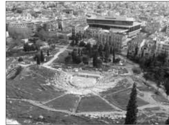
Γενική άποψη του Μουσείου της Ακρόπολης και του περιβάλλοντος χώρου από τον Βράχο της Ακρόπολης

Μπορεί όλοι οι στόχοι του Κέντρου Μελετών Ακροπόλεως (ΚεΜΑ) να μην ευοδώθηκαν, όμως ο κύριος στόχος όλων μας ήταν η ανέγερση του Νέου Μουσείου Ακρόπολης. Βγαίνοντας από την θύρα του κτηρίου Weiler βλέπω την πρόσοψη του να καθρεφτίζεται στους αστραφτερούς υαλοπίνακες του Νέου Μουσείου και σκέπτομαι ότι ο τελικός σκοπός μας έχει επιτευχθεί.