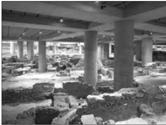
Οι αρχαιότερες του Οικοπέδου Μακρυγιάννη κάτω από το Μουσείο Ακρόπολης

Οι ανασκαφές συνεχίζονταν με κάποιες αλλαγές και μείωση των υποστυλωμάτων. Τα αρχαία (χρονολογούνται από τον 5ο αι. π.Χ. έως τον 12ο αι. μ.Χ.) προστατεύονταν με ειδικό επίχωμα από γεωφάσματα κ.ά. υλικά και τώρα έχουμε τη χαρά να τα βλέπουμε ελευθερωμένα και άθικτα, πράγμα που δεν θα συνέ-