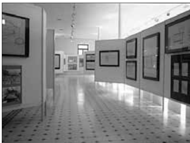
Η έκθεση των αναστηλωτικών έργων Ακροπόλεως στο Κέντρο Μελετών Ακροπόλεως.

Το Μουσείο δεν θα μπορούσε να κτισθεί όπως είχε σχεδιαστεί, εκτός εάν οι Ιταλοί, που είχαν πάρει στο