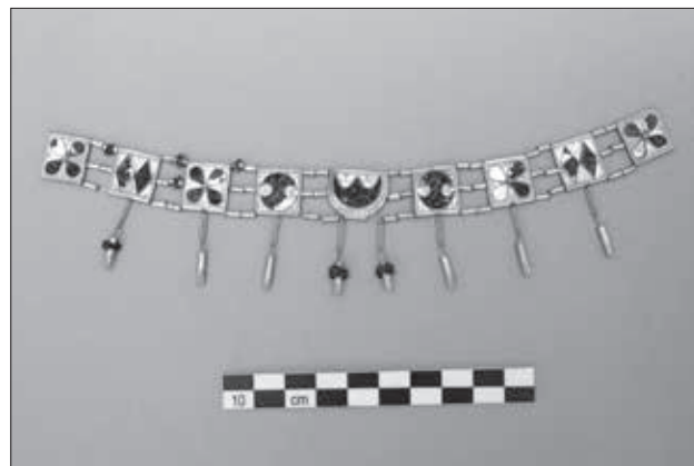
Εικ. 1. Χρυσό επιστήθιο κόσμημα Α, Τάφος 1, Λόφος Μουσών

Κανείς δεν φανταζόταν το 2002, ότι ένα τυχαίο εύρημα στο Λόφο των Μουσών (Φιλοπάππου), θα οδηγήσει τα βήματα της έρευνας στη Σκωτία και στα αρχεία του Λόρδου Έλγιν. Η ανασκαφική ομάδα πανηγύριζε, γιατί η αρχαιολογική σκαπάνη είχε μόλις αποκαλύψει το αρχαιότερο εύρημα, που είχε βρεθεί στον Λόφο του Φιλοπάππου. Ήταν τρεις αριστοκρατικοί τάφοι Γεωμετρικών χρόνων, με πολύ πλούσια κτερίσματα. Δύο ενήλικες και ένα παιδί. Ο σημαντικότερος από αυτούς τους τάφους τελικά ανήκε σε ένα νεαρό κορίτσι, το οποίο ετάφη εν μέσω πολλών αγγείων, φορώντας τέσσερα χρυσά κοσμήματα. Η «Κόρη των Λόφων» είχε ραμμένα στα ρούχα της δύο χρυσά κοσμήματα κατάμεστα από χάνδρες κεχρμπιριού της Βαλτικής, φορούσε δύο χρυσά ελικοειδή σκουλαρίκια και το χέρι της κοσμούσε ένα απλό χρυσό συρμάτινο δαχτυλίδι. Ήταν τα κοσμήματα που θα είχε φορέσει στον γάμο της, αν δεν την είχε προλάβει ο θάνατος.