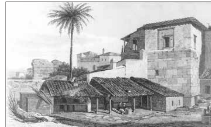
Εικ. 6. Το «Γυμνάσιο του Πτολεμαίου». Edward Dodwell 1819, 370

Οι πρώτες ανασκαφές του Lusieri (και της ομάδας του) εκτός Ακροπόλεως ξεκίνησαν ήδη πριν την άφιξή του στην Αθήνα, κατά το έτος 1800. Η πρόσφατη δημοσίευση χειρόγραφου σημειώματος εξόδων του Vincenzo Balestra (Gallo 2009, 188) τεκμηριώνει τη διενέργεια των ανασκαφών αυτών. Προφανώς ήταν αποτέλεσμα συνεννοήσεων ανάμεσα στην ομάδα των καλλιτεχνών και στον Λόρδο Έλγιν. Οι ανασκαφές επικεντρώθηκαν κυρίως στα μνημεία της Νότιας Κλιτύς και σε μνημεία που ήταν ορατά και προκαλούσαν άμεσο ενδιαφέρον για εξεύρεση αρχαιοτήτων. Από το χειρόγραφο προκύπτει ότι τα έτη 1800 και 1801 πραγματοποιήθηκαν 24 ημέρες ανασκαφών με 6 εργάτες στο Ηρώδειο, 26 ημέρες ανασκαφών με 6 εργάτες στο Διονυσιακό Θέατρο και 35 ημέρες ανασκαφών με 6 εργάτες στο «Γυμνάσιο». Η Gallo ερμηνεύει ότι η λέξη Γυμνάσιο αναφέρεται στο Γυμνάσιο του Πτολεμαίου, για το οποίο δεν γνωρίζουμε