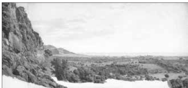
Εικ. 4. Giovanni Battista Lusieri, Πανόραμα του Παλέρμω, ιδιωτική συλλογή