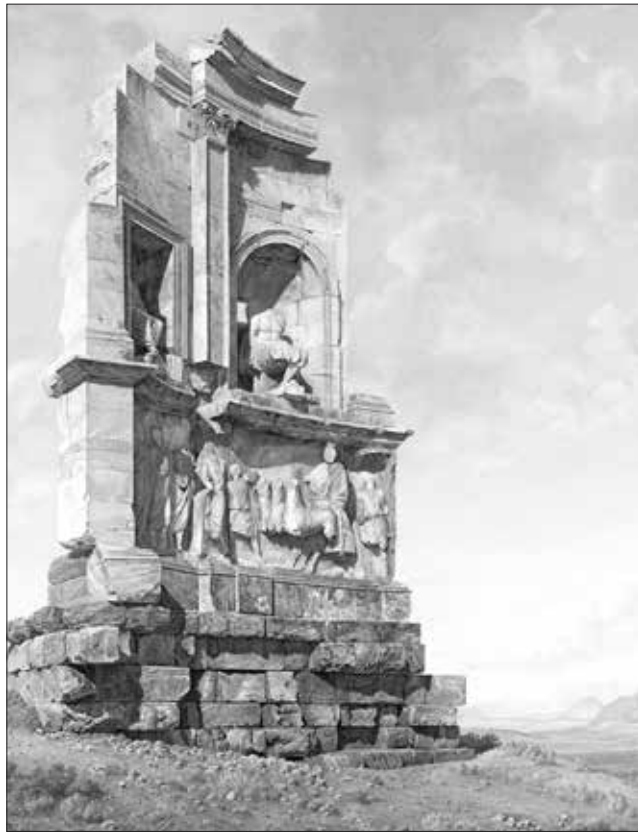
Εικ. 3. Giovanni Battista Lusieri, Το μνημείο του Φιλονάππου. The National Gallery of Scotland, NG 2815

καταστήσει τη χαμένη συλλογή. Οι ανασκαφές πραγματοποιούνται μετά από συμφωνίες με τους ιδιοκτήτες των αγρών, στους οποίους δίνει χρήματα ως αποζημίωση.