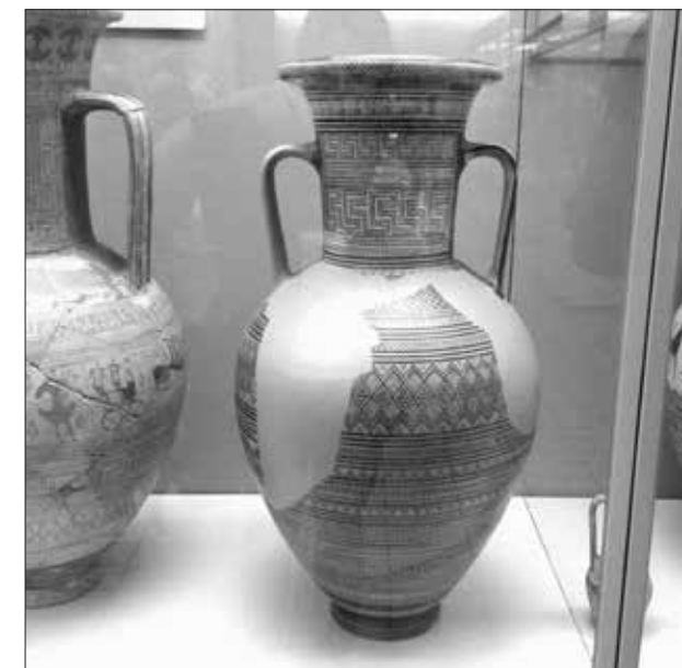
Εικ. 15. Ο ταφικός αμφορέας BM 2004, 0927.1

Ο J.C. Hobhouse επισκέφθηκε την Αθήνα το 1809 συνοδεύοντας τον Λόρδο Byron και ο Lusieri ήταν ο ξεναγός τους στην πόλη. Η περιγραφή που κάνει σ' αυτό το εδάφιο ταιριάζει στο πλάτωμα ανάμεσα στον λόφο Φιλοπάππου-στον λόφο Ακροπόλεως και στο