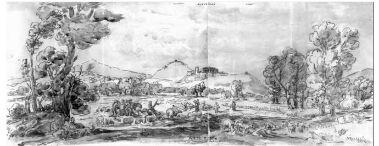
Εικ. 11. William Gell, Η Αθήνα κοντά στον Τύμβο της Αντιόπης.

Στις 28 Οκτωβρίου 1802, ανακάλυψε τον περίφημο Τύμβο της Ασπασίας, κοντά στον Πειραιά. Είναι η μοναδική τόσο καλά τεκμηριωμένη ανασκαφή του. Δημοσιεύτηκε εξαιρετικά από τον Dyfri Williams το 2014. Σύμφωνα με τον Williams ο Τύμβος πρέπει να βρισκόταν κοντά στο δρόμο, που μέσω των Ηετιωνίων