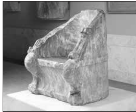
Εικ. 8. Ο Θρόνος του Έλγιν.