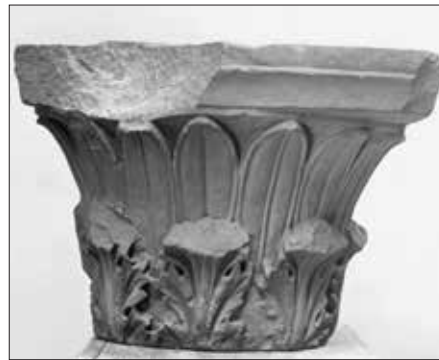
Εικ. 9. Το Κορινθιακό κιονόκρανο.