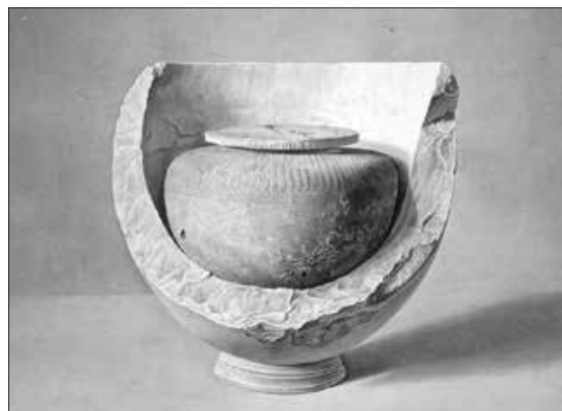
Εικ. 12. Giovanni Battista Lusieri, Ο Τάφος της «Ασπασίας». The National Gallery of Scotland, DNG 711

τις στάχτες και το έθαψε στον τύμβο. Σύμφωνα με την μελέτη του Williams, ο τάφος ανήκε σε νεκρό αθηναϊκής οικογένειας, που είχε στενές σχέσεις με τον Πειραιά, στο τελευταίο τέταρτο του 4ου αι. π.Χ. και τον ταυτίζει πιθανόν με τον Κώνωνα τον Γ'.