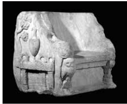
Εικ. 7. Ο Θρόνος από το Παναθηναϊκό στάδιο.

Τέλος, από τα επίσημα δελτία του Βρετανικού Μουσείου προκύπτουν αρχαιότητες που συνδέονται με 3 ακόμα μνημεία της Αθήνας, ο Lusieri όμως δεν κατέγραψε στα αρχεία του εργασίες σε αυτά. Πιθανόν οι αρχαιότητες αυτές να βρέθηκαν σε άλλες θέσεις. Από το Ωρολόγιο του Κυρρήστου (μνημείο των Αέρηδων), δηλώνεται ότι προέρχεται ένα Κορινθιακό κιονόκρανο (εικ. 9). Παρόμοιο κιονόκρανο (εικ. 10) βρίσκεται σήμερα στη Ρωμαϊκή αγορά, παρόλο που πιθανόν να μην προέρχεται από το Ρολόι. Από το σπήλαιο του Απόλλωνα Υπο-