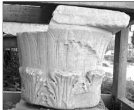
Εικ. 10. Το Κορινθιακό κιονόκρανο της Ρωμαϊκής Αγοράς