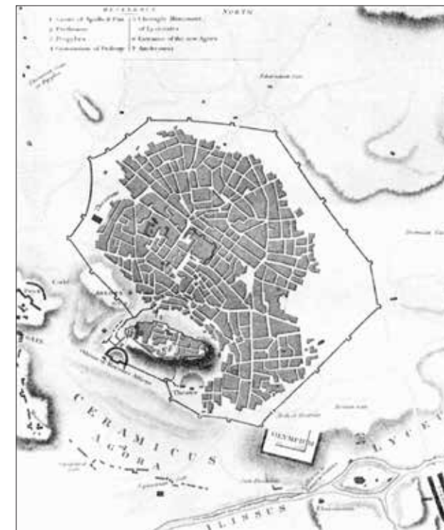
Εικ. 16. Ο χάρτης του J.L.S Fauvel με την αντίστοιχη επισήμανση CERAMICUS στα νότια της πόλεως των Αθηνών (Smith 1916, 178)

Ολυμπίο. Αν ο Lusieri ανέσκαψε όντως την περιοχή αυτή, τότε κάποια από τα 116 Γεωμετρικά αγγεία του Βρετανικού Μουσείου της Συλλογής Έλγιν προέρχονται από τα νότια της Ακρόπολης.