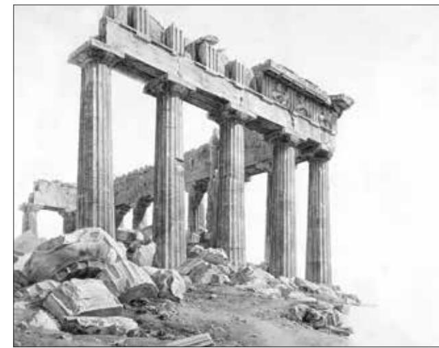
Εικ. 5. Giovanni Battista Lusieri, Ο Παρθενών. The National Gallery of Scotland, DNG 710

σμένο από κάτω νοικιάζοντας ένα άλλο γι' αυτόν που έμενε μέσα. Σκάβοντας σε σημαντικό βάθος, βρήκαμε τον ώμο και τον θώρακα ενός γυμνού Δία και έναν μεγάλο αριθμό από ακρωτηριασμένα γυναικεία γλυπτά». Πραγματοποίησαν ανασκαφή κάτω ακριβώς από το Δυτικό αέτωμα, όπου ανακαλύφθηκαν πολλά από τα γλυπτά που είχαν πέσει από την έκρηξη του Μοροζίνι. Οι περιηγητές Edward Dodwell και William Gell ήταν παρόντες σε αυτή την ανασκαφή. Στις 21 Μαΐου 1802 (a/b), κατεδαφίστηκε το δεύτερο σπίτι στην Ακρόπολη, κάτω από το Ανατολικό αέτωμα αυτή τη φορά, πάλι για τις ανάγκες της εξεύρεσης των γλυπτών. Αυτή τη φορά η γυναίκα του Κάστρου αποζημιώθηκε με 15 πιάστρα για την κατεδάφιση του σπιτιού της. Την εποχή εκείνη, νομίζανε πως τα γλυπτά του Ανατολικού αετώματος είχαν πέσει και αυτά με την έκρηξη του Μοροζίνι, όμως είχαν δυστυχώς καταστραφεί πολύ νωρίτερα, με τη μετατροπή του Παρθενώνα σε εκκλησία. Στις 27 Ιουνίου 1802 (a/b), ανέσκαψαν εντός του τρί-