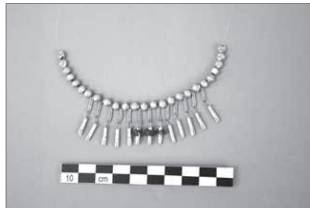
Εικ. 2. Χρυσό επιστήθιο κόσμημα Β, Τάφος 1, Λόφος Μουσών

Το δεύτερο κόσμημα (εικ. 2), επίσης ραμμένο στα ρούχα της νεκρής, είναι πολύ μικρότερο. Αποτελείται από 26 αμφικωνικές χάνδρες που μιμούνται καρπό και 13 αλυσίδες που κρέμονται ανάμεσά τους, ίδιες με αυτές του μεγάλου κοσμήματος. Το μικρό όμως κόσμημα δεν ήταν μοναδικό. Υπήρχε ένα δεύτερο κόσμημα,