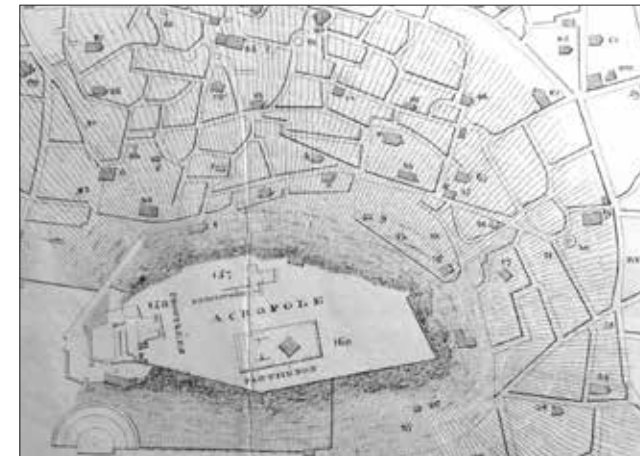
Εικ. 17. Απόσπασμα από το Plan d'Athènes 1820.

διακόσμηση, η οποία ήταν άριστα διατηρημένη. Η σαρκοφάγος αυτή σήμερα βρίσκεται στο κεντρικό σαλόνι του Broomhall και είναι αδημοσίευτη, όμως πρόλαβε να απεικονισθεί στην Αγγλία πριν μεταφερθεί στο Broomhall.