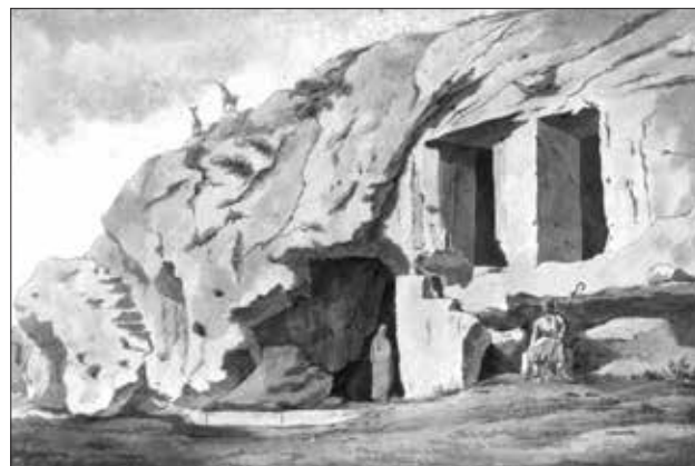
Εικ. 13. Edward Dodwell, Τάφοι στον Ιλισό. (αριστερά), Εικ. 14. Η Σπηλιά «Δοντά» (δεξιά)

Λίγο πριν το κλείσιμο αυτής της πρώτης ανασκαφικής περιόδου, στο γράμμα της 30ης Αυγούστου 1805 (EP7, folio 175-178), ο Lusieri αναφέρει στον Λόρδο Έλγιν ανασκαφή Κλασικού/Υστεροκλασικού νεκροταφείου, στα νότια του Λόφου του Φιλοπάππου κοντά στον Ιλισό: «Οι ανασκαφές συνεχίζονται, ο περασμένος μήνας ήταν πολύ τυχερός, σε ένα μέρος πιο πέρα από τον Λόφο του Μουσείου, κοντά στον Ιλισό, βρήκα 6 μαρμάρινες ταφικές ληκύθους με πολλά αγγεία και δακρυδόχους από αλάβαστρο, αρκετά καλά δια-