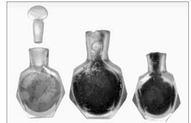
Εικ. 7. Γυάλινα φιαλίδια αρωμάτων

να (εικ. 6), που ίσως ανήκε στον Υπολοχαγό John Squire, ο οποίος ήταν αξιωματικός του πυροβολικού, ένα φορητό και δύο επιτραπέζια μελανοδοχεία, μία φορητή πυξίδα με χρυσή αλυσίδα κατασκευασμένη στο Λονδίνο και άλλα μικροαντικείμενα, όπως τρία μικρά γυάλινα φιαλίδια αρωμάτων (εικ. 7) και μία οστέινη βούρτσα για τον καθαρισμό των δοντιών. Ακόμα στα προσωπικά αντικείμενα συγκαταλέγονται ένα χρυσό νόμισμα Ουτρέχτης (1788) και ένα χρυσό Ισπανικό νόμισμα του Φερδινάνδου VI (1758) (εικ. 8) καθώς και αρκετά οθωμανικά και αραβικά νομίσματα. Βρέθηκαν ακόμη ένας σημαντικός αριθμός φιαλών και γυάλινων και πορσελάνινων σκευών, τα οποία μπορούν να σχετισθούν είτε με τα σκεύη που χρησιμοποιούνταν στο πλοίο κατά τη διάρκεια του ταξιδιού, είτε ανήκαν στην οικοσκευή ενός από τους επιβάτες. Στην εσωτερική μάλλον διακόσμηση του πλοίου πρέπει να ενταχθούν μία χάλκινη βάση και μία υποδοχή κηροπηγίου καθώς