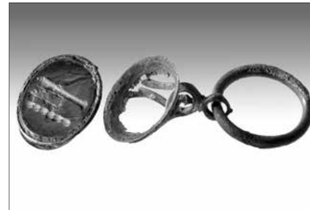
Εικ. 6. Σφραγιδόλιθος με παράσταση πυροβόλου

Από τα αντικείμενα που έχουν μέχρι τώρα ανελκυσθεί υπάρχουν ορισμένα που σχετίζονται με τη ναυσιπλοία και τον εξαρτισμό του πλοίου, όπως το κάτω τμήμα της πυξίδας του πλοίου, δύο χρονομετρικές κλεψιδρές (εικ. 4), ένα όργανο που χρησιμοποιούνταν για την χρονομέτρηση της βάρδιας και για τον υπολογισμό της ταχύτητας του πλοίου, το άνω τμήμα ενός ναυτικού διαβήτη (εικ. 5), αλλά και ο δίσκος μίας μεγάλης ξύλινης τροχαλίας. Υπάρχουν επίσης αντικείμενα που έχουν σχέση με τη διαβίωση στο πλοίο και προσωπικά αντικείμενα των επιβατών ή και του πληρώματος, όπως ένας μεγάλος αριθμός μεταλλικών και οστέινων κομβίων ενδυμάτων, αφού τόσο οι επιβάτες όσο και το πλήρωμα έχασαν, κατά τη βύθισή του πλοίου, όλα τα προσωπικά τους είδη, δύο φορητά ρολόγια τσέπης, το ένα από τα οποία φέρει το όνομα του κατασκευαστή Robert Corvan, ένας σφραγιδόλιθος από κόκκινο γυαλί με απεικόνιση πυροβόλου σε κιλίβα-