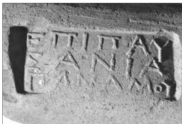
Εικ. 12. Ενσφράγιστη λαβή ροδιακού αμφορέα (ΕΠΙ ΠΑΥΣΑΝΙΑ ΠΑΝΑΜΟΥ), περ. 152 π.Χ.

Όσον αφορά στο φορτίο του πλοίου, είναι πλέον βέβαιο ότι το σύνολο του κύριου φορτίου ανελκύθηκε κατά την αρχική ναυαγιαρεσία. Η θέση του ναυαγίου έδωσε τη δυνατότητα στους σφουγγαράδες να