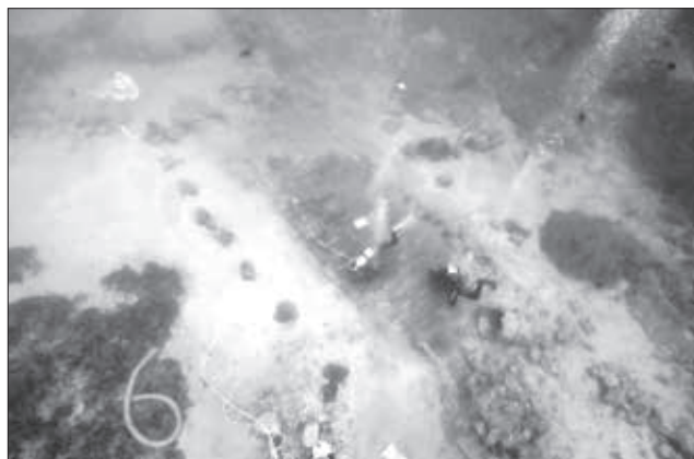
Εικ. 2. Άποψη του ναυαγίου του «Μέντωρ»