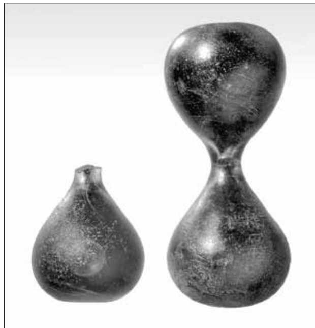
Εικ. 4. Οι δύο κλεψιδρές, που βρέθηκαν στο ναυάγιο

Από τις έρευνες αυτές έχουν προκύψει πολλά στοιχεία τόσο για το πλοίο και τους επιβάτες του, όσο και για το φορτίο που μετέφερε το πλοίο πέραν των αρχαιοτήτων. Αρχικά, από το σκαρί του πλοίου, έχει αποκαλυφθεί και διασώζεται σε αρκετά καλή κατάσταση, ένα τμήμα μήκους 10,60 μ και πλάτους 5,70 μ., που αντιστοιχεί περίπου στο 25% των υφάλων του (εικ. 3). Πρόκειται για ένα μέρος της τρόπιδας του πλοίου καθώς και του παστώματος και των νομών του αριστερού πρυμναίου τμήματός του. Το πλοίο ήταν καταχωρημένο στο μητρώο της Lloyd's του 1801 και τότε ήταν 13 ετών, νηολογημένο στο Λονδίνο ως εμπορικό πλοίο με χωρητικότητα 114 τόνους και φέροντα οπλισμό 6-12 κανονιών. Ήταν δε γενικά σε καλή κατάσταση. Τα ύφαλα του πλοίου ήταν καλυμμένα εξωτερικά με φύλλα χαλκού, γεγονός που επιβε-