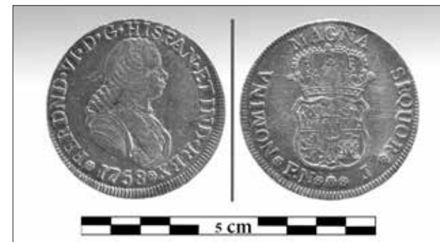
Εικ. 8. Χρυσό νόμισμα του Φερδινάνδου VI (1758)

Από τα αντικείμενα που έχουν μέχρι τώρα ανελκυσθεί υπάρχουν ορισμένα που σχετίζονται με τη ναυσιπλοία και τον εξαρτισμό του πλοίου, όπως το κάτω τμήμα της πυξίδας του πλοίου, δύο χρονομετρικές κλεψιδρές (εικ. 4), ένα όργανο που χρησιμοποιούνταν για την χρονομέτρηση της βάρδιας και για τον υπολογισμό της ταχύτητας του πλοίου, το άνω τμήμα ενός ναυτικού διαβήτη (εικ. 5), αλλά και ο δίσκος μίας μεγάλης ξύλινης τροχαλίας. Υπάρχουν επίσης αντικείμενα που έχουν σχέση με τη διαβίωση στο πλοίο και προσωπικά αντικείμενα των επιβατών ή και του πληρώματος, όπως ένας μεγάλος αριθμός μεταλλικών και οστέινων κομβίων ενδυμάτων, αφού τόσο οι επιβάτες όσο και το πλήρωμα έχασαν, κατά τη βύθισή του πλοίου, όλα τα προσωπικά τους είδη, δύο φορητά ρολόγια τσέπης, το ένα από τα οποία φέρει το όνομα του κατασκευαστή Robert Corvan, ένας σφραγιδόλιθος από κόκκινο γυαλί με απεικόνιση πυροβόλου σε κιλίβα-