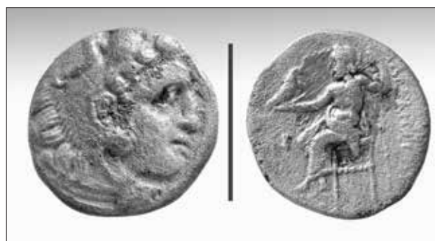
Εικ. 11. Αρχαίο νόμισμα από την περιοχή της πρύμνης του πλοίου

ανελκύσουν την πλειονότητα των αντικειμένων που βρισκόταν στα αμπάρια του. Παρόλα αυτά, ορισμένα αντικείμενα που βρέθηκαν στη διάρκεια των πρόσφατων ερευνών, είναι προφανές ότι ανήκαν σε συλλογές μικρότερης αξίας, πιθανώς των επιβατών του πλοίου. Έτσι βρέθηκαν και ανελκύστηκαν βασικά από την περιοχή της πρύμνης του πλοίου εννέα σχιστολιθικές πλάκες με απολιθώματα φυτών και ιχθύων (εικ. 10). Ένα σύνολο δεκαεννέα αρχαίων νομισμάτων διαφόρων εποχών και περιόδων, ανάμεσα στα οποία και ένα ασημένιο νόμισμα Μεγάλου Αλεξάνδρου (εικ. 11). Ένα σύνολο τεσσάρων ενσφράγιστων λαβών ροδιακών αμφορέων (εικ. 12), που χρονολογούνται επίσης σε διάφορες εποχές και τέλος, το 2013, ανασύρθηκαν επίσης από τον χώρο του ναυαγίου και δύο θραύσματα αιγυπτιακών γλυπτών. Πρόκειται για ένα θραύσμα κοιλιακής χώρας φαραωνικού αγάλματος (εικ. 13), που χρονολογείται στην περίοδο του Νέου Βασιλείου