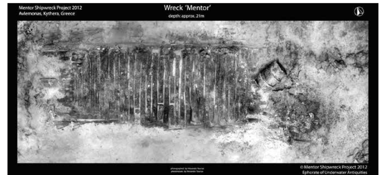
Εικ. 3. Φωτομωσαϊκό του σκαριού του πλοίου «Μέντωρ» στον βυθό του όρμου του Αγίου Νικολάου στα Κύθηρα

Μετά την πρώτη αυτή ναυαγιοερευνα, ακολούθησαν και άλλες έρευνες και αυτοψίες στον χώρο του ναυαγίου, που σχετίζονται με την περιρρέουσα φημολογία ότι υπάρχουν ακόμα «μάρμαρα» στο χώρο του ναυαγίου. Ήδη το 1875, Καλύμνιοι σφουγγαράδες αναφέρουν ότι είδαν μάρμαρα στον βυθό και οργανώνεται τότε αυτοψία από τον Παναγιώη Σταματάκη, Έφορο Πελοποννήσου, κατ' εντολήν του Στέφανου Κουμανούδη, Προέδρου της Αρχαιολογικής Εταιρείας και Υπουργού Εκκλησιαστικών και Δημόσιας Εκπαίδευσης. Η έρευνα αυτή αποτελεί ίσως και την πρώτη υποβρύχια έρευνα, με παρουσία αρχαιολόγου, στην Ελλάδα (Σακελλαράκης 2013). Σχεδόν 100 χρόνια αργότερα, τον Νοέμβριο του 1976, κατά τη διάρκεια των ερευνών από τον πλοίαρχο J.-Y. Cousteau, στο ναυάγιο των Αντικυθήρων και με τη συμμετοχή του αρχαιολόγου του Υπουργείου Πολιτισμού Λάζαρου Κολώνα, μεταβαίνουν στον Αυλαίμονα και εντοπίζουν τον χώρο του ναυαγίου, όμως, επειδή το ενδιαφέρον της αποστολής επικεντρώνονταν στο αρχαίο ναυάγιο των Αντικυθήρων, δεν γίνεται καμία περαι-