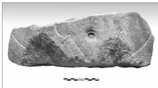
Εικ. 13. Θραύσμα φαραωνικού αγάλματος