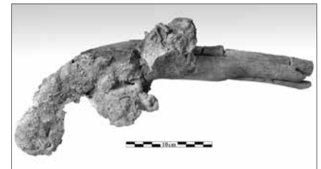
Εικ. 9. Πιστόλι ανάφλεξης με πυριτόλιθο

να (εικ. 6), που ίσως ανήκε στον Υπολοχαγό John Squire, ο οποίος ήταν αξιωματικός του πυροβολικού, ένα φορητό και δύο επιτραπέζια μελανοδοχεία, μία φορητή πυξίδα με χρυσή αλυσίδα κατασκευασμένη στο Λονδίνο και άλλα μικροαντικείμενα, όπως τρία μικρά γυάλινα φιαλίδια αρωμάτων (εικ. 7) και μία οστέινη βούρτσα για τον καθαρισμό των δοντιών. Ακόμα στα προσωπικά αντικείμενα συγκαταλέγονται ένα χρυσό νόμισμα Ουτρέχτης (1788) και ένα χρυσό Ισπανικό νόμισμα του Φερδινάνδου VI (1758) (εικ. 8) καθώς και αρκετά οθωμανικά και αραβικά νομίσματα. Βρέθηκαν ακόμη ένας σημαντικός αριθμός φιαλών και γυάλινων και πορσελάνινων σκευών, τα οποία μπορούν να σχετισθούν είτε με τα σκεύη που χρησιμοποιούνταν στο πλοίο κατά τη διάρκεια του ταξιδιού, είτε ανήκαν στην οικοσκευή ενός από τους επιβάτες. Στην εσωτερική μάλλον διακόσμηση του πλοίου πρέπει να ενταχθούν μία χάλκινη βάση και μία υποδοχή κηροπηγίου καθώς