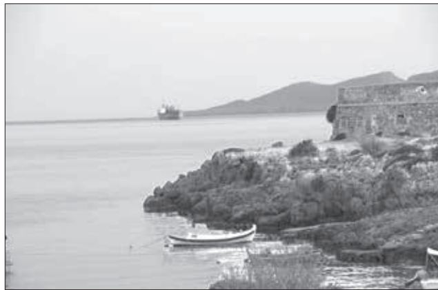
Εικ. 1. Ο όρμος του Αγίου Νικολάου