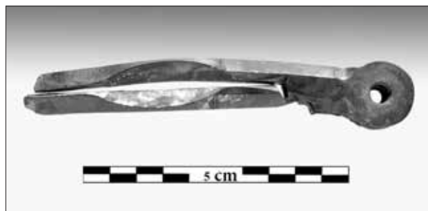
Εικ. 5. Άνω τμήμα ναυτικού διαβήτη

βαιώθηκε από την έρευνα, καθώς στον χώρο βρέθηκαν αρκετά, μικρά κυρίως, τεμάχια φύλλων χαλκού, που προέρχονται από αυτήν την επένδυση. Είναι χαρακτηριστική η επιστολή του Εμ. Καλούτση προς τον Χάμιλτον, στον οποίο ζητεί να παρέμβει προς τον Λόρδο Έλγιν, ώστε να του δοθεί η άδεια να αφαιρέσει και ανεκκύσει τα φύλλα χαλκού από το πέτωμα του πλοίου. Στο βορειοανατολικό τμήμα του διατηρημένου σκαριού υπάρχει ένας συσσωματωμένος σωρός λίθων, που σχετίζονται μάλλον με μέρος του έρματος του πλοίου. Ο χώρος αυτός ταυτίζεται με την πρύμνη του πλοίου και εκεί βρέθηκαν όπλα, πολλά μολύβδινα βόλια και προσωπικά αντικείμενα των επιβατών και του πληρώματος του πλοίου.