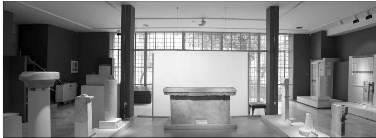
Εικ. 3. Επιγραφικό Μουσείο. Η ενότητα «αναθέτες και αναθήματα» με κεντρικό έκθεμα τον βωμό του Πεισιστράτου, γύρω από τον οποίο διατάσσονται οκτώ αρχαϊκές βάσεις αναθημάτων από την Ακρόπολη, στο κέντρο της αίθουσας 11

θεση του βωμού μνημονεύουν ο Πausanias (I.19.1), ο Στράβων (IX, 404) και ο Θουκυδίδης (6, 54.6-7), ο οποίος παραθέτει και το κείμενο της επιγραφής. Το ιερό του Πυθίου Απόλλωνος τοποθετείται στα νοτιοδυτικά του Ολυμπίου, όπως υποδεικνύει η εύρεση στην περιοχή του βωμού και ενεπίγραφων χορηγικών βάσεων τριπόδων, αναθημάτων των νικητών της εορτής των Θαργηλίων στον Πύθιο Απόλλωνα. Γύρω από τον βωμό διατάσσονται οκτώ αρχαϊκές βάσεις αναθημάτων από την Ακρόπολη, μάρτυρες της ευσέβειας, της πίστης και της ευγνωμοσύνης των Αθηναίων προς την προστάτιδα θεά τους. Από το είδος των αφιερωμάτων, το οποίο συχνά συνάγεται από τα σημάδια και τις κοιλότητες στην άνω επιφάνεια των βάσεων, καθώς και από το επιγραφικό κείμενο, συνάγονται πολύτιμες πληροφορίες για το κοινωνικό και οικονομικό επίπεδο των αναθετών.