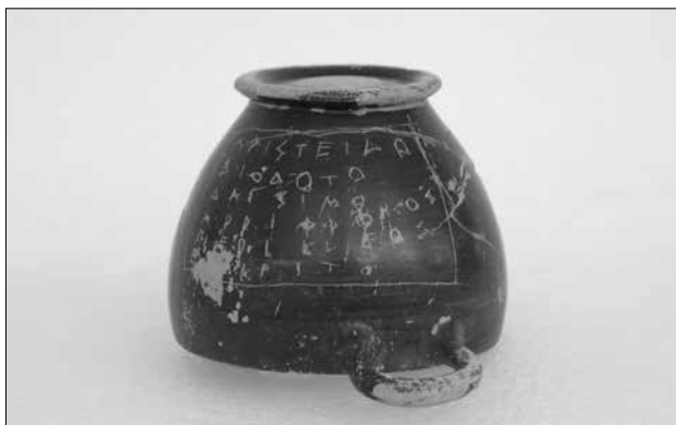
Εικ. 9. Ενεπίγραφος σκύφος από την Κηφισιά (Αρχαιολογική Συλλογή Κηφισιάς K 622). 475-429 π.Χ.

Εξέχουσα θέση στην έκθεση κατέχει ένα ιδιωτικό μνημείο (εικ. 9). Πρόκειται για ένα μελαμβαφή σκύφο που βρέθηκε σε τάφο στην περιοχή της Κηφισιάς και φυλάσσεται στην Αρχαιολογική Συλλογή Κηφισιάς.