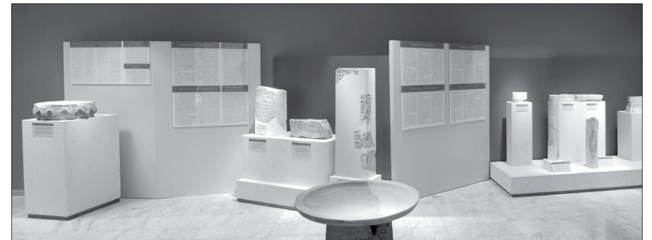
Εικ. 2. Επιγραφικό Μουσείο. Οι ενότητες «επιγραφές νομικού περιεχομένου: νόμοι και ιεροί νόμοι», «αναθηματικές επιγραφές» (κέντρο) και «αναθήματα τεκνιτών» (δεξιά) στην δυτική πλευρά της αίθουσας 11. Αριστερά το πόρινο επίκρανο από τις Μυκήνες και στο κέντρο οι τρεις πόρινες στήλες των Παναθηναίων

Ο δεύτερος θεματικός άξονας με τίτλο τα είδη των επιγραφών της Αρχαϊκής Εποχής πραγματεύεται τα βασικά είδη επιγραφών που απαντούν την περίοδο αυτή. Στην πρώτη ενότητα Επιγραφές νομικού περιεχομένου: νόμοι και ιεροί νόμοι εκτίθεται αντίγραφο της στήλης VI των νόμων της Γόρτυνος, της μεγαλύτερης και σημαντικότερης ελληνικής επιγραφής νομικού περιεχομένου (αποτελείτο από 12 στήλες μήκους 3 μέτρων) η οποία είχε αναγραφεί με βουστροφηδόν τρόπο γραφής στο