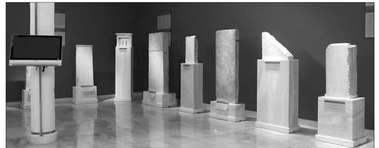
Εικ. 4. Επιγραφικό Μουσείο. Η ενότητα «αρχαίο ψήφισμα» και το κληρωτήριο στην δυτική πλευρά της αίθουσας 9

485/4 π.Χ.· η αναδημοσίευση κατά το έτος 409/8 π.Χ. του παλαιότερου (του έτους 621/20 π.Χ.) νόμου του Δράκοντος περί φόνου (EM 6602 = IG I 3 104), που περιλαμβάνει διατάξεις για το αδίκημα του ακούσιου φόνου, η ποινή για το οποίο είναι η εξορία, καθώς και για τον αιτιολογημένο φόνο ή φόνο εν αμύνη και, τέλος, το αντίγραφο ψηφίσματος του πρώτου μισού του 3ου αι. π.Χ. με το οποίο ο Θεμιστοκλής φαίνεται να εισηγείται σημαντικά μέτρα για την αντιμετώπιση της περσικής εισβολής πριν από τη ναυμαχία της Σαλαμίνας (EM 13330 = Hesperia 29, 1960, 198-223). Η δεύτερη ενότητα παρέχει πληροφοριακό υλικό για την διαδικασία έκδοσης ψηφισμάτων από την Αθηναϊκή βουλή και την εκκλησία του δήμου (εικ. 4). Παρουσιάζονται αθηναϊκά ψηφίσματα που σχετίζονται με σημαντικούς τομείς της δημόσιας ζωής, όπως το ψήφισμα για την ίδρυση αποικίας στην Βρέα (EM 6577 = IG I 3 46), ένα ψήφισμα προς τιμήν ξένου πολίτη, του Οινιάδη του Παλαιοκιάθιου (EM 6796 = IG I 3 110), δύο τροπολογίες σε ψήφισμα που σχετίζεται με την βελτίωση του συστήματος ύδρευσης των Αθηνών, στο οποίο αναφέρονται οι γιοι του Περικλέους Πάραλος και Ξάνθιππος (EM 6849 = IG I 3 49), το ψήφισμα για την προσφορά των πρώτων καρπών (απαρχαί) στην Δήμητρα και την Περσεφόνη στην Ελευσίνα (EM 10050 = IG I 3 78) και το ψήφισμα για την εκμίσθωση του τεμένους του Κόδρου, Νηλέως και Βασίλης, στο