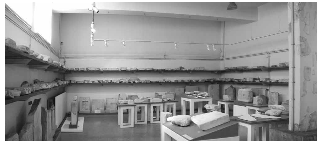
Εικ. 8. Επιγραφικό Μουσείο. Άποψη της περιοδικής έκθεσης «Η των Αθηναίων Αρχή» στην αίθουσα 1

θεμάτων νομισματικής κυκλοφορίας, όπως εικάζεται από την επανάληψη της λέξης «νόμισμα» (στίχοι 12-13, 15-17), την χρήση του όρου «καταλάττειν» (στίχος 14), που χρησιμοποιείται για την ανταλλαγή νομισμάτων διαφορετικού τύπου, την αναφορά σε «χρυσίον» (στίχος 9) και την μνεία του Λαυρίου (στίχος 11), όπου βρίσκονταν τα ορυχεία του αργύρου, της πρώτης ύλης για την παραγωγή των αττικών τετραδράχμων. Ενδεικτική του χρηματιστικού χαρακτήρα της Αθηναϊκής οικονομίας είναι ακόμα η αναφορά στο ίδιο ψήφισμα σε «τράπεζες» ή σε «τραπεζίτες» (στίχος 19).