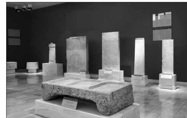
Εικ. 5. Επιγραφικό Μουσείο. Η ενότητα «λατρεία» και στη νοτιοδυτική γωνία της αίθουσας 9 οι «χορηγικές επιγραφές»

που αποσκοπούσε αρχικά στη στρατιωτική και από τον 3ο αι. π.Χ. και εξής στην γενικότερη εκπαίδευση των νέων (εικ. 6). Η δημοσίευση καταλόγων εφήβων σε στήλες ή ανάγλυφες ασπίδες ακολουθούσε συνήθως την απόφαση του Αθηναϊκού Δήμου για την απονομή τιμών στον κοσμητή, τους ίδιους τους εφήβους και τους διδασκάλους τους μετά την ολο-