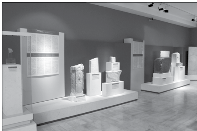
Εικ. 1. Επιγραφικό Μουσείο. Οι ενότητες «η προέλευση του ελληνικού αλφαβήτου και οι πρώιμες ελληνικές επιγραφές», «τρόποι γραφής» και «τοπικά αλφάβητα» στη νότια πλευρά της αίθουσας 11. Αριστερά σε προθήκη η αρχαιότερη σωζόμενη αττική επιγραφή σε λίθο

Στην ενότητα οι τρόποι γραφής των αρχαίων παρουσιάζονται οι διαφορετικοί τρόποι γραφής και διάταξης των κειμένων στις αρχαϊκές ελληνικές επιγραφές μέσω τεσσάρων ενεπιγράφων μνημείων και ακολούθως τα τοπικά αλφάβητα (εικ. 1) με παραδείγματα αλφαβήτων από διάφορες περιοχές της Ελλάδος (Θήρα, Κόρινθος, Αμοργός, Άργος). Εξέχουσα θέση κατέχει η στήλη EM 22 (IGI 3 1143), στην οποία σώζεται ένας στίχος από το επιτύμβιο επίγραμμα του Σιμωνίδη για τους πεσό-