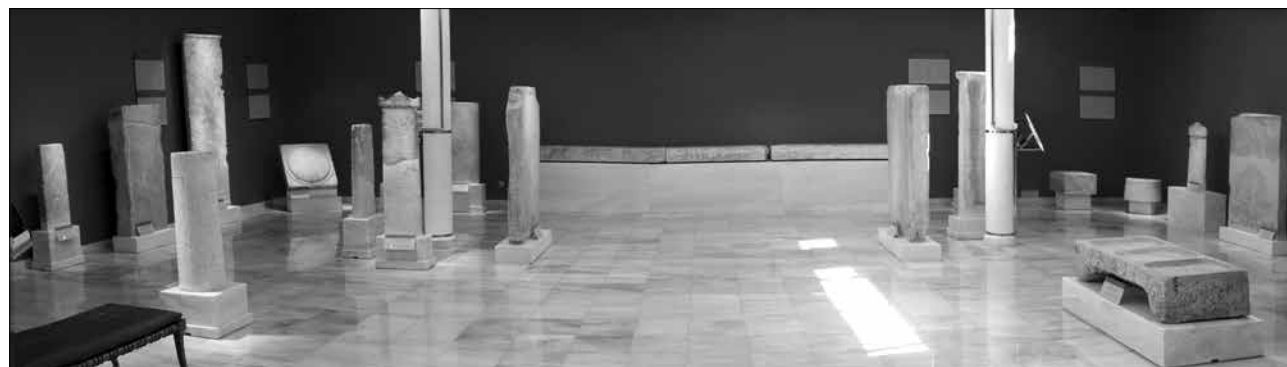
Εικ. 6. Επιγραφικό Μουσείο. Οι ενότητες «οροηγικές επιγραφές» και «τα δημόσια επιτύμβια μνημεία για τους πεσόντες πολεμιστές». Στο κέντρο της ανατολικής πλευράς της αίθουσας η μεγάλη επιτύμβια βάση EM 12745-47

Στόχος μας είναι η περαιτέρω ενίσχυση της συγκεκριμένης ψηφιακής εφαρμογής ώστε να εισαχθεί πληροφοριακό υλικό και για τα εκθέματα των άλλων αιθουσών και να δημιουργηθούν καθοδηγούμενες θεματικές περιηγήσεις σε προεπιλεγμένα μνημεία, ανάλογα με τα ενδιαφέροντα του κάθε επισκέπτη. Προγραμματίζεται επίσης η δημιουργία ηλεκτρονικών εκπαιδευτικών-ψυχαγωγικών εφαρμογών με στόχο την εκπαίδευση