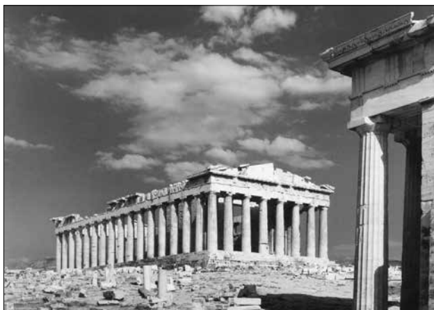
Ο Παρθενών από ΒΑ. Carte postale, δεκαετία 1950. Στο πίσω μέρος φέρει ιδιόχειρη σημείωση του Γ.Μ.: «Ο Παρθενώνας. Μπορείτε να τον φανταστήτε κάτω από ένα πελώριο στέγαστρο; Φυσικά τότε δεν θα τον στολίζουν τό γαλάζιο τ' ουρανό και τά σύννεφα».

Η κατεδάφιση του «μιναρέ» συζητείται σε συνεδρίαση του Α.Σ. την 8η Δεκεμβρίου 1953. Υπέρ της τάσσονται οι Αναστάσιος Ορλάνδος, Χρήστος Καρούζος και ο Γιάννης Μηλιάδης, εναντίον ο Σπυρίδων Μαρινάτος και ο Γεώργιος Σωτηρίου, ενώ ο Διονύσιος Ζακυνθινός προτείνει, λόγω της σπουδαιότητας του ζητήματος, να ζητηθεί η άποψη της διεθνούς επιστημονικής κοινότητας, πρόταση που δεν γίνεται αποδεκτή. Κατά τη συζήτηση ο Μηλιάδης τονίζει ότι «Αναμφισβητήτως ζῶμεν σήμεραν εις περίοδον ιστορισμού, πρέπει δέ να κάμωμεν τήν διάκρισιν μεταξύ εξωτερικού ιστορισμού και