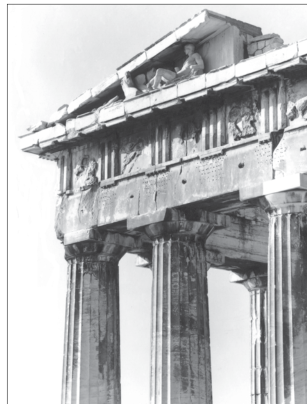
Η ΝΑ γωνία του Παρθενόνος, Φωτ. Β. και Ν. Τομπάζη, δεκαετία 1950. Στο πίσω μέρος φέρει ιδιόχειρη σημείωση του Γ.Μ.: «Η Ν.Α. γωνία τού Παρθενώνα. Οι άρχαίες μετόπες πού έχουν άπομείνει στην άρχική τους θέση είναι αρκετά βασανισμένες από τό χρόνο καί τούς βανδαλισμούς τών ανθρώπων. Τίς άποτελειώνουν τά καυσαέρια. Στη γωνία τού άετόματος τό ξαπλωτό άγαλμα είναι γύμνωτο έκμαγειό». Αρχείο ΕΣΜΑ

κατάστασις τών μνημείων Ακροπόλεως είναι πολύ χειρότερα άπ' όσον τήν παρουσιάζω εις τό προηγούμενον έγγραφόν μου... Είναι άληθές ότι έγινοντο αρκετά αναστηλωτικά έργασία περισσότερον ή λιγώτερον έπιτυχείς... Ειργάσθημεν μάλλον διά τήν επίτευξιν έντυπωσιακών άποτελεσμάτων, όχι άναξίων λόγου βεβαίως, αλλά έχομεν παραμελήσει επί μακρόν τās συντηρητικές έργασίας, αί όποια σώζουν χωρίς νά έντυπωσιάζουν. Εις τās αναστηλώσεις μας παρατηρείται κάποια έγώιστική προβολή τών αναστηλωτών – καί ή τάσις αύτη άρχίζει από τήν εποχήν τού μακαρίτου Μπαλάνου– ενώ αί έργασία συντηρήσεως δέν προσκομίζον δόξαν...»