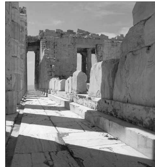
Τὸ νότιον πτερόν τοῦ Παρθενῶνα ἀπὸ Α. Φωτ. Δ. Χαρισιάδη, δεκαετία 1950. Ἀρχεῖο ΕΣΜΑ

ἀκόμη καί τὴν μεσαιωνικὴν μορφήν τοῦ τόπου, καί νά διδάξουν τὸν ἐπισκέπτην κατὰ τὸν πλέον εὐχάριστον καί εὐκόλον τρόπον... Οὕτω τὸ διαμέρισμα τοῦτο θ' ἀποβῆ μίαν πραγματικὴ Πινακοθήκη ἢ, ὅπως θά ἐλέγομεν σήμερον, μίαν ἀξιόλογον καί διδακτικὴν διαρκῆς ἐκθεσίς. Πρέπει νά ὁμολογήσωμεν ὅτι ὁ συνήθης ἐπισκέπτης ἀποκομίζει σήμερον φεύγων ἀπὸ τὴν Ἀκρόπολιν μίαν πολὺ ἀποσπασματικὴν ἐντύπωσιν ἐκ τῶν Μνημείων, μὴ δύναμενος νά σχηματίσῃ μίαν συνθετικὴν εἰκόνα τοῦ τόπου...» Καί συνεχίζει: «...Ἡ πρότασις μου αὕτη, συν-