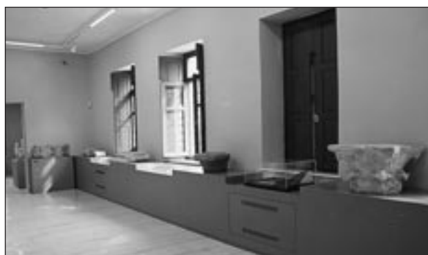
Εικ. 4. Αρχαιολογικό Μουσείο