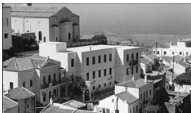
Εικ. 3. Αρχαιολογικό Μουσείο

Τέλος θα πρέπει στο μέλλον να προβλεφθούν οι ανάλογες διαμορφώσεις και κατασκευές για την επίσκεψη στο Μουσείο ατόμων με προβλήματα μειωμένης κινητικότητας. Οι διαμορφώσεις αυτές περιλαμβάνουν: α) κατασκευή ράμπας ανόδου από το επίπεδο του δρόμου στο ισόγειο και β) εγκατάσταση ηλεκτροκίνητου καθίσματος ανόδου-καθόδου προσαρμοσμένου στην κουπαστή της σκάλας, που οδηγεί στον 1 ο και β' όροφο.