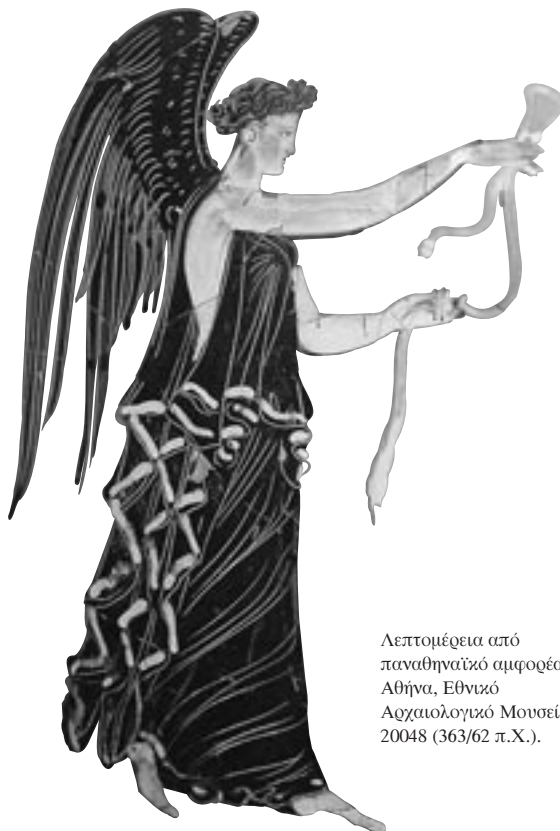
Λεπτομέρεια από παναθηναϊκό αμφορέα, Αθήνα, Εθνικό Αρχαιολογικό Μουσείο 20048 (363/62 π.Χ.).

Τα επιμέρους θέματα που θα παρουσιασθούν είναι πρωτότυπα και αναφέρονται: στις καταβολές των Αγώνων, στη λαμπαδηφορία, στους δραματικούς αγώνες, στη συμμετοχή ελληνιστικών ηγεμόνων και του Ηρώδη Αττικού στα Παναθήναια, στα γλυπτά αναθήματα που σχετίζονται με τους αγώνες και, τέλος, στους περίφημους Παναθηναϊκούς αμφορείς, τα πολύτιμα έπαθλα που δίδονταν στους νικητές των αγώνων. Όλα τα πιο πάνω θέματα θα αποτελέσουν, νομίζω, μια νέα συμβολή στη γνώση μας για τους αγώνες των Παναθηναίων, καθώς πρόκειται να εκδοθούν και πρακτικά.