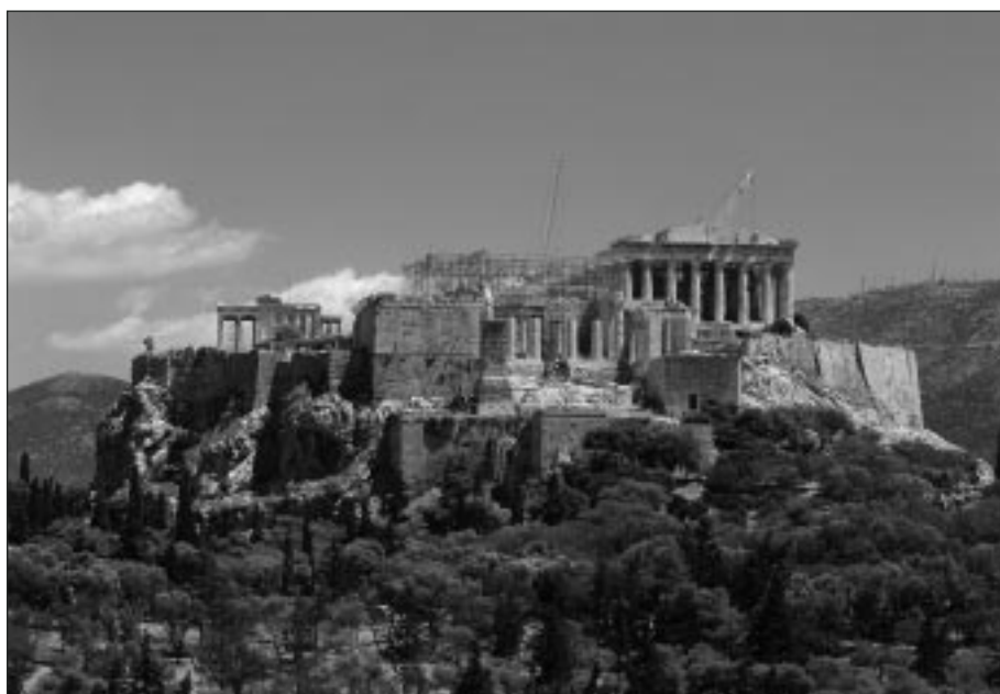
Η Ακρόπολη υπό αναστήλωση. Γενική άποψη από δυτικά.

και άλλες επεμβάσεις, τις οποίες η ΕΣΜΑ και η ΥΣΜΑ έχουν προγραμματίσει. Πρόκειται για επεμβάσεις που επιβάλλονται από την κατάσταση διατήρησης περιοχών των μνημείων και αποβλέπουν, εκτός από τη θεραπεία των προβλημάτων, στην ένταξη στα μνημεία αρχαίων μελών που αναγνωρίστηκαν και την αποκατάσταση περιοχών, που θα αυξήσουν την αναγνωσιμότητά τους. Ο Υφυπουργός Πολιτισμού αναγνωρίζοντας την ανάγκη συνέχισης των επεμβάσεων, ζήτησε από την ΥΣΜΑ προγραμματισμό όλων των έργων που απαιτούνται για την πλήρη δομική αποκατάσταση και συντήρηση των μνημείων. Στον προγραμματισμό, που υποβλήθηκε από την ΥΣΜΑ τον Φεβρουάριο του 2005, έγινε μία πρώτη προσέγγιση των μεγεθών όσον αφορά στο χρονοδιάγραμμα και στους προϋπολογισμούς. Οι χρονικές και οικονομικές εκτιμήσεις του προγραμματισμού έγιναν με την προϋπόθεση της διατήρησης των σημερινών συνθηκών, δηλαδή της απρόσκοπτης χρηματοδότησης των έργων και του συνόλου του εξειδικευμένου προσωπικού. Για αρκετές από τις προτεινόμενες επεμβάσεις υπάρχουν ήδη ολοκληρωμένες μελέτες. Απομένει στην Πολιτεία, η οποία έχει την τελική ευθύνη, να τις αποφασίσει και να εξασφαλίσει τις προϋποθέσεις για την ολοκλήρωση των έργων στα μνημεία της Ακρόπολης.