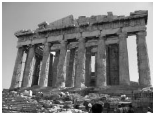
Εικ. 7: Ο Παρθενών από ΝΑ. Διακρίνεται ο οπισθόναος, μετά την επέμβαση του 1997-2004 (Φωτ. 2005)