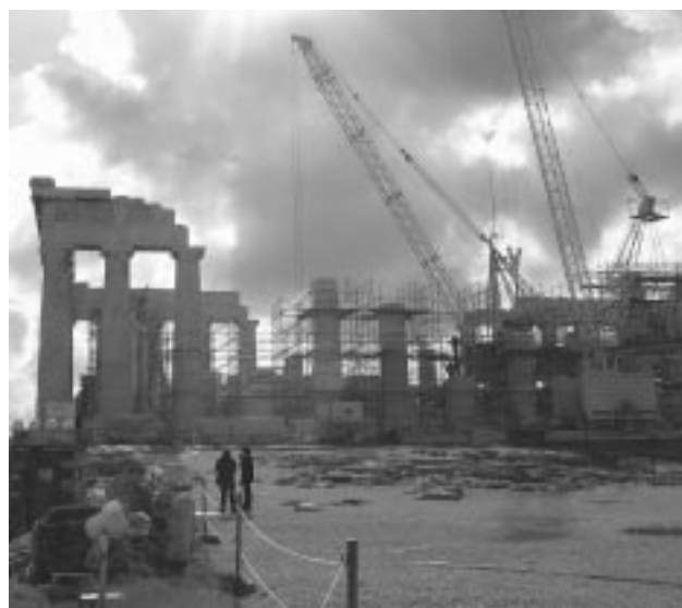
Εικ. 4: Αποψη του Παρθενώνα από Β. Διακρίνονται οι γερανοί του εργοταξίου (Φωτ. 2005)