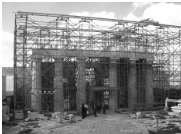
Εικ. 12: Η υπό αναστήλωση οροφή της ανατολικής στοάς των Προπυλαίων το 2005. Αποψη από ΝΑ.