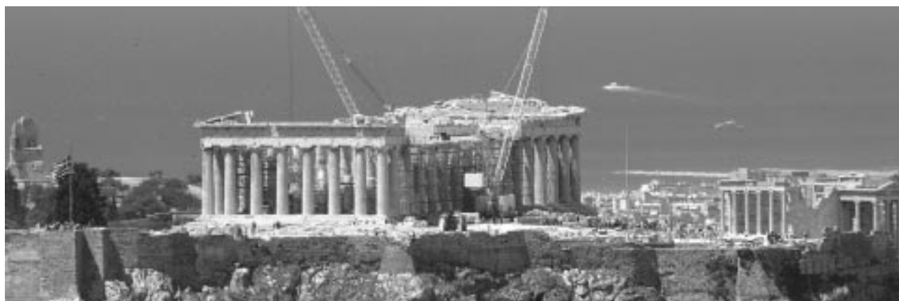
Εικ. 16: Η Ακρόπολη από τον Λυκαβηττό

στήμη και την τεχνολογία του τέλους του 20ου και των αρχών του 21ου αιώνα, ενώ ταυτόχρονα ανταποκρίνεται στην κύρια κοινωνική απαίτηση της εποχής μας για μεγαλύτερη και αμεσότερη κατανόηση, απόλαυση και βίωση των πατρογονικών πολιτιστικών κλημάτων. Ένας κίνδυνος ελλοχεύει: μήπως η νέα αναστήλωση της Ακρόπολης ανταποκριθεί και στο άλλο κυρίαρχο σύγχρονο αίτημα, την πολιτιστική (υπέρ)κατανάλωση. Αυτό είναι μια πρόκληση και στοίχημα μαζί, που την τελική του έκβαση θα καθορίσουν, σε τελευταία ανάλυση, η παιδεία, η καλλιέργεια και η αισθητική εκείνων που εκτελούν τα έργα και, κυρίως, τα επιβλέπουν.