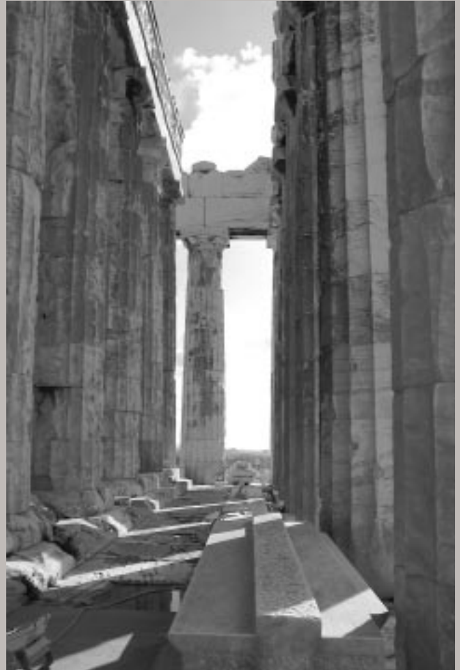
Ο οπισθόναος του Παρθενώνα το 2005, μετά την πρόσφατη επέμβαση. Αποψη από Β.

ΕΠΕΤΕΙΑΚΟ ΑΦΙΕΡΩΜΑ ΓΙΑ ΤΑ 30 ΧΡΟΝΙΑ ΑΝΑΣΤΗΛΩΤΙΚΩΝ ΕΡΓΩΝ ΣΤΗΝ ΑΚΡΟΠΟΛΗ