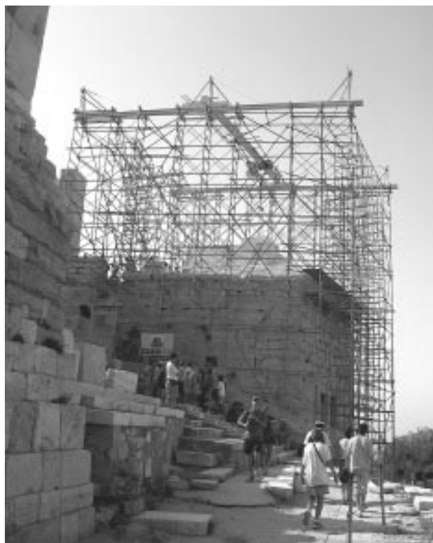
Εικ. 15: Ο υπό αναστήλωση ναός της Αθηνάς Νίκης. Άποψη από ΒΔ. (Φωτ. 2005)

• Η διαπίστωση ότι ο κατακεραματισμός των αρχιτεκτονικών μελών είχε επεκταθεί και σε τμήματα των μνημείων που ουδέποτε είχαν αναστηλωθεί στο παρελθόν (διαπίστωση που προέκυψε μετά την αποσυναρμολόγηση των παλαιότερα αναστηλωμένων, περιοχών) κατέστησε αναπόφευκτη την επέκταση των επεμβάσεων και σε αυτές τις περιοχές. Χαρακτηριστικές σχετικά περιπτώσεις αποτέλεσαν η περιοχή του βόρειου τοίχου του Ερεχθείου πάνω από το βόρειο θύρωμα, ο θριγκός και το κεντρικό τμήμα το αετώματος της ανατολικής όψης του Παρθενώνα, το ανατολικότερο άκρο του νότιου τοίχου του κεντρικού κτηρίου των Προπυλαίων. Τα τμήματα αυτά, σε όλες τις περιπτώσεις, αποσυναρμολογήθηκαν, τα μέλη τους συντηρήθηκαν στο έδαφος και στη συνέχεια ανατοποθετήθηκαν στο μνημείο.