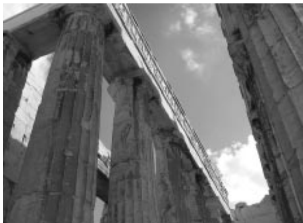
Εικ. 8: Τα αντίγραφα της δυτικής ζωφόρου, κατά χόραν, στον Παρθενώνα (Φωτ. 2005)

βαθμό, αλλάζουν την παραδεδομένη εικόνα της Ακρόπολης, κατά τρόπο σημαίνοντα, όχι όμως δραματικό. Οι καθαυτό αναστηλωτικές επεμβάσεις ξεκίνησαν το 1979 από το Ερεχθείο, για να επεκταθούν στη συνέχεια σε όλα τα μνημεία της Ακρόπολης. Η αναστήλωση του Ερεχθείου ολοκληρώθηκε το 1987. Το 1986 άρχισε η αναστήλωση του Παρθενώνα. Εκεί, λόγω της κλίμακας του ναού, η επέμβαση χωρίστηκε σε επιμέρους προγράμματα, ανά περιοχές του μνημείου. Το 1986-1991 αποκαταστάθηκε η ανατολική πρόσοψη, που είχε υποστεί μεγάλες βλάβες στον σεισμό του 1981. Από το 1995 έως το 2004 αναστηλώθηκε ο πρόναος του μνημείου, από το 1997 έως το 2004 ο οπισθόναος. Οι εργασίες συνεχίζονται στη βόρεια κιονοστοιχία του Παρθενώνα, ενώ στο μέλλον προβλέπεται να περιλάβουν τη νέα αναστήλωση των πλάγιων τοίχων του σηκού, της νότιας κιονοστοιχίας και την αποκατάσταση του δυτικού του τμήματος. Στα Προπύλαια αποσυναρμολογήθηκαν τα αναστηλωμένα στις αρχές του 20ου αιώνα τμήματα (η οροφή της δυτικής αίθουσας του κεντρικού κτηρίου και το ανα-