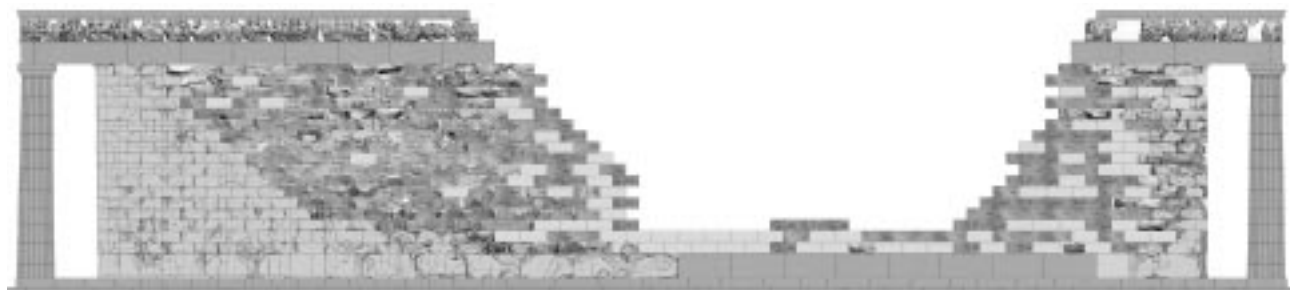
Εικ. 9: Πρόταση αποκαταστάσεως του νότιου τοίχου του Παρθενώνα (Φωτογραφικό ανάπτηγμα Κ. Παράσχη - Σ. Μανουμάτη)

στηλωμένο τμήμα της κιονοστοιχίας, του θριγκού και της οροφής της ανατολικής στοάς) και από το 2000 άρχισε με γοργούς ρυθμούς η νέα αναστήλωσή τους, μια επέμβαση που προβλέπεται να ολοκληρωθεί το 2006. Το 2006 προβλέπεται επίσης να ολοκληρωθεί η νέα αναστήλωση –η τρίτη κατά σειρά– του ναού της Αθηνάς Νίκης, η οποία άρχισε και αυτή το 2000. Εκτός από τις επεμβάσεις στα μνημεία, κατασκευάστηκαν διαβάσεις κυκλοφορίας επισκεπτών πάνω στο πλάτωμα του Βράχου της Ακρόπολης, ενώ στερεώθηκαν οι βράχοι στις κλιτύς του λόφου. Πρόκειται για μια επέμβαση που πραγματοποιήθηκε στο διάστημα 1979-1993, στη διάρκεια της οποίας, οι ετοιμόρροποι βράχοι στερεώθηκαν με αγκυρώσεις στη μάζα του πετρώματος, από κράμα ανοξείδωτου χάλυβα υπό ένταση. Στα μελλοντικά έργα περιλαμβάνεται η στερέωση του περιμετρικού Τείχους της Ακρόπολης και η οριστική διαμόρφωση του πλατώματος του Βράχου. Κατά τις επεμβάσεις, οι αναστηλωμένες στο παρελθόν περιοχές των μνημείων αποσυναρμολογούνται και τα ρηγματωμένα ή και κατακεραματισμένα αρχιτεκτονικά