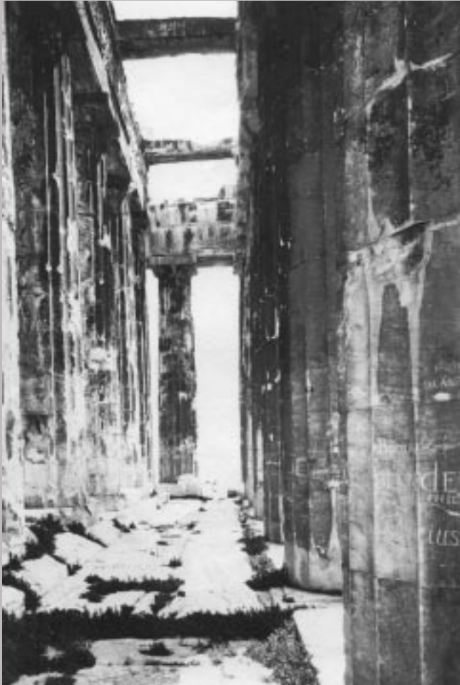
Ο οπισθόναος του Παρθενώνα το 1873-1875. Αποψη από Β.