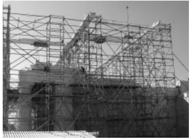
Εικ. 11: Ο βόρειος τοίχος του κεντρικού κτηρίου των Προπυλαίων, μετά την πρόσφατη μερική αναστήλωσή του (2003-2004)

τους μέλη αποκαθίστανται στο έδαφος. Τα σκουριασμένα σίδηρα αφαιρούνται και αντικαθίστανται με τιτάνιο, τα θραύσματα συγκολλώνται, όπου χρειάζεται, τα αρχαία μέλη συμπληρώνονται με νέο πεντελικό μάρμαρο: πρόκειται για εργασίες που στοχεύουν στο να αποδώσουν εκ νέου στα μέλη τη δομική τους αυτοτέλεια και τη στατική τους επάρκεια. Ακολουθεί η ανατοποθέτηση των αποκατεστημένων μελών στο μνημείο, κατά την οποία επιδιώκεται αυτά να αναστηλωθούν στις θέσεις που κατείχαν κατά την αρχαιότητα. Όταν αυτό δεν είναι εφικτό, τα μέλη ανατοποθετούνται στα μνημεία, είτε όπως είχαν αναστηλωθεί στο παρελθόν, είτε σε θέσεις ομόλογες προς την αρχική τους, δηλαδή σε θέσεις συμβατές με τη μορφή και τη λειτουργία, την οποία αυτά είχαν αρχικά. Έως τώρα δεν έχει βρεθεί ένα προστατευτικό υλικό επικάλυψης της επιφάνειας του μαρμάρου των μνημείων –που φθείρεται συνεχώς και ανεπανόρθωτα από την ατμοσφαιρική ρύπανση– με βέβαιη συμπεριφορά στον χρόνο. Για τον λόγο αυτό, ο πλαστικός διάκοσμος των μνημείων –οι Καρυάτιδες του Ερεχθείου, οι ανατολικές μετόπες του Παρθενώνα, τα τελευταία εναπομείναντα στα αετώματά του αγάλματα, η δυτική ζωφόρος, η ζωφόρος του ναού της Αθηνάς Νίκης– απομακρύνεται και μεταφέρεται στο Μουσείο Ακροπόλεως. Πάνω στα μνημεία, τα γλυπτά αντικαθίστανται με πιστά αντίγραφα, κατασκευασμένα από τεχνητό λίθο. Τέλος, από το 1986, παράλληλα με τις εργασίες δομικής αποκατάστασης των μελών, έχουν αρχί-