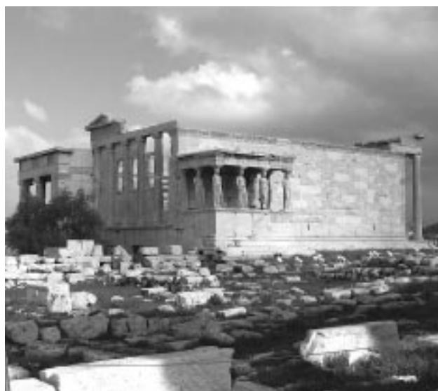
Εικ. 3: Αποψη του Ερεχθείου από ΝΑ. μετά την επέμβαση του 1979-1987 (Φωτ. 2005)