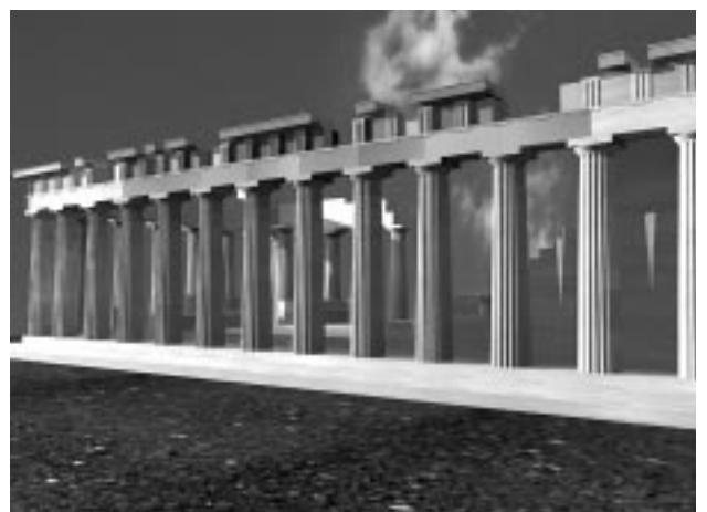
Εικ. 6: Η βόρεια πλευρά του Παρθενώνα μετά τη νέα αναστήλωσή της (Φωτορραλιστική απεικόνιση Πλ. Κωνσταντόπουλος)

μέλη να ανατοποθετηθούν στα μνημεία. Στη συνέχεια των έργων προέκυψαν διάφορες καταστάσεις, οι περισσότερες μάλιστα και απρόβλεπτες, που οδήγησαν σε ευρύτερες επεμβάσεις αποκατάστασης των μνημείων, που ως στόχο έχουν, επιπροσθέτως, τη διόρθωση των λαθών των παλαιότερων αναστηλώσεων, τη γενικότερη βελτίωση της κατάστασης διατήρησης των μνημείων και την ανάδειξη των εγγενών αξιών και ποιοτήτων τους σε ολόκληρο τον πλούτο τους. Πρόκειται για επεμβάσεις που, έως κάποιο