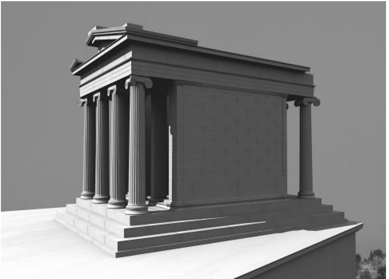
Εικ. 14: Ο ναός της Αθηνάς Νίκης από ΒΑ (Φωτορρεαλιστική απεικόνιση Πλ. Κωνσταντόπουλος)

Όπως προαναφέρθηκε, κατά την εκτέλεση των επεμβάσεων, προέκυψαν διάφοροι παράγοντες, οι περισσότεροι απρόβλεπτοι, που επέδρασαν καθοριστικά