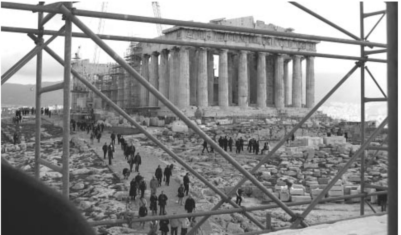
Εικ. 5: Το πλάτωμα της Ακρόπολης και ο Παρθενών από τον θριγρό της ανατολικής στοάς των Προπυλαίων. Διακρίνεται η διάβαση κυκλοφορίας των επισκεπτών και η υπό αναστήλωση βόρεια κιονοστοιχία του Παρθενώνα (Φωτ. 2005)

οντας ότι κατ' αυτόν τον τρόπο θα αντιμετώπιζε το ζήτημα της οξειδωσής τους. Στα μεταπολεμικά χρόνια η οξειδωση αυτών των σιδηρών φορέων –ραγδαία, εξαιτίας της δραστηκής αλλαγής των περιβαλλοντικών συνθηκών– θα οδηγήσει στον κατακερματισμό των μνημείων, επιβάλλοντας ως αναπόφευκτη τη νέα αναστήλωσή τους. Η νέα επέμβαση έπρεπε επίσης να αντιμετωπίσει τη ραγδαία φθορά της επιφάνειας του μαρμάρου των μνημείων εξαιτίας της ατμοσφαιρικής ρύπανσης του περιβάλλοντος, την επισφαλή στατική κατάσταση των μνημείων εξαιτίας της ερείπωσής τους, τα προβλήματα και τις φθορές που το ολόένα αυξανόμενο πλήθος των επισκεπτών της Ακρόπολης επέφεραν στα μνημεία της αλλά και στο ίδιο το πλάτωμα του Βράχου, το οποίο και αυτό αποτελεί αυτοτελές μνημείο, καθώς φέρει τα ίχνη μιας μακραίωνης ιστορίας.