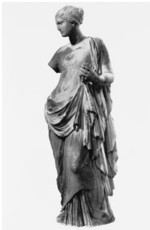
Εικ. 7: Αγαλμάτιο Νύμφης. Μουσείο Δήλου

Θα τελειώσω με δύο θέματα της Δήλου, με τα οποία ασχολήθηκε ο Marcadé, που έχουν άμεση σχέση με την Ακρόπολη. Το ένα είναι η ερμαϊκή στήλη (εικ. 8), το κεφάλι της οποίας αναγνώρισε και συγκόλλησε ο Marcadé. Γνωρίζουμε την ακριβή χρονολόγηση από την επιγραφή της βάσης, που αναφέρει τον Αθηναίο άρχοντα Νικόμαχο του 341/340 π.Χ. Η στήλη ήταν στημένη στην είσοδο του δηλιακού ιερού, όπου έχει