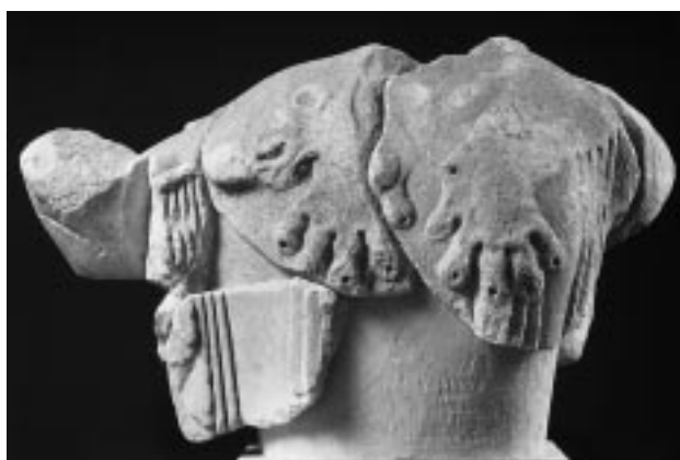
Εικ. 4: Η Άρτεμη από το σύνταγμα των Θεών. Μουσείο Δήλου

στο Δωδεκάθεο, δεν έχει αποκαλυφθεί κάτι συγκεκριμένο, μια βάση π.χ. που θα έδινε στοιχεία για το πώς θα ήταν στημένο αυτό το πρώιμο σύνταγμα με τις έξι τουλάχιστον θεότητες, την Απολλώνια Τριάδα από τη μία, τον Δία, την Αθηνά και την Ήρα από την άλλη. Έχουν όμως βρεθεί περισσότεροι βωμοί σε αυτή τη θέση, μεταξύ των οποίων ο ένας ενεπίγραφος αφιερωμένος στην Αθηνά, τον Δία και την Ήρα, που υποδηλώνουν ότι μπορεί να υπήρχε εκεί μια αγορά θεών. Στο BCH 75, 1951, “ Les sculptures décoratives du Monument des Taureaux à Délos ”, δημοσίευσε τα αρχιτεκτονικά γλυπτά του Μνημείου των Ταύρων.