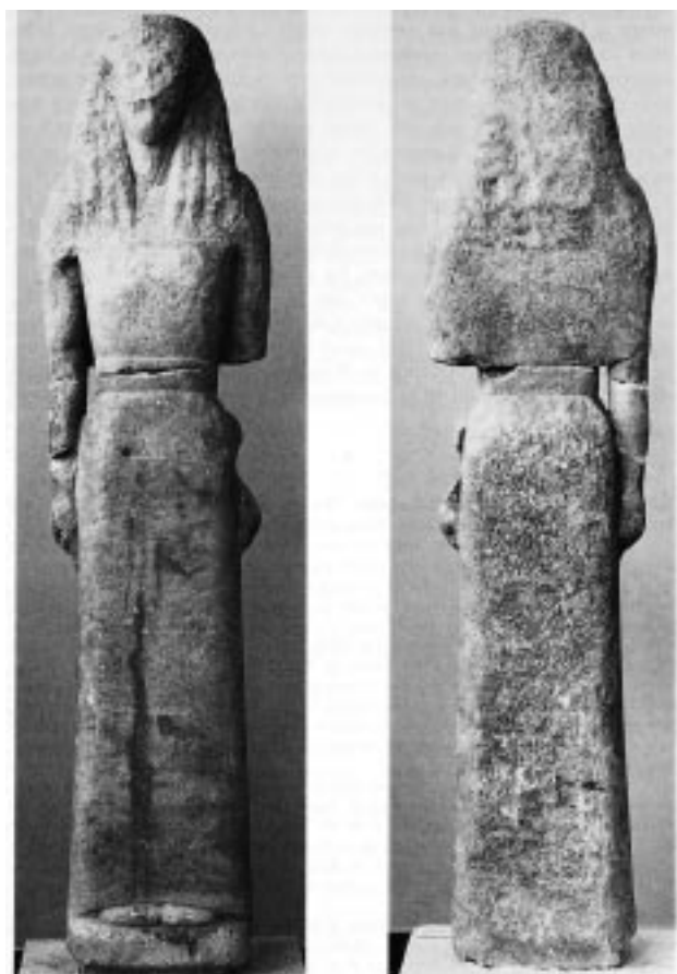
Εικ. 2: Η Νικάνδρη. Αθήνα, Εθνικό Αρχαιολογικό Μουσείο