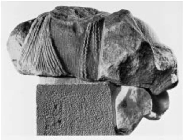
Εικ. 5: Ο Απόλλων από το σύνταγμα των Θεών. Μουσείο Δήλου

Το μακρόστενο κτήριο είχε διακόσμηση με ανάγλυφα ζωφόρο στο εσωτερικό του σηκού, με θέματα μάχης παρουσία των θεών, άλλες ζωφόρους με θαλάσσιο θίασο στη μακρόστενη στοά και στον πρόδομο. Τα ανάγλυφα, πολύ φθαγμένα, δεν δίνουν πολλά στοιχεία. Το ενδιαφέρον της μελέτης εστιάζεται στην απόδοση σε αυτό μιας Νίκης ως ακρωτηρίου (εικ. 6). Έως τότε, η μορφή είχε θεωρηθεί Νύμφη και αποδιδόταν λανθασμένα στο σύμπλεγμα του Βορέα και της Ορείθυιας από το κεντρικό ακρωτήριο στο ανατολικό αέτωμα του ναού των Αθηναίων. Η Νίκη, με τον συμβολισμό της, δείχνει ότι το Μνημείο των Ταύρων είναι ένα μνημείο νικητήριο.