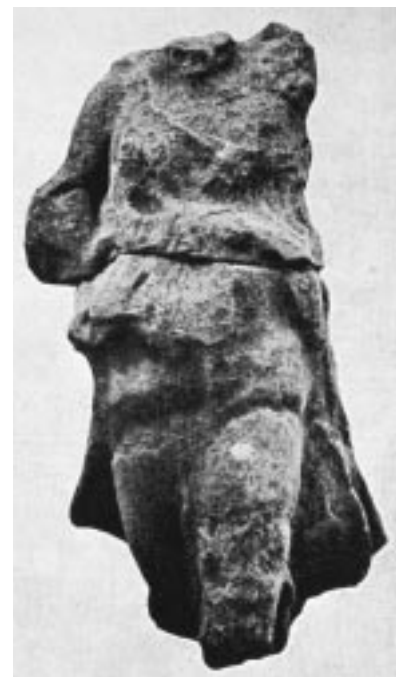
Εικ. 6: Νίκη-ακρωτήριο από το Μνημείο των Ταύρων. Μουσείο Δήλου

Στη μελέτη “Chapiteaux circulaires et chapiteaux doriques de colonnes votives déliennes”