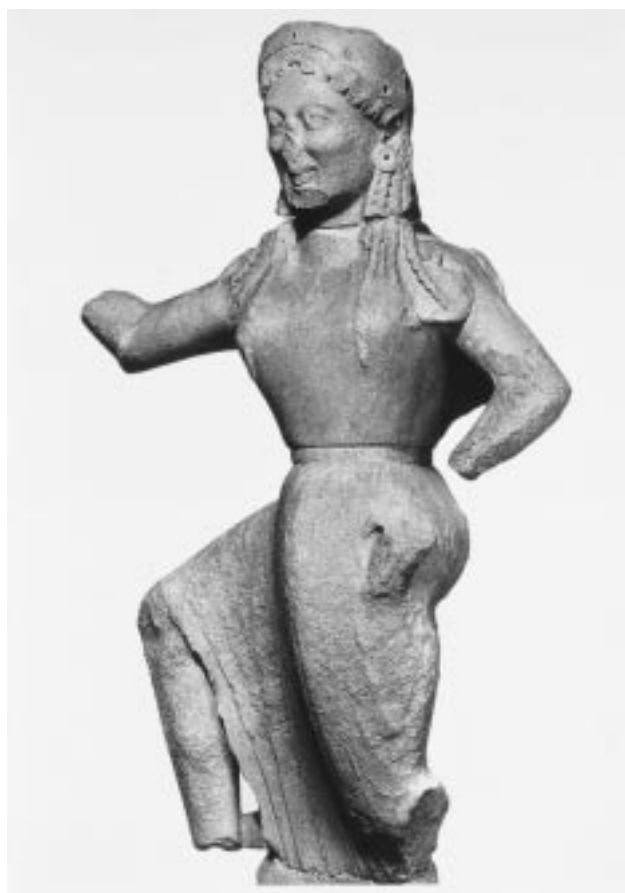
Εικ. 1: Η Νίκη του Αρχέμου. Αθήνα, Εθνικό Αρχαιολογικό Μουσείο

Για την αρχαϊκή περίοδο οι συγκολλήσεις έγιναν σε μεμονωμένα έργα, όπως η Νίκη του Αρχέμου (εικ. 1), στην οποία συγκόλλησε τα δύο χέρια και το ανάθημα της Νικάνδρης (εικ. 2), στην οποία συγκόλλησε τον δεξιό πήχη. Αυτά αναφέρονται παρεμπιπτόντως στο BCH 74 , 1950, στη μελέτη του “Notes sur trois sculptures archaïques récemment reconstituées à Délos”. Αργότερα, στο άρθρο του “La pélerine de l’Artemis de Nikandré”, στον τιμητικό τόμο