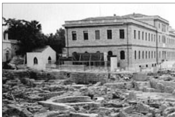
Γενική άποψη της ανασκαφής στον χώρο του Νέου Μουσείου Ακροπόλεως

σκαφής του Νέου Μουσείου Ακροπόλεως, που θα διατηρηθεί ορατό και επισκέψιμο, ορίζεται από δυο δρόμους και περιλαμβάνει κυρίως μεγάλο κτηριακό συγκρότημα του 7ου αι. μ.Χ. μία παλαιοχριστιανική οικία του 5ου αι. μ.Χ. και ένα λουτρό του 3ου αι. μ.Χ., που ήταν σε χρήση έως τον 7ο αι. μ.Χ. Είναι προφανές, ότι έχουμε κατάλοιπα της μεταβατικής