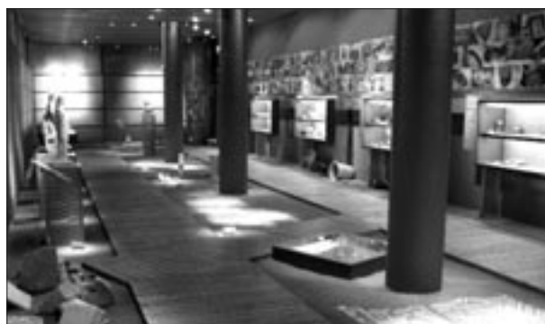
Γενική άποψη της έκθεσης «Το Μουσείο και η ανασκαφή» στο Κέντρο Μελετών Ακροπόλεως

περιόδου από την ύστερη αρχαιότητα έως τους βυζαντινούς χρόνους.