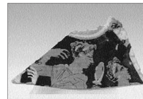
Όστρακα κλασικών χρόνων από την ανασκαφή του χώρου του Νέου Μουσείου Ακροπόλεως με παραστάσεις γυναικών που γνέθουν (αριστερά) και καλλωπίζονται (δεξιά)