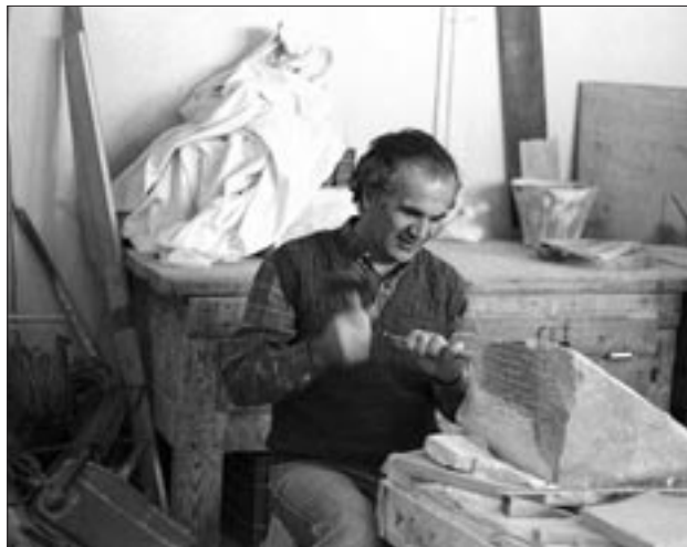
Ο αρχιτεκνίτης του έργου αποκαταστάσεως του Παρθενώνος Φρ. Αλεξόπουλος