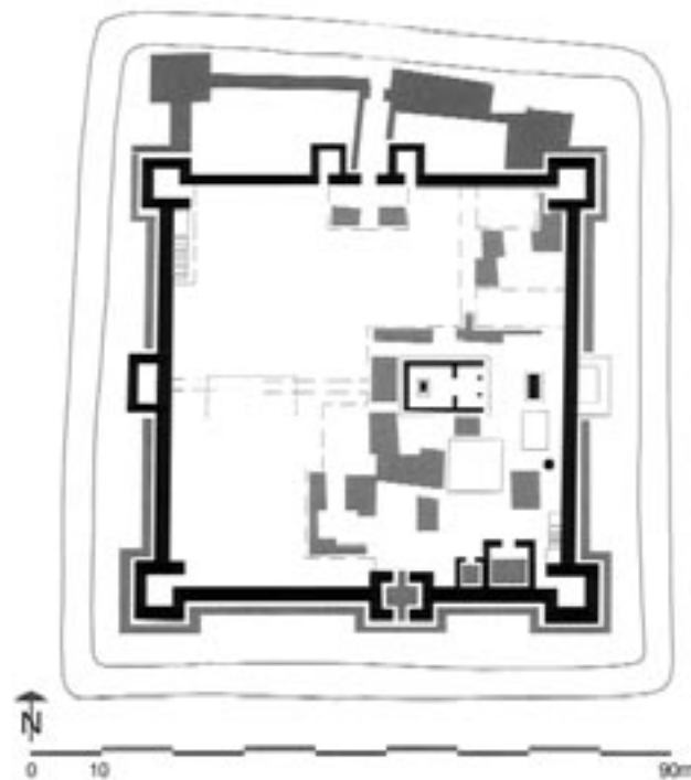
Κάτοψη της Ελληνιστικής ακρόπολης (3ος π.Χ.)

Λόγω και της ύπαρξης άφθονου γλυκού ύδατος, το νησί ήταν σχεδόν πάντοτε κατοικημένο. Το 1937 βρέθηκε η στήλη του Σωτέλη «Σωτέλης Αθηναίος και οι στρατιώτες του ανέθεσαν Δί σωτήρι, Ποσειδώνι και Αρτέμιδι σωτήρα». Για πρώτη φορά γίνεται αναφορά ότι κάποτε στο παρελθόν Έλληνες στρατιώτες βρέθηκαν στο νησί και αφιέρωσαν