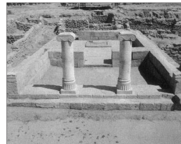
Ο Ιωνικός ναός της Αρτέμιδος του 3ου αιώνα π.Χ.

τον Ινδό ποταμό. Ο Νέαρχος, τότε ναύαρχος του στόλου, έλαβε την εντολή για να επιστρέψει στη Βαβυλωνία, να πλεύσει κατά μήκος των ακτών του Κόλπου, τις οποίες ο ίδιος αναφέρει ως φυσική ακτή. Ο Αρριανός αναφέρει ότι ο Αλέξανδρος πληροφορήθηκε την ύπαρξη δύο νησιών κοντά στην εκβολή του Ευφράτη. Το πρώτο, μικρότερο, ήταν κατοικημένο, καλυμμένο από πυκνό δάσος και οι κάτοικοι του είχαν αναλάβει τη λατρεία του ιερού. Αυτό το νησί, στο οποίο πρώτος έφτασε ο Ανδροσθένης από τη Θάσο και έστειλε την αναφορά του, έδωσε την εντολή ο Αλέξανδρος να ονομασθεί Ίκα-