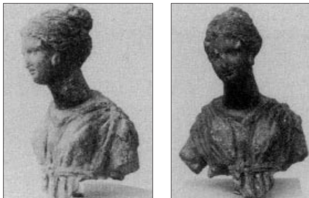
Ελληνιστικά γυναικεία ειδώλια

ρος. Οι Έλληνες άποικοι έφτασαν στη νήσο Ίκαρο στα τέλη του 4ου π.Χ. αιώνα, μετά το θάνατο του Αλέξανδρου κατά τη βασιλεία του Σέλευκου του Α' και έκτισαν ένα οχυρωμένο κτήριο, που ονομάστηκε «ακρόπολις» παρά τις ταπεινές διαστάσεις του. Η ακρόπολη ήταν τετράγωνη, 60 μέτρα μήκος, είχε δύο εισόδους (προς Β και προς Ν), πύργους στις γωνίες και περιβαλόταν από στεγνή τάφρο. Μέσα στην Ακρόπολη βρέθηκαν και κατοικίες, αλλά το κέντρο καταλαμβάνει ο ναός ελληνικού τύπου με ιωνικά κιονόκρανα, αφιερωμένος στη θεά Άρτεμη.