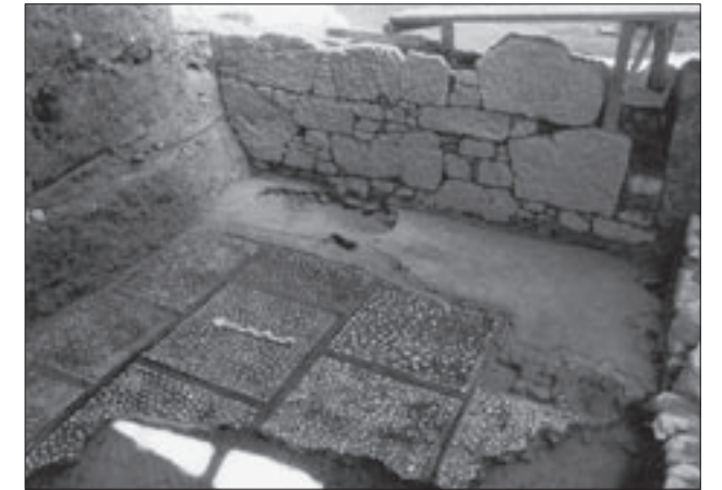
Εικ. 6. Ψηφιδωτό δάπεδο ανδρώνος της οικίας Θ' στο νοτιοδυτικό άκρο της ανασκαφής

(εικ. 4). Στα ανατολικά, μια πολυτελής αστική κατοικία με ιδιωτικό λουτρό (Κτήριο Ζ'), σχεδιάστηκε σύμφωνα με τα αρχιτεκτονικά πρότυπα της εποχής (εικ. 4). Την ίδια εποχή ένα μικρό δημόσιο λουτρό («Ανατολικό λουτρό»), στη συμβολή των οδών ΜΕΤΡΟ-I και ΝΜΑ-I, εξυπηρετούσε τις ανάγκες των υπόλοιπων κατοίκων της περιοχής (εικ. 4). Τα κτήρια με την παραπάνω μορφή λειτούργησαν μέχρι το τέλος του 5ου αι. οπότε καταστράφηκαν, ίσως κατά την επιδρομή των Βανδάλων, το 467 μ.Χ.