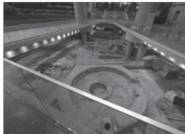
Εικ. 10. Η κυκλική αίθουσα και το τρίκογχο του κτηρίου Ε' κάτω από το στέγαστρο της εισόδου του Μουσείου