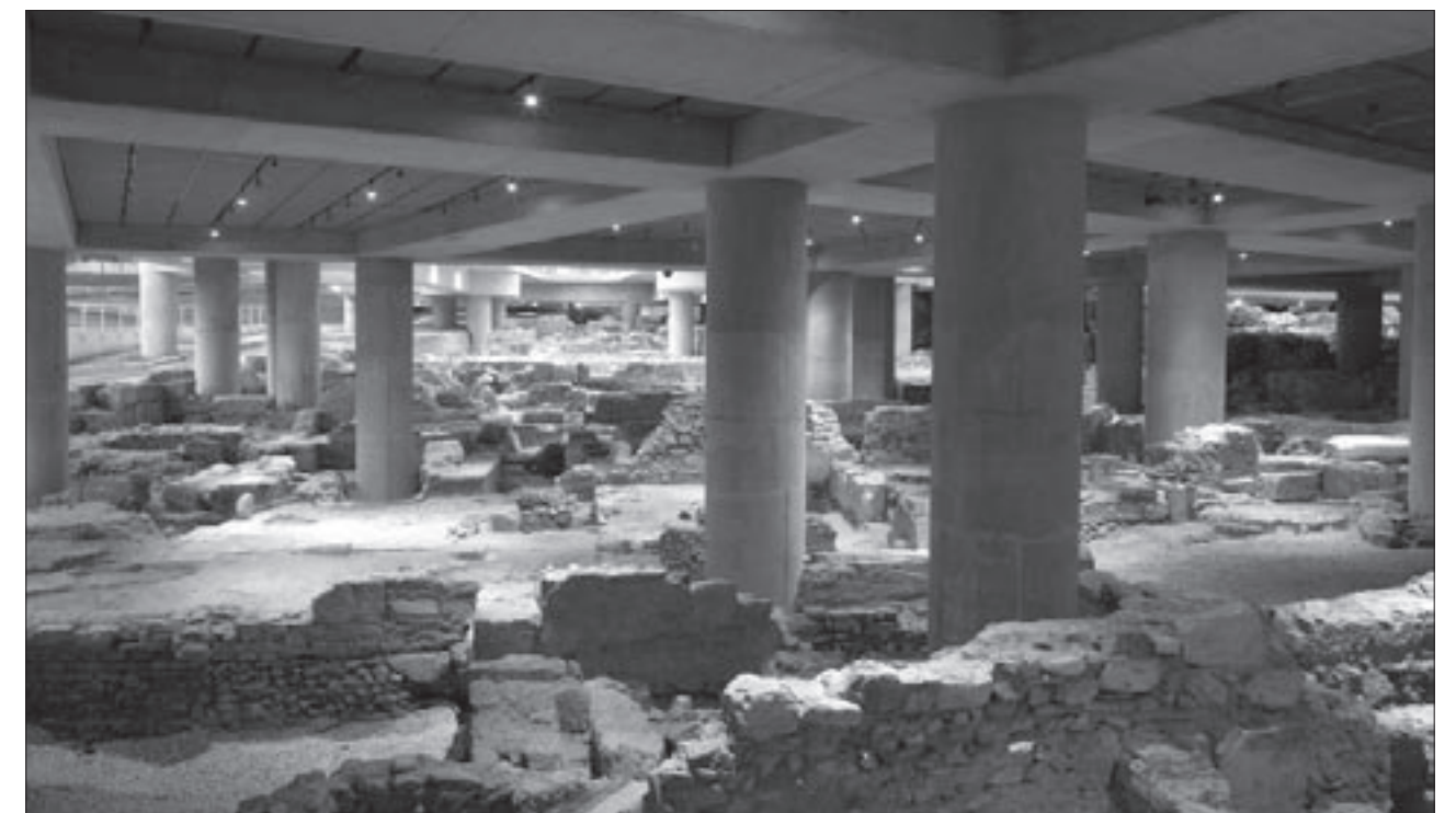
Εικ. 2. Τα διαχρονικά κατάλοιπα της συνοικίας της αρχαίας Αθήνας κάτω από το Μουσείο

Τα σπίτια των κλασικών και ελληνοιστικών χρόνων (5ος-1ος αι. π.Χ.) διατηρήθηκαν αποσπασματικά, διαταραγμένα ή «σφραγισμένα» από τα μεταγενέστερα οικοδομήματα. Η σχεδιαστική τους αποκατάσταση δείχνει ότι είχαν τη μορφή της τυπικής ελληνικής