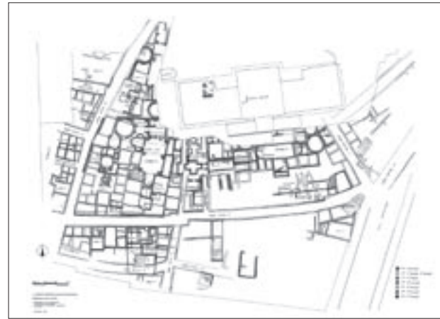
Εικ. 4. Γενική κάτοψη της ανασκαμμένης περιοχής του Μουσείου της Ακρόπολης με σημειωμένη τη διαχρονική της διαστρωμάτωση

κατοικίας με τα δωμάτια οργανωμένα γύρω από μία εσωτερική αυλή, χωρίς περιστύλιο και με τους χώρους διαμονής στη βόρεια, συνήθως, πτέρυγα. Οι τοίχοι ήταν χτισμένοι με ωμά πλιθιά πάνω σε λιθοκτιστες βάσεις και τα δάπεδα ήταν στρωμένα με πατημένο χώμα ή πηλό. Εξαιρέση αποτελούσαν τα δάπεδα των ανδρώνων, που ήταν ψηφιδωτά («Οικίες Θ', Σ' και Ο'») και των αυλών, που ήταν στρωμένα με βότσαλα ή κεραμικές ψηφίδες.