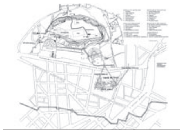
Εικ. 3. Η σχέση της ανασκαμμένης συνοικίας της αρχαίας Αθήνας με τα μνημεία της νότιας κλιτύς και τον βράχο της Ακρόπολης