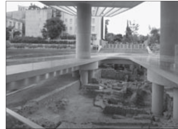
Εικ. 5. Κατάλοιπα αρχαίων δρόμων κάτω από το στέγαστρο της εισόδου του Μουσείου