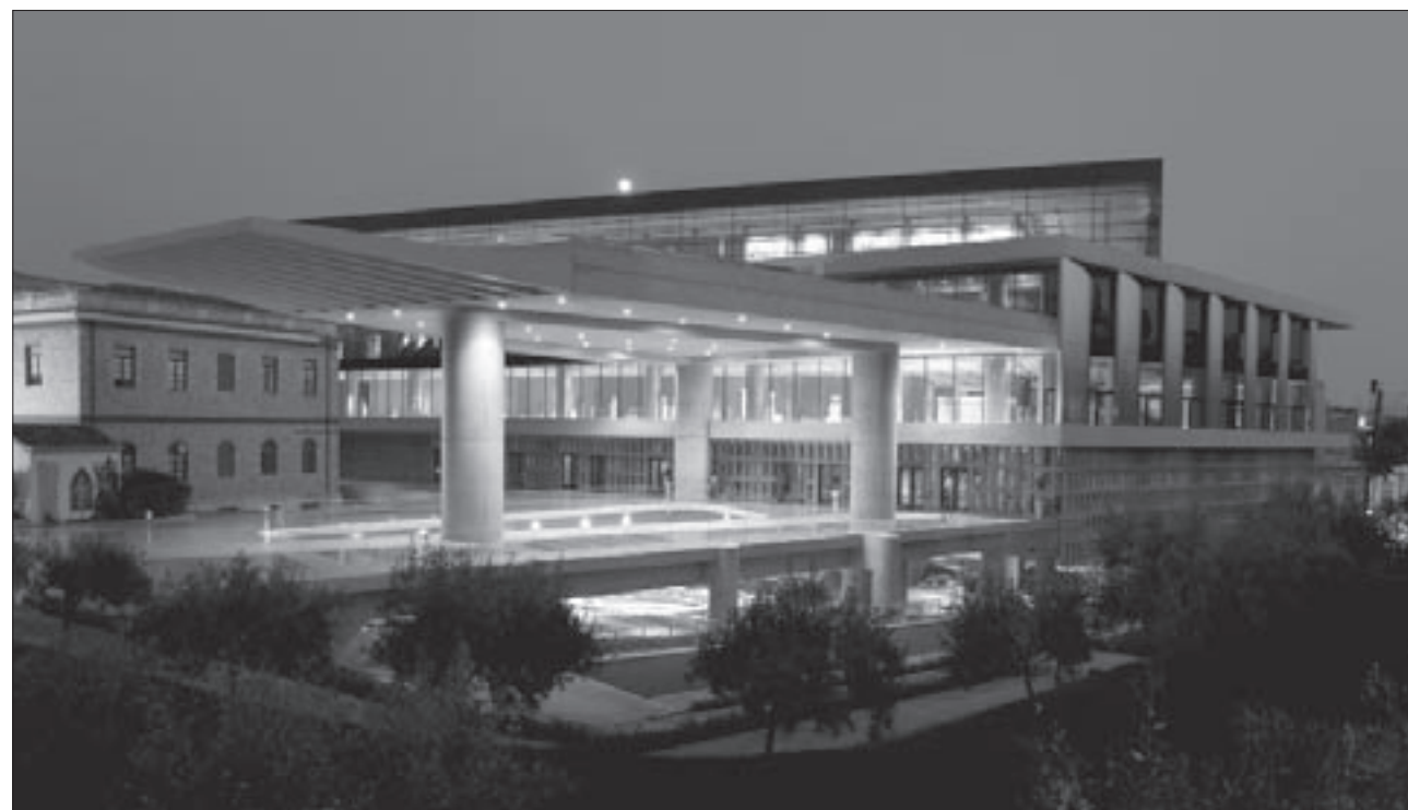
Εικ. 1. Γενική άποψη του Μουσείου της Ακρόπολης από βορειοδυτικά με ενσωματωμένες τις επιτόπου αρχαιότητες

Η αρχαϊκή εποχή αντιπροσωπεύεται ελάχιστα, καθώς η περιοχή βρισκόταν έξω από τα τείχη που κατέστρεψαν οι Πέρσες το 480 π.Χ. Στο τειχιωμένο τμή-