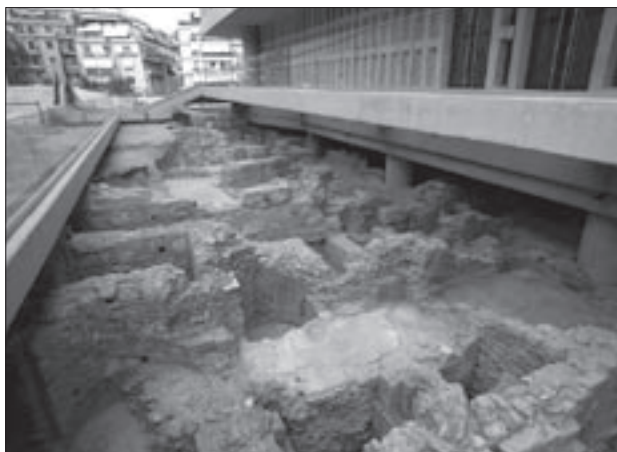
Εικ. 9. Κατάλοιπα του κτηρίου Ζ' έξω από τη βόρεια πλευρά του Μουσείου