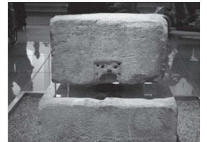
Εικ. 3. Ο μαρμάρινος θησαυρός του ιερού της Ουρανίας Αφροδίτης

Η πρώτη (προθήκη 4) περιλαμβάνει τις παλαιότερες λουτροφόρους, του 7ου και κυρίως του 6ου αι. π.Χ.,