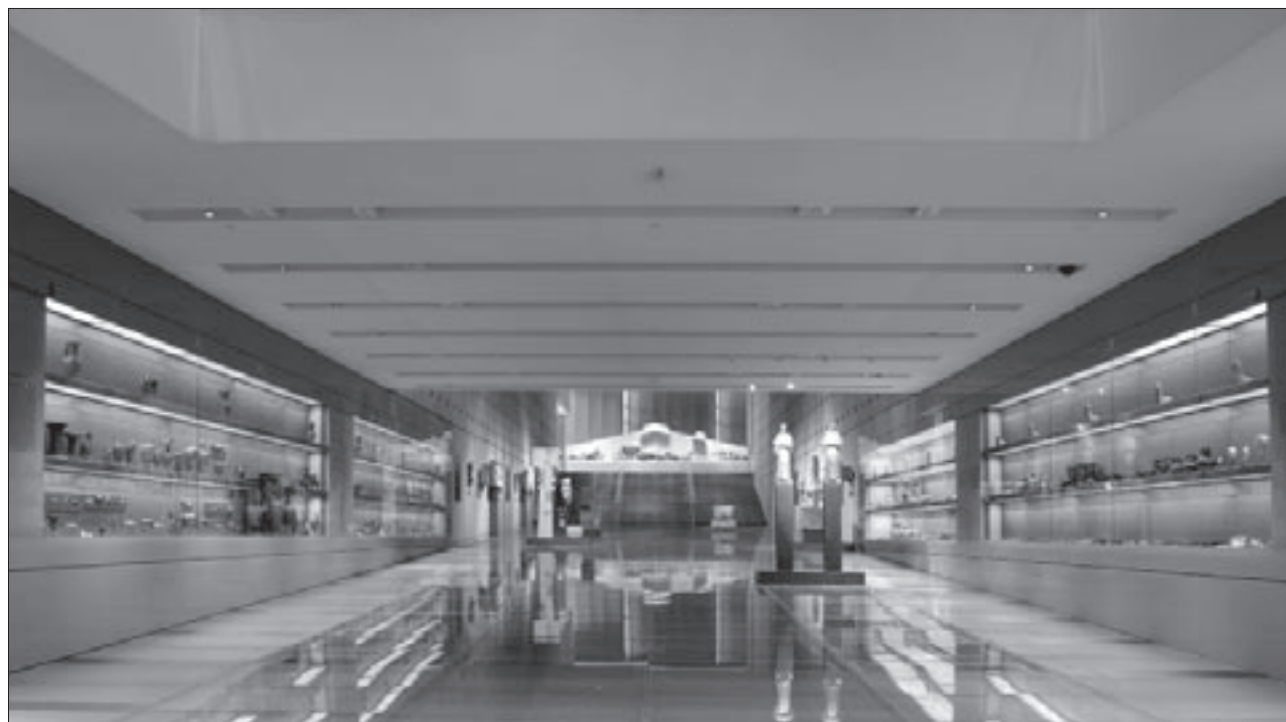
Εικ. 1. Γενική άποψη της Αίθουσας των Κλιτύων της Ακρόπολης

(εικ. 1). Θεωρούνται ακρωτήρια, διακοσμητικά δηλαδή στοιχεία της στέγης κτηρίου, πιθανώς δημόσιου. Βρέθηκαν στη νότια πλαγιά της Ακρόπολης, μέσα σε πηγάδι των ρωμαϊκών χρόνων, κατά την ανασκαφή που διενεργήθηκε τη δεκαετία του 1950 στο πλάτωμα μπροστά από το θέατρο του Ηρώδου Αττικού, για τη διάνοιξη της λεωφόρου Διονυσίου Αρεοπαγίτου. Από την ίδια ανασκαφή προέρχονται και τα περισσότερα από τα υπόλοιπα εκθέματα των προθηκών. Η εικόνα της αρχαίας Αθήνας που παρέδωσε η ανασκαφή αυτή δεν διαφέρει από την εικόνα που έδωσε η ανασκαφή για το νέο Μουσείο. Αντίθετα, επιβεβαιώνει την κοινή ιστορική διαδρομή των νότιων υπωρειών της Ακρόπολης. Και εδώ αποκαλύφθηκαν τάφοι και σπίτια, δρόμοι και πλατείες, πηγάδια και δεξαμενές και χιλιάδες κινητά ευρήματα. Ένα μέρος των τελευταίων παρουσιάζεται στο Μουσείο σε χρονολογικές και θεματικές ενότητες. Η έκθεση ξεκινά με πήλινα αγγεία από τον οικισμό που αναπτύχθηκε στις πλαγιές του λόφου τη Νεολιθική Περίοδο και την Εποχή του Χαλκού (προθήκη 1). Είναι αγγεία αποθήκευσης προϊόντων, σκεύη προετοιμασίας φαγητού, αγγεία νερού και επιτραπέζια