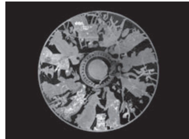
Εικ. 2. Πώμα πήλινης κοσμηματοθήκης με παράσταση Διονυσιακού θιάσου από τον οικισμό στα νότια της Ακρόπολης

σκεύη που βρέθηκαν σε πηγάδια, λάκκους απόρριψης και επιχώσεις. Κατά την Πρωτογεωμετρική και Γεωμετρική Εποχή ένα μεγάλο μέρος της περιοχής χρησιμοποιήθηκε ως νεκροταφείο με τάφους διαφόρων τύπων: ενταφιασμούς σε λάκκους, κάποτε επενδυμένους με λίθινες πλάκες, παιδικές ταφές σε πήλινα σκεύη (εγχυτρισμοί) και καύσεις, με τη στάχτη των νεκρών συγκεντρωμένη σε τεφροδόχα αγγεία. Τα αντικείμενα που συντρόφευαν τους νεκρούς, τα κτερίσματα, αντανακλούν τα ταφικά έθιμα της εποχής, την κοινωνική θέση και την οικονομική επιφάνεια των κατόχων τους. Στην προθήκη 1 παρουσιάζονται τα ευρήματα δέκα ταφών, που χρονολογούνται από τις αρχές του 10ου έως το β' μισό του 8ου αι. π.Χ. Στις προθήκες 2 και 3, που ακολουθούν, παρουσιάζονται τα ευρήματα του οικισμού των ιστορικών χρόνων οργανωμένα σε θεματικές, πλέον, ενότητες. Πρόκειται για μια επιλογή που στοχεύει στην αφύπνιση του ενδιαφέροντος του επισκέπτη για τη ζωή στην αρχαιότητα μέσα από την κατανόηση της χρήσης των αντικειμένων και τους συνακόλουθους συνειρμούς, συσχετισμούς, παραλληλισμούς και μνήμες που πολλά από αυτά ξυπνούν. Είναι αντικείμενα που συνδέονται με την οικονομική, εμπορική και εργαστηριακή δραστηριότητα των αρχαίων κατοίκων, με την καθημερινή ζωή των ανδρών, των γυναικών και των παιδιών, με την οικιακή λατρεία και τα τοπικά έθιμα (εικ. 2). Η ενότητα του οικισμού κλείνει με ευρήματα από την