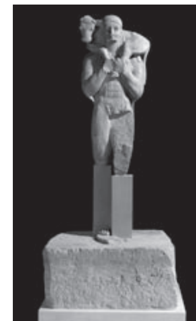
Εικ. 4. Ο «Μοσχοφόρος»