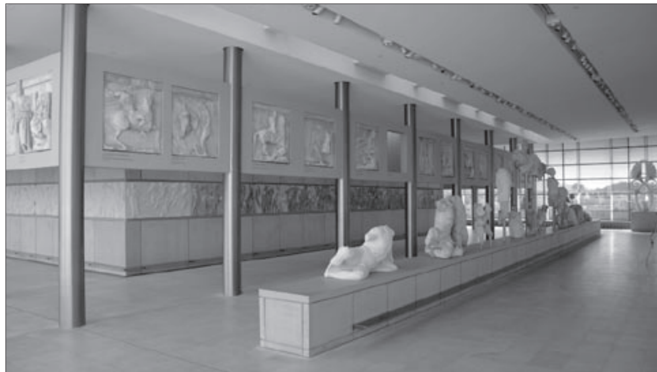
Εικ. 14. Τα αρχιτεκτονικά γλυπτά (εναέτια, μετόπες, ζωφόρος) της δυτικής πλευράς του Παρθενώνα

τηρήσει και τις πίσω πλευρές, των γλυπτών, που ήταν δουλεμένες αλλά αθέατες στο μνημείο και φέρουν τεχνικές λεπτομέρειες για τη συναρμογή στο αρχαίο τύμπανο. Στο ανατολικό αέτωμα υπάρχει μεγάλο κενό στη θέση των κεντρικών μορφών, που αφαιρέθηκαν εξ αιτίας της κατασκευής της χριστιανικής αψίδας. Στα βάθρα τοποθετήθηκαν εκμαγεία της επάνω πλευράς των κεντρικών οριζοντίων γείσων με τις υποδοχές αρχαίων μεταλλικών προβόλων, που συγκρατούσαν τις κολοσσικές μορφές στο τύμπανο. Η «Πεπλοφόρος Wegner» και ο κορμός του «Ηφαιστού», που αποδόθηκαν στο αέτωμα, στερεώθηκαν με μεταλλικά στηρίγματα στα γείσα. Από τις άλλες μορφές, που καθαίρεσαν τα συνεργεία του Elgin και μετέφεραν στο Λονδίνο, τοποθετήθηκαν εκμαγεία που στερεώθηκαν με συνδέσμους. Στα άκρα του αετώματος με τα τέθριππα του Ηλίου και της Σελήνης, αυθεντικά είναι τα εσωτερικά ζεύγη των αλόγων, που εκτίθενται για πρώτη φορά μετά την αφαίρεσή τους από το μνημείο (1986), τη συντήρηση και τον καθαρισμό τους με λέιζερ (εικ. 13). Ορισμένα θραύσματα του ανατολικού αετώματος από τις ανασκαφές της Ακρόπολης και τη νότια κλιτύ της, όπως το χέρι του Δία με τον κεραυνό,