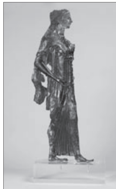
Εικ. 6. Αθηνά σε επίχρυσο χάλκινο έλασμα