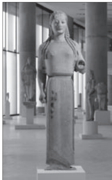
Εικ. 5. Η «Πεπλοφόρος»

ανάθημα του στρατηγού που έπεσε στη μάχη του Μαραθώνα. Το άγαλμα αυτό πρόκειται να στηθεί επάνω στον κατεστραμένο από τους Πέρσες ενεπίγραφο κίονα, σύμφωνα με το σχέδιο του Μ. Κορρέ, μετά από συστηματική εργασία που διεξάγεται στο εργαστήριο. Ιδιαίτερης ιστορικής σημασίας είναι τα έργα με τα σημάδια της περσικής καταστροφής, ο κούρος και δύο κόρες, καθώς και θραύσματα καμμένων γλυπτών μέσα σε προθήκη μαζί με μέρος «θησαυρού» αργυρών τετραδράχμων των ετών 483-480 π.Χ. Απέναντι, και σε αντιδιαστολή με αυτά τα έργα, στέκονται οι δημιουργίες του «Αυστηρού Ρυθμού», της τεχνοτροπίας που εμφανίζεται μετά το 480/79 π.Χ., έτος εισβολής των Περσών και εκφράζει τη νέα αντίληψη της πρόιμης κλασικής τέχνης. Τα έργα αυτά πιστεύεται ότι βρέθηκαν εκτός της επίχωσης των κατεστραμμένων αρχαϊκών έργων, που διαμορφώθηκε μετά τα Περσικά χάριν ενίσχυσης του βόρειου τείχους της Ακρόπολης, αλλά και στην επίχωση του νότιου τείχους, που έγινε αργότερα. Το κεντρικό έκθεμα είναι ο «Κριτίου πιας» (εικ. 11), του οποίου η εσωτερική κίνηση γίνεται πλέον ολοφάνερη με την ανάδειξη της ανατομικής του διάπλασης μέσω του φωτισμού. Δίπλα του εκτίθενται το κεφάλι του «ξανθού εφήβου» (εικ. 10) και η «Κόρη του Ευθυδίκου», που ανασυντέθηκε με τη βοήθεια με-