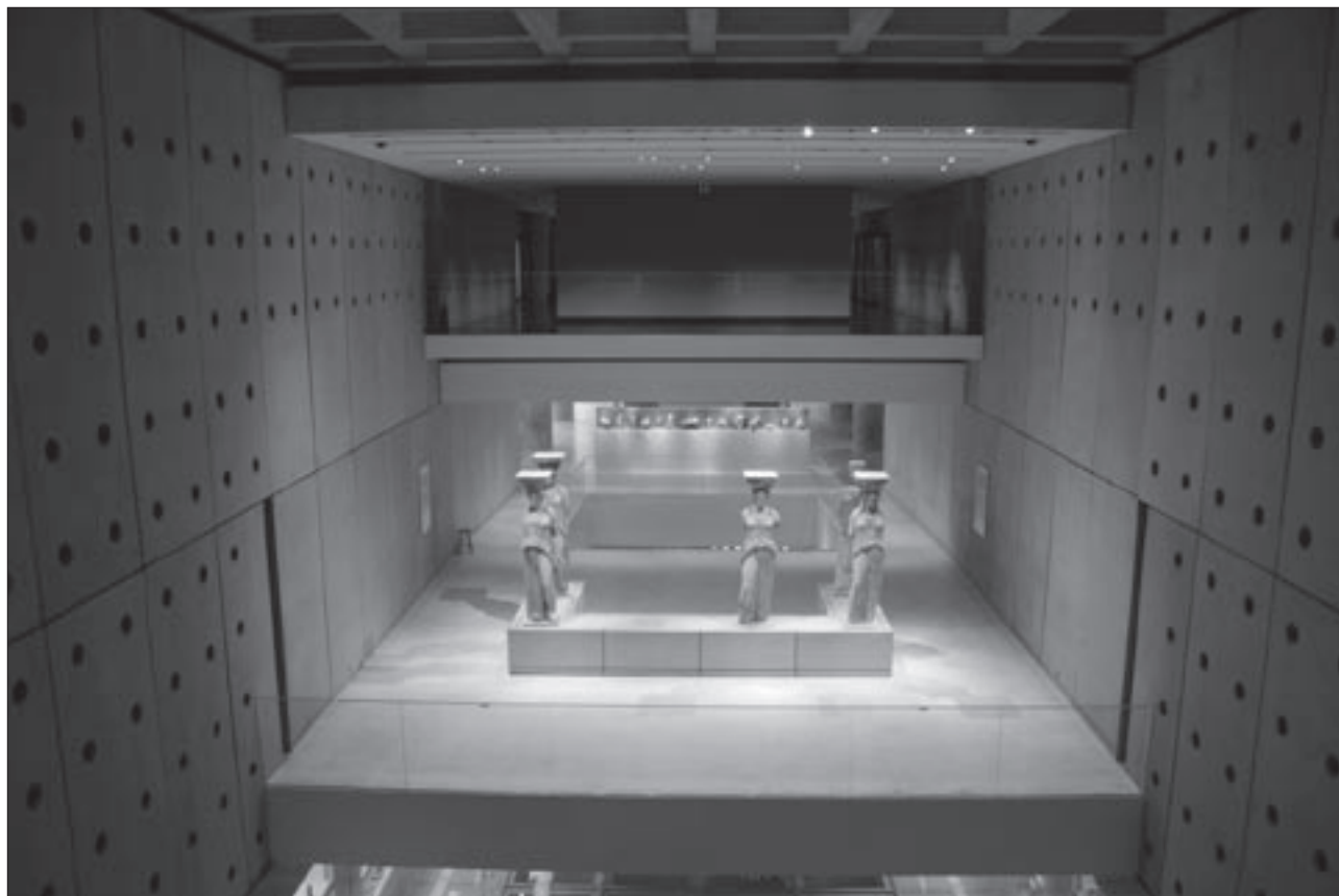
Εικ. 21. Οι Καρνάτιδες στο Μουσείο της Ακρόπολης

αρχική θέση τους στο μνημείο (στοιχείο που αναφέρεται στον υπομνηματισμό), εκτός από τις γωνιακές πλάκες, που τοποθετήθηκαν σύμφωνα με τον αρχικό τους προσανατολισμό. Πέντε κορμοί Νικών, που δεν διατηρούν το φόντο τους, καθώς και το τρόπαιο περσικού οπλισμού εκτίθενται σε ανοικτές εντοίχιες προθήκες. Σε εντοίχια κλειστή προθήκη παρουσιάζονται θραύσματα του θωρακίου και των εναετίων γλυπτών του ναού, όπως ο γυμνός πολεμιστής από σκηνή Γιγαντομαχίας, σύμφωνα με την ερμηνεία του Γ. Δεσπίνη. Η έκθεση των γλυπτών συνοδεύεται από το πρόπλασμα του ναού, που έχει δωρήσει ο E. Berger (Skulpturhalle, Basel).