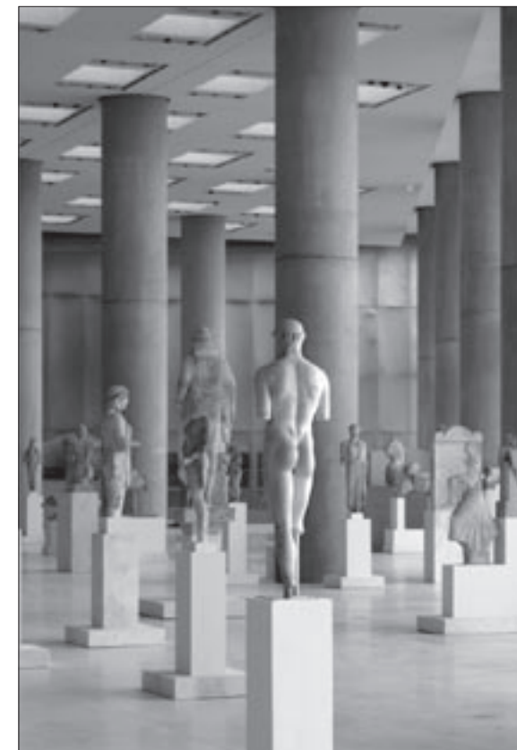
Εικ. 11. Γενική άποψη της αίθουσας των αρχαϊκών γλυπτών του Μουσείου της Ακρόπολης. Σε πρώτο επίπεδο διακρίνεται η πίσω όψη του «παιδός του Κριτίου»

Η ζωφόρος του Παρθενώνα, κατά γενική παραδοχή, εικονίζει την πομπή των Μεγάλων Παναθηναίων με καταληκτήριο και κορυφαίο γεγονός την προσφορά ενός καινούργιου πέπλου στο ξόανο της Αθηνάς Πολιάδος. Αρχικά απαρτιζόταν από 115 ανάγλυφους λίθους συνολικού μήκους 160 μ. και πάχους 60 εκ. Με την τοποθέτηση των λίθων σε εσοχές, στον πυρήνα