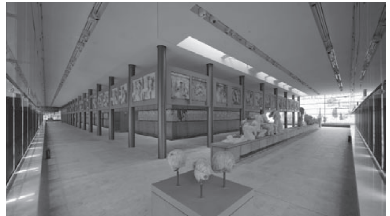
Εικ. 13. Γενική άποψη της αίθουσας του Παρθενώνα με τα γλυπτά (εναέτια, μετώπες, ζωφόρος) της ανατολικής και νότιας πλευράς του ναού

κε από θραύσματα και ένα εκμαγείο (που παραχωρήθηκε από το Βρετανικό Μουσείο με πρωτοβουλία του I. Jenkins) και στήθηκε με τη βοήθεια μεταλλικού συστήματος. Αυθεντικά θραύσματα εντάχθηκαν στους λίθους I και V, όπως το κεφάλι της Ίριδας. Αυθεντικό είναι επίσης το αριστερό τμήμα του λίθου VI με τους θεούς Ποσειδώνα, Απόλλωνα και Άρτεμη (εικ. 15), που συμπληρώθηκε με συνδυασμό σπαραγμάτων και εκμαγείων, με βάση το αρχικό εκμαγείο του Fauvel (1797). Ανάμεσα σε αυτά, καίριας σημασίας είναι το θραύσμα με τα χέρια των δύο θεαινών, που αναγνώρισε ο Γ. Δεσπίνης στην αποθήκη του Εθνικού Μουσείου (1972). Στο δεξιό άκρο της ανατολικής ζωφόρου καταλήγει το βόρειο σκέλος της πομπής αποτελούμενο από δύο ομάδες γυναικών. Εδώ τοποθετήθηκε νέο εκμαγείο του λίθου VII με τις Εργαστίνες, που βρίσκεται στο Λούβρο, το οποίο συμπληρώθηκε με ένα αυθεντικό θραύσμα. Το εκμαγείο του λίθου VIII, που βρίσκεται στο Βρετανικό Μουσείο, συμπληρώθηκε με 4 αυθεντικά θραύσματα των κεφαλιών των κορών. Οι συνθέσεις και τα μεμονωμένα θραύσματα στη ζωφόρο του Παρθενώνα στερεώθηκαν στην ακριβή τους θέση σε εσοχές του πυρήνα του κτηρίου, με τη βοήθεια κα-