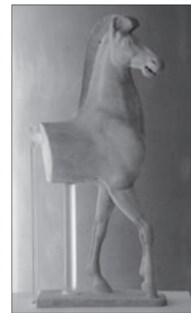
Εικ. 3. Άλογο χωρίς αναβάτη