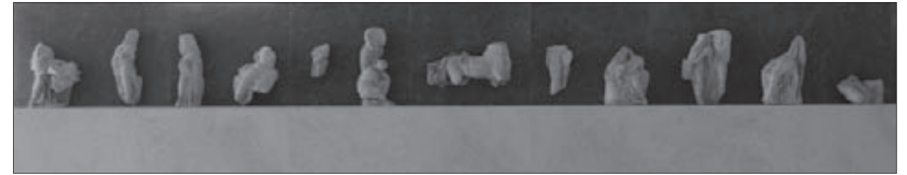
Εικ. 18. Τμήμα της ζωφόρου του Ερεχθείου στο Μουσείο της Ακρόπολης

σεις που είχαν αρχικά στο μνημείο (αλλά σε μικρότερο ύψος), εκτίθενται οι πέντε από τις έξι Καρνάτιδες που υποβάσταζαν, αντί κιόνων, τη στέγη της νότιας πρόστασης του Ερεχθείου (εικ. 21). Οι τέσσερις από τις κόρες είναι σχετικά ακέραιες, ενώ η πιο αποσπασματική κόρη F έχει ανασυσταθεί από τα αυθεντικά της θραύσματα. Ο τρόπος παρουσίασης των Καρνάτιδων επιτρέπει για πρώτη φορά στον επισκέπτη να παρατηρήσει την πίσω όψη των αγαλμάτων, που πριν δεν ήταν προσιτή (τόσο στην αρχική τους θέση στο