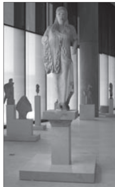
Εικ. 7. Η «Κόρη του Αντήνορα»