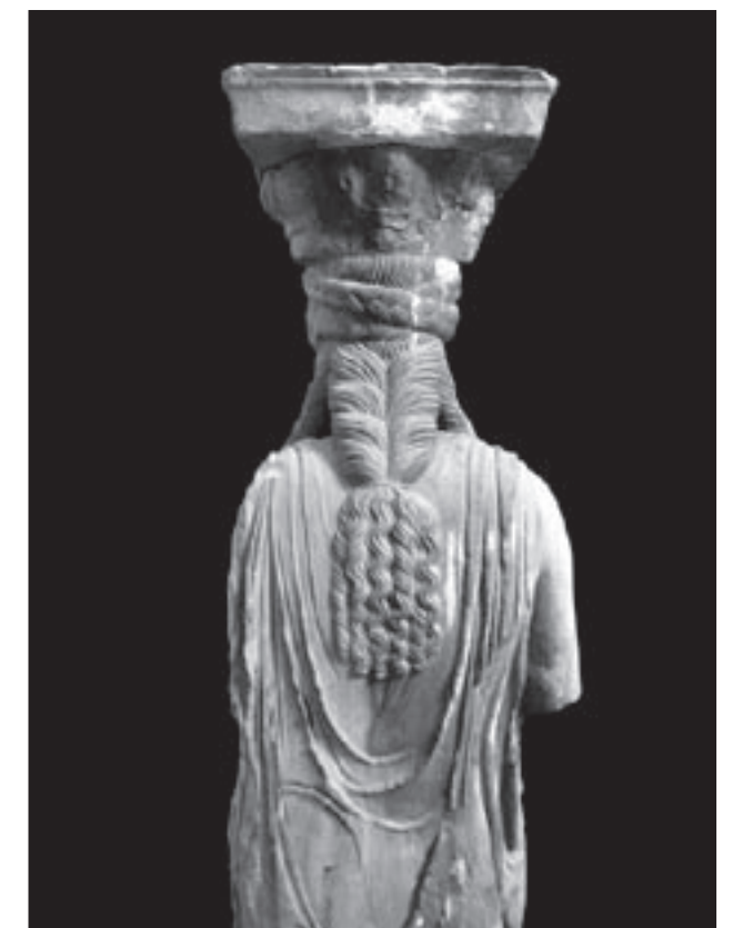
Εικ. 20. Πίσω όψη Καρνάτιδας. Διακρίνεται η περίτεχνη κόμμωση