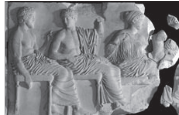
Εικ. 15. Ο λίθος VI της ανατολικής ζωφόρου του Παρθενώνα με τους Ποσειδώνα, Απόλλωνα, Άρτεμη και Αφροδίτη