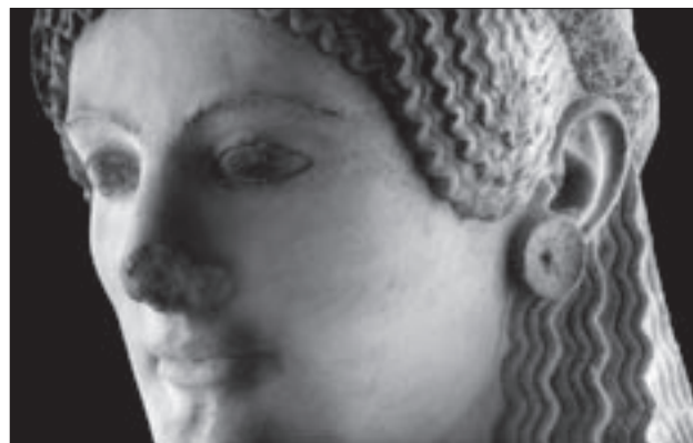
Εικ. 9. Λεπτομέρεια του κεφαλιού της Κόρης αρ. 684

Οι μετόπες τοποθετήθηκαν, ανα ζεύγη, σε ύψος 3.50 μ. από το δάπεδο, ανάμεσα σε λεπτούς μεταλλικούς κίονες, που παραπέμπουν ως προς τον αριθμό και τις αποστάσεις τους στο πτερό του Παρθενώνα. Είναι στερεωμένες μέσα σε ορθογώνια πλαίσια με μεταλλικό σκελετό με τη βοήθεια ανοξειδωτων μεταλλικών στηριγμάτων, που διασφαλίζουν τη στατική τους επάρκεια. Ως γνωστόν, οι μετόπες παριστάνουν σκηνές μυθικών μαχών, συμβολικές των νικηφόρων αγώνων των Αθηναίων και οι μορφές των τριών πλευρών