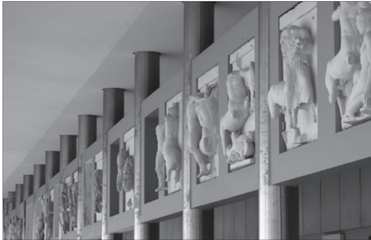
Εικ. 12. Οι νότιες μετώπες στην αίθουσα του Παρθενώνα του Μουσείου της Ακρόπολης

θραύσματος (λίθος III, από θραύσμα στη Γλυπτοθήκη του Μονάχου). Ο επισκέπτης σήμερα μπορεί να θαυμάσει αυτοτελείς συνθέσεις με στιγμιότυπα των ιππέων, όπως εκείνο του ιπποδαμαστή (λίθος VIII), που έχει αποδοθεί στον ίδιο τον Φειδία. Η βόρεια ζωφόρος στο δυτικό της μέρος με τις επάλληλες φάλαγγες ιππέων σε καλπασμό αντιπροσωπεύεται κυρίως με εκμαγεία των πλακών που βρίσκονται στο Βρετανικό Μουσείο. Στο μέσον, όπου αναπτύσσεται η πο-