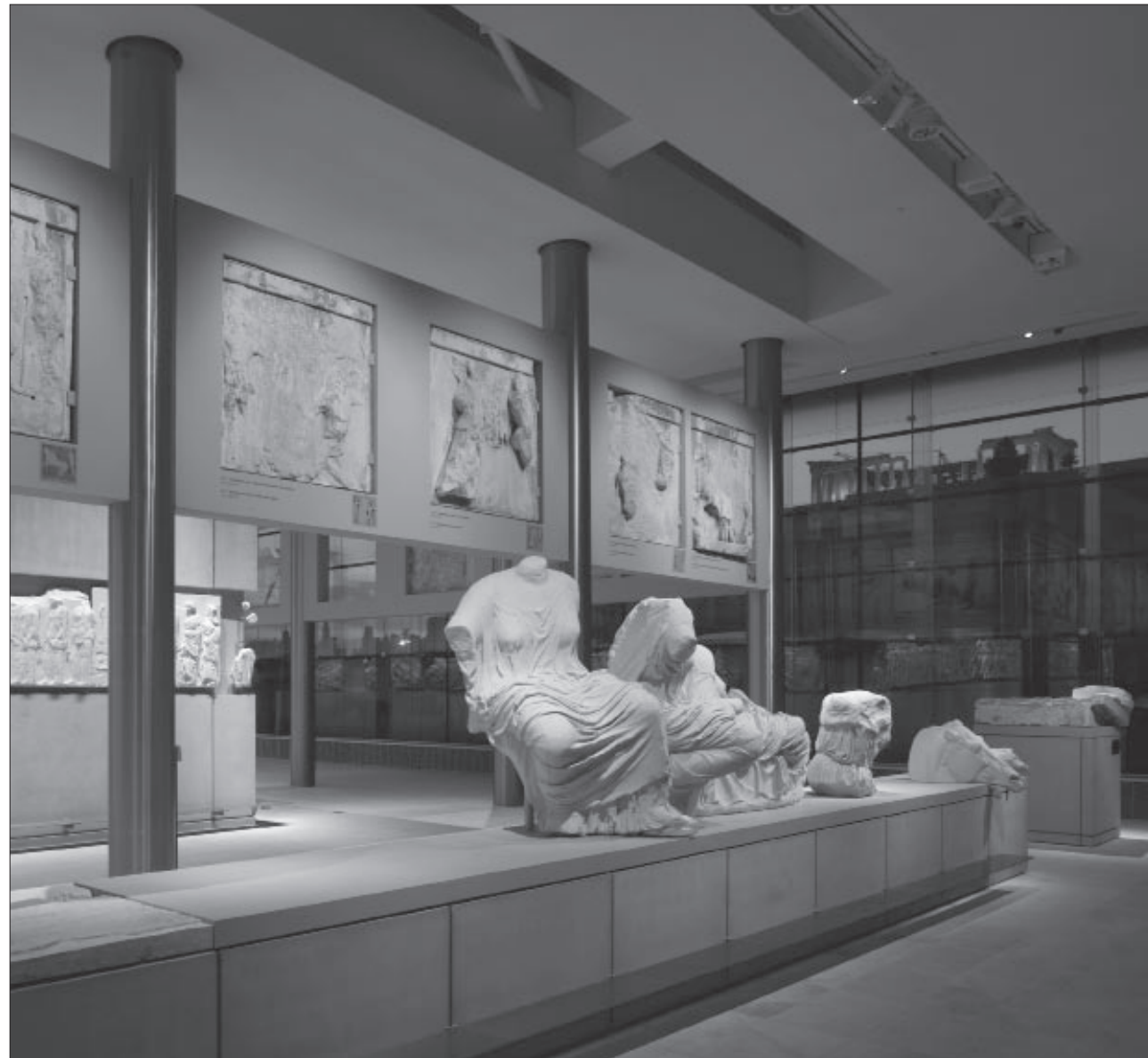
Εικ. 17. Τα γλυπτά του Παρθενώνα στο Μουσείο της Ακρόπολης, αντίκρυ στον βράχο και το ίδιο το μνημείο

Σε πρόβολο ορατό από την ισόγεια αίθουσα, επάνω σε χαμηλό βάθρο σχήματος Π και στις αποστά-