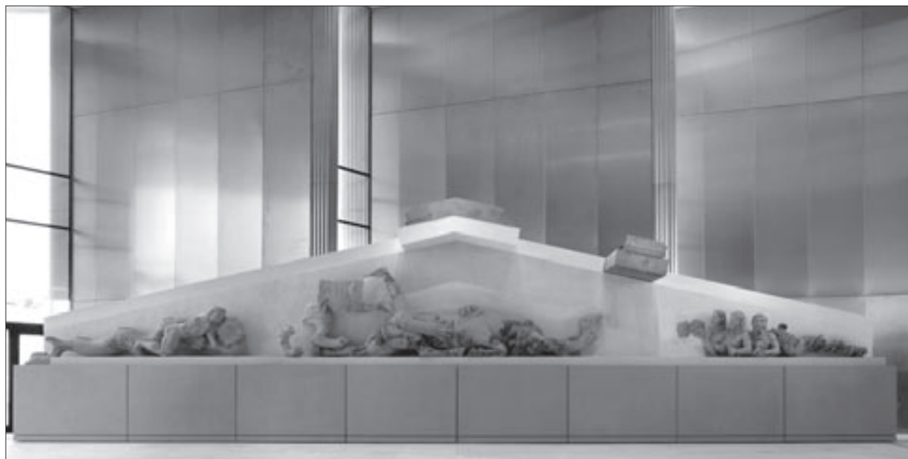
Εικ. 1. Το αέτωμα του αρχαϊκού Παρθενώνα, των αρχών του 6ου αι. π.Χ.

τωματικές συνθέσεις, που σήμερα ελκύουν την προσοχή του επισκέπτη με τη βοήθεια του διάχυτου φωτός και του λιτού τρόπου έκθεσης, σε ορθογώνια βάθρα με μεταλλικό σκελετό και επένδυση τοιμέντινων πλακών. Στην κορυφή της κλίμακας, που οδηγεί εδώ από την επικλινή πρόσβαση της ισόγειας Αίθουσας των Κλιτύων, επιβάλλεται στον θεατή η νέα σύνθεση του δυτικού αετώματος του αρχαϊκού προκατόχου του Παρθενώνα (παλαιότερα ταυτιζόταν με το «Εκατόμπεδον»), είναι πλάτους 20 περίπου μέτρων (εικ. 1). Απαρτίζεται από τρία συμπλέγματα, τον Ηρακλή σε πάλη με τον Τρίτωνά αριστερά, δύο λιοντάρια που κατασπαράζουν ταύρο στο κέντρο και τον «Τρισώματο Δαίμονα» δεξιά. Στη μορφή του Ηρακλή συγκολλήθηκε το κεφάλι και στην κεντρική σύνθεση το σώμα του αριστερού λιονταριού. Οι προσθήκες αυτές ενόησαν την τοποθέτηση τεχνητού τυμπάνου στο αέτωμα, την κορυφή του οποίου επιστέφουν τμήματα της μαρμάρινης σίμης που καταλήγει σε δύο μεγάλες έλικες στις γωνίες. Μεταξύ σίμης και αετώματος παρεμβάλλεται το πώρινο καταέτιο γείσο με γραπτό άνθος λωτού στην κάτω πλευρά του. Σε χωριστά βάθρα εκτέθηκαν οι αποσπασματικές συνθέσεις, που έχουν αποδοθεί στο ανατολικό αέτωμα και σε μετόπες του ναού, δηλαδή η λέαινα που κατασπαράζει μικρό ταύ-