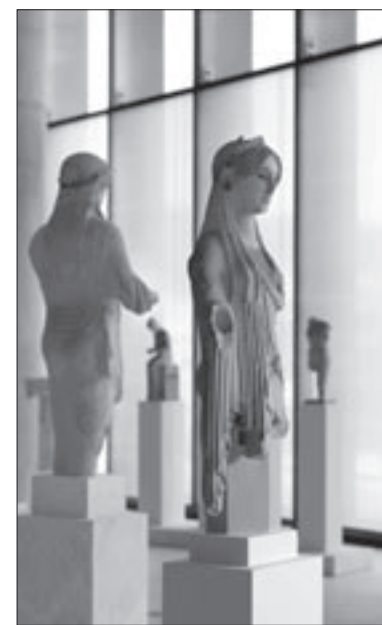
Εικ. 2. Κόρες στο Μουσείο της Ακρόπολης

ται με το πρώιμο αθηναϊκό εργαστήριο γύρω στο 570 π.Χ. Κεντρικό έκθεμα είναι ο «Μοσχοφόρος» (εικ. 4), που παριστάνει τον αναθέτη σε αρμονική σχέση με το ζώο που προσφέρει για θυσία. Ακολουθεί η ενότητα των Κορών, που εκτίθενται με κριτήρια χρονολογικά, θεματικά και τεχνοτροπικά. Κεντρικό έκθεμα είναι η «Πεπλοφόρος» (εικ. 5), που έχει πλέον ορατή και την πίσω όψη της. Δίπλα της βρίσκεται το κυνηγόσκυλο, έργο του ίδιου καλλιτέχνη που φιλοτέχνησε την κόρη. Το αριστούργημά του γλύπτη, ο ιππέας Rampin, στη συνέχεια, μας εισάγει στην ομάδα των ιππέων, αφιερωμάτων της αριστοκρατικής τάξης των Ιππέων. Το κέντρο της ομάδας καταλαμβάνει ο «Πέρσης» ιππέας, το άλογο του οποίου συμπληρώθηκε με νέα θραύσματα από την Ι. Τριάντη, που μελέτησε και την πολυχρωμία του σε συνεργασία με τον V. Brinkmann. Κατά μήκος του μεγάλου διαδρόμου υψώνεται το σημαντικότερο σύνολο μαρμάρινης αρχιτεκτονικής πλαστικής, το αέτωμα της Γιγαντομαχίας (εικ. 8), που κοσμούσε τον Αρχαίο Ναό της Αθηνάς. Τρία αγάλματα γιγάντων, ανάμεσα στους οποίους κυριαρχεί η θεά Αθηνά, τοποθετήθηκαν σε ενιαίο βάθρο, με αντιστοιχία στο αρχικό πλάτος του αετώματος, χωρίς τεχνητό τύμπανο, ώστε να διακρίνονται και οι πίσω πλευρές τους. Η μελέτη και τοποθέτηση οφείλεται στον