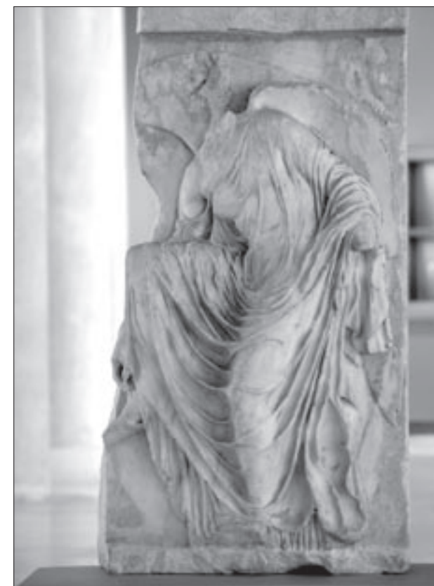
Εικ. 19. Η «σανδαλιζόμενη» Νίκη από το ανάγλυφο στηθαίο του πύργου της Αθηνάς Νίκης

Από τον γλυπτό διάκοσμο του ναού της Αθηνάς Νίκης, που οικοδομήθηκε βάσει σχεδίων του Καλλικράτη, σύμφωνα με την αμφίγραπτη επιγραφή που εκτίθεται, παρουσιάζονται επάνω σε υψηλά βάθρα οκτώ