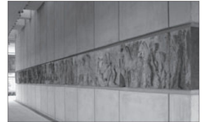
Εικ. 16. Η δυτική ζωφόρος του Παρθενώνα στο Μουσείο της Ακρόπολης

η λύρα του Απόλλωνα και τα κεφάλια του Ήλιου και της Σελήνης, εκτέθηκαν σε κοινό βάθρο σε στηρίγματα με ειδικά κατασκευασμένες χυτές υποδοχές.