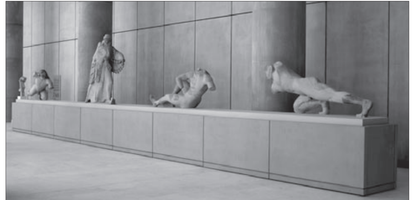
Εικ. 8. Το αέτωμα της Γιγαντομαχίας του Αρχαίου Ναού της Αθηνάς Πολιάδος

ταλλικού στηρίγματος που σχεδίασε ο συντηρητής Κ. Βασιλειάδης. Σε περίοπτες προθήκες εκτίθενται το χάλκινο κεφάλι γενειοφόρου οπλίτη, το επίχρυσο έλασμα Αθηνάς (εικ. 6) και η χάλκινη Αθηνά Πρόμαχος, αξιόλογα δείγματα χαλκοπλαστικής. Η ενότητα κλείνει με το αναθηματικό ανάγλυφο της «Σκεπτομένης Αθηνάς», η στάση ανάπαυσης της οποίας απηχεί εκείνη του αγάλματος της θεάς, έργου του Αγγέλτου, που πρόσφατα συνδέθηκε με τον ενεπίγραφο κίονα της. Η έκθεση των αρχαϊκών έργων πραγματοποιήθηκε από τους συντηρητές Δ. Μαραζιώτη και Κ. Βασιλειάδη με τους συνεργάτες τους.