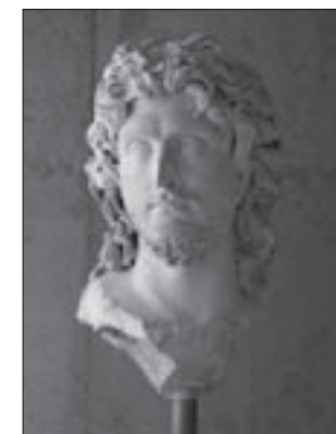
Εικ. 4. Προτομή βαρβάρου ηγεμόνα

λιτικών, στρατηγών και άλλων αξιωματούχων της πόλης), πνευματικών ανθρώπων (φιλοσόφων, ρητόρων, ιερέων) καθώς και απλών πολιτών, που διέπρεψαν σε αθλητικούς ή πνευματικούς αγώνες. Περίφημο είναι το νεανικό πορτρέτο του Μεγάλου Αλεξάνδρου (εικ. 3) με εξιδανικευμένα χαρακτηριστικά, πρωτότυπο έργο του γλύπτη Λεωχάρους. Στήθηκε στην Ακρόπολη λίγο μετά τη μάχη της Χαιρωνείας (336 π.Χ.). Πολύ καλής τέχνης είναι τα ρωμαϊκά πορτρέτα των αυτοκρατόρων Καρακάλλα και Λούκιου Βέρου, ενός βαρβάρου ηγεμόνα του Βοσπόρου, του λεγόμενου Χριστού (2ος αι. μ.Χ.) (εικ. 4) και ενός Νεοπλατω-