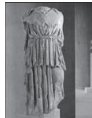
Εικ. 2. Μεταπαρθενώνειο άγαλμα Αθηνάς.

Από τα μέσα του 5ου αι. π.Χ. στήνονταν στην Ακρόπολη στήλες με ψηφίσματα της Βουλής και του Δήμου των Αθηναίων, τα οποία ήταν σχετικά με συνθήκες ή συμμαχίες της Αθήνας με άλλες πόλεις ή τιμητικά για πρόσωπα που είχαν προσφέρει υπηρεσίες ή ευεργεσίες στην πόλη. Στο πάνω μέρος της στήλης υπήρχε συνήθως ένα ανάγλυφο, όπου εικονίζονταν διάφορες παραστάσεις. Εφόσον επρόκειτο για συνθήκη ή συμ-