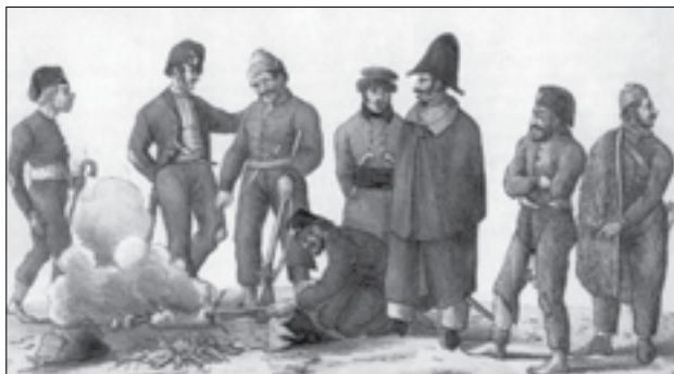
Γάλλοι αξιωματικοί μεταξύ των στρατιωτών του Δημητρίου Υψηλάντη. Επικρωματισμένη λιθογραφία του Fromant

Ένα σημαντικό, λοιπόν, τμήμα των Φιλελλήνων, που βρέθηκαν να υπηρετούν υπό τον Φαβιέρο, έφθασαν στην Ελλάδα έπειτα από οργανωμένη προετοιμασία, καθώς στρατολογήθηκαν από τα ελληνικά κομιτάτα, από συλλόγους και οργανώσεις, πολλές από τις οποίες ήταν στημένες στα πρότυπα του Καρμποναρισμού και του Τεκτονισμού, με πρόσημο το τρίπτυχο «Ελευθερία-Ισότης-Αδελφότης». Μία τέτοια περίπτωση, και μάλιστα δημοσιευμένη, αποτέλεσε η οργάνωση «Αδελφοί του Απόλλωνα» στην Κόρινθο.