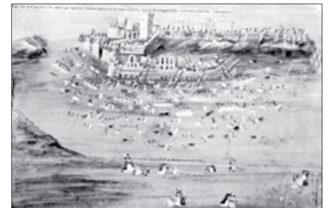
Η κατάληψη του Σερπεντζέ από τους Έλληνες στη διάρκεια της δεύτερης πολιορκίας της Ακρόπολης από τις δυνάμεις των επαναστατημένων. Υδατογραφία σε χαρτόνι των Π. Ζωγράφου και Ι. Μακρυγιάννη

(*) Περίληψη διαλέξεως του Ε. Σκιαδά στο Μουσείο Ακρόπολης στις 9 Δεκεμβρίου 2010.