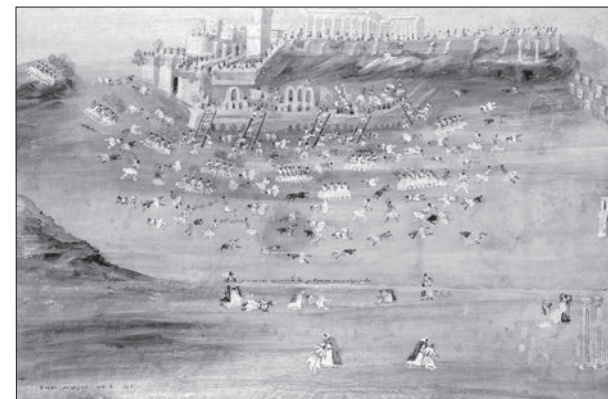
Η πρώτη πολιορκία του κάστρου της Ακρόπολης. Παναγιώτης Ζωγράφος – Σκέψης Μακρυγιάννη, Εθνικό Ιστορικό Μουσείο

Όπως και να έχουν όμως τα πράγματα είναι φανερό ότι εμφιλοχωρεί διάσταση απόψεων και πράξεων μεταξύ των επαναστατημένων Αθηναίων, η οποία, άλλωστε, δεν αποτελεί πρωτόγνωρο φαινόμενο... και θα μπορούσε πιθανόν να ορισθεί ως αντιπαλότητα