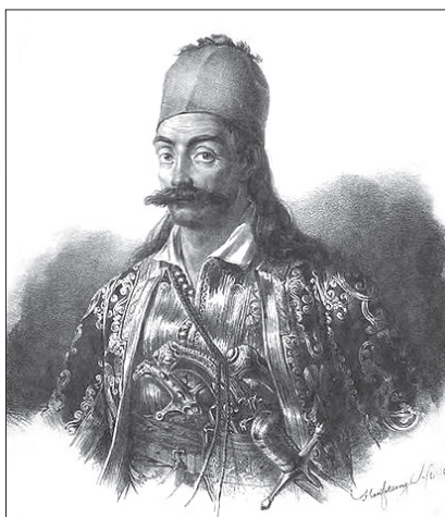
Ο Γεώργιος Καραϊσκάκης. Λιθογραφία, Λεύκωμα Karl Krazeisen, Εθνικό Ιστορικό Μουσείο

Ας προσθέσουμε ακόμα ότι η περίπου δεκάμηνη αυτή συγκλονιστική μάχη της Αθήνας και της Ακρόπολής της, των ετών 1826-1827, έχει αφήσει έντονα τα