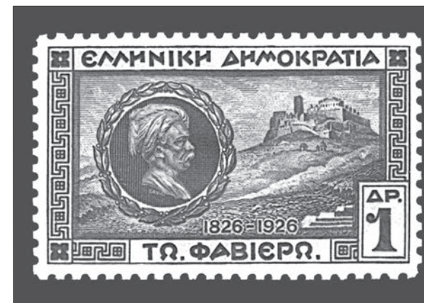
Γραμματόσημο προς τιμήν του Φαβιέρου στην εκατονταετηρίδα της δεύτερης πολιορκίας της Ακρόπολης (1927). Σχεδίαση Δ. Μπισκίνης

εκτός από τον βράχο της Ακρόπολης, κατέχουν και τις τοποθεσίες γύρω από αυτήν. Οι πηγές ρητά κατονομάζουν μάχες στη συνοικία της Πλάκας, κοντα στην εκκλησία της Χρυσοσπηλιώτισσας, στην περιοχή του Ηρωδείου (Σερπετιζές), στους λόφους γύρω από την Ακρόπολη.