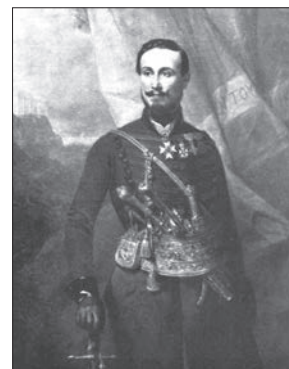
Ο Olivier Vouitier (κοινό κτήμα)

τους περιόρισαν στο κάστρο και κάμαν και ρεσάλτο μέσα εις τον Σερπετζέ και σκοτώθηκαν κι απ' τόνα το μέρος κι απ' τ' άλλο. Ήρθε ο Ομέρπασας Βεργιόνης με μίαν δύναμιν κι έκαμε πολύν καιρόν στην Αθήνα και διάλυσεν την πολιορκίαν κι έπαθαν οι δυστυχείς Αθηναίγοι πολλά δεινά, σκοτωμούς, σκλαβιές και ζημιές πλήθος. Φεύγοντας ο Βεργιόνης συνάχτηκαν πάλε η χώρα και τα χωριά και πολιορκήσαν τους Τούρκους, κατοίκους και φρουρά, οπίσω στο κάστρο στενά. Και σώθη το νερό κι ο ζαΐρες τους των Τούρκων και παραδόθηκαν με συνθήκη. Κι η συνθήκη έμεινε στο χαρτί μονάχα. Ρίχτηκαν στους παραδομένους κι έσφαξαν πλήθος γυναικόπαιδα κι άντρες πολλούς.