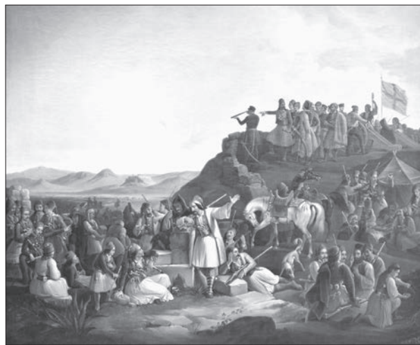
Το στρατόπεδο του Καραϊσκάκη στην Καστέλλα. Θεόδωρος Βρυζάκης, 1855. Εθνική Πινακοθήκη-Μουσείο Αλεξάνδρου Σούτζου (κοινό κτήμα)

δ) Τα ελληνικά στρατεύματα, ακροβολισμένα γύρω από την Ακρόπολη αλλά και πέρα από αυτήν προς τον Πειραιά, προσπάθησαν με την τοποθέτησή τους στην περιφέρεια της Αττικής να δημιουργήσουν ένα είδος πολιορκίας των πολιορκητών, ακολουθώντας μάλλον τον επί τούτο σχεδιασμό του Γεωργίου Καραϊσκάκη, που φαίνεται να έχει αντιληφθεί ότι απευθείας σύγκρουση με τους Τούρκους του Κιουταχί δεν θα απέβαινε υπέρ των Ελλήνων, καθώς οι Τούρκοι, εκτός όλων των άλλων, διέθεταν ενισχυμένο ιππικό, που θα κυριαρχούσε σε μια κατά παράταξη σύγκρουση. Να σημειώσουμε επίσης ότι στην περιοχή της Αττικής, λόγω της κρισιμότητας του αγώνα, εκτός από τον Καραϊσκάκη, τον Μακρυγιάννη, τον Γκούρα, βρέθηκε μια πλειάδα οπλαρχηγών όπως ο Νικόλαος Κριεζιώτης, ο Βάσος Μαυροβουνιώτης, ο Λάμπρος Βέικος, ο Κίτσος Τζαβέλας, ο Παν.