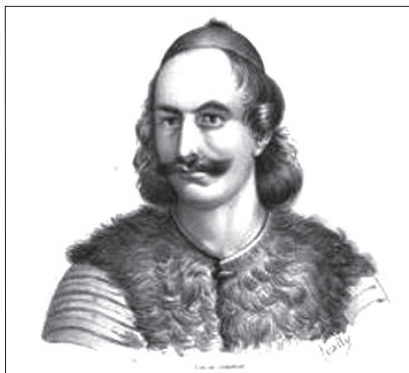
Ο Ιωάννης Γκούρας. Λιθογραφία, Λεύκωμα Giovanni Boggi, Εθνικό Ιστορικό Μουσείο