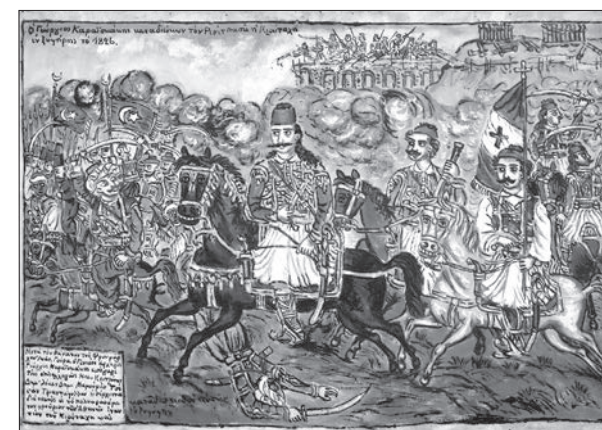
Ο Γεώργιος Καραϊσκάκης καταδιώκων τον Ρεσίτ πασά ή Κιουταχί, το 1826. Πίνακας του Θεόφιλου Χατζημικαήλ, ιδιωτική συλλογή (κοινό κτήμα)