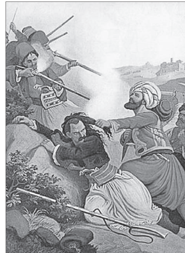
Ο Μακρυγιάννης υπερασπίζεται τον Πειραιά στη Μάχη της Καστέλλας. Πίνακας του Peter von Hess (κοινό κτήμα)

Φυσικά δεν μπορεί κανείς να μαντεύσει την τύχη των γεγονότων, δηλαδή ποιο θα ήταν το αποτέλεσμα της Μάχης του Αναλάτου, που θα ακολουθήσει, με την παρουσία του Καραϊσκάκη, ούτε είναι στις υποχρεώσεις της ιστορίας να επιχειρεί παρόμοιες προβλέψεις. Το γεγονός, ωστόσο, είναι, ότι η Μάχη αυτή, του Αναλάτου, που έλαβε χώρα στις 24 Απριλίου 1827,