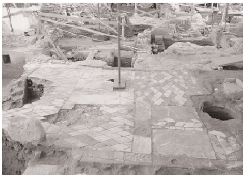
Εικ. 7. Αίθριο οικίας των υστερορωμαϊκών-παλαιοχριστιανικών χρόνων με δάπεδο από μαρμαροθέτημα (opus sectile).

ενώ δυτικότερα άρχισαν να αποκαλύπτονται τοίχοι κτιρίων κλασικών και γεωμετρικών χρόνων. Αξιόλογα κινητά ευρήματα έχουν βρεθεί στις επιχώσεις, όπως η κεφαλή νέου, ρωμαϊκών χρόνων και μικρά μαρμάρινα αγαλμάτια.