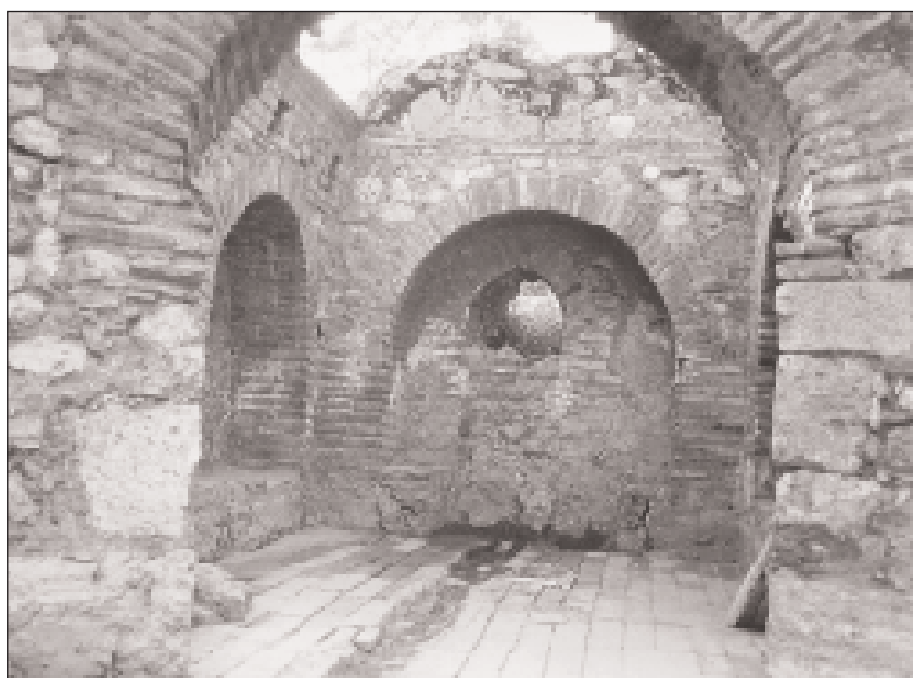
Εικ. 8. Νυμφαίο της οικίας Ω βορείως του Αρείου Πάγου.

Εν τω μεταξύ το μήνα Δεκέμβριο επιτελέστηκαν με χρηματοδότηση του Β' Κοινοτικού Πλαισίου Στήριξης, εργασίες υποβοηθητικές για την εκπόνηση των οριστικών μελετών και κατά γενική ομολογία συντείνουν στην αναβάθμιση και εξυγίανση αρκετών περιοχών: στην αρχαία Αγορά οι εργασίες επικεντρώθηκαν