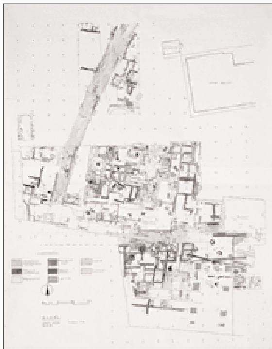
Εικ. 6. Κάτοψη ανασκαφής στο οικόπεδο Μαυργιάννη.

Ένα τρίτο μεγάλο συγκρότημα των πρώιμων ρωμαϊκών χρόνων επίσης με μεγάλη περίστυλη αυλή αποκαλύφθηκε στην περιοχή νότια της οδού 1. Στη μια πλευρά της περίστυλης αυλής σώζεται μαρμάρινο προστομιαίο από φρέαρ, το δάπεδό της είναι στρωμένο με μαρμαροθέτημα, ενώ σώζονται στη θέση