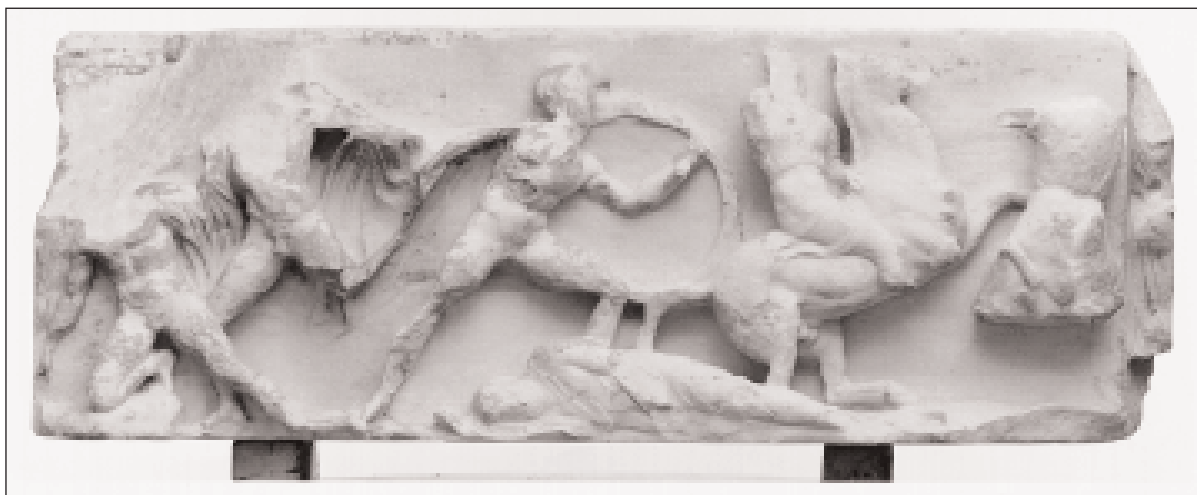
Εικ. 2. Ζωφόρος του Ναού της Αθηνάς Νίκης, νότια πλευρά.

1023 αρχαία καταγράφηκαν το 1997 στις αποθήκες του Μουσείου Ακροπόλεως και 500 φωτογραφήθηκαν, μεταξύ των οποίων και αγγεία της μυκηναϊκής, κλασικής και αρχαϊκής εποχής. Από την αποθήκη της Βιβλιοθήκης Αδριανού και από την αποθήκη που στεγάζεται στο Φετιχιέ Τζαμί μεταφέρθηκαν στο Μουσείο Ακροπόλεως 4 κιβώτια που είχαν ένδειξη ότι προέρχονται από το Παλαιό Μουσείο Ακροπόλεως. Περιείχαν πήλινα ειδώλια, γλυπτά, επιγραφές, αγγεία και όστρακα. Από τα αγγεία δύο ανέκρια είναι ένας χουρς, με γονατισμένο παιδάκι μπροστά σε πρόχου, το χαρακτηριστικό αγγείο που εικονίζει θέματα από τη ζωή των παιδιών και προσφερόταν στα παιδιά στη γιορτή των Ανθεστηρίων, και μία αρυβαλλοειδής λήκυθος με προτομή γυναίκας με κεκρύφαλο, ίσως μαινάδας αφού μπροστά στη μορφή εικονίζεται ένας θύρσος. Ολοκληρώθηκε επίσης η καταγραφή των 750 αρχαίων σιδερένιων συνδέσμων που έχουν αφαιρεθεί από τα μνημεία. Οι σύνδεσμοι τακτοποιήθηκαν σε συρτάρια στην αποθήκη των επιγραφών.