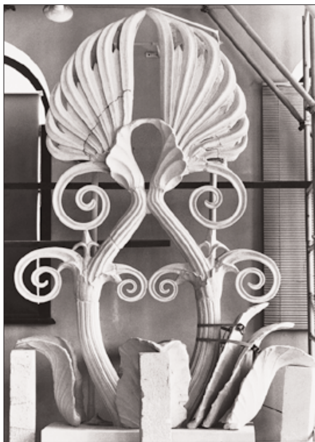
Εικ. 5. Ανακατασκευή του κεντρικού ανθεμοτού ακρωτηρίου του Παρθενώνα.

Τον τελευταίο καιρό το βάρος του εργαστηρίου επικεντρώνεται στην κατασκευή των εκμαγείων και των λίθων της ζωφόρου του ναού της Αθηνάς