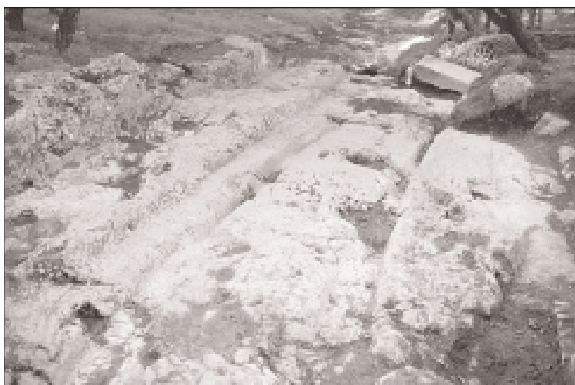
Εικ. 9. Ανατολικό τμήμα οδού στον αρχαίο Δήμο Κοίλης με ξείνος αμαξοτροχιών.