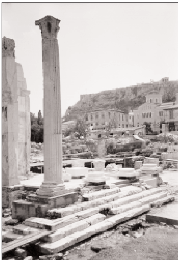
Εικ. 3. Το Πρόπυλο της Βιβλιοθήκης Αδριανού με τις βάσεις από νέο μάρμαρο που θα χρησιμοποιηθεί στην αναστήλωση.

Στο Διονυσιακό Θέατρο με το συνεργείο των τεχνικών Κώστα Μακαντάση, Θανάση Μπελούκα, Νίκου