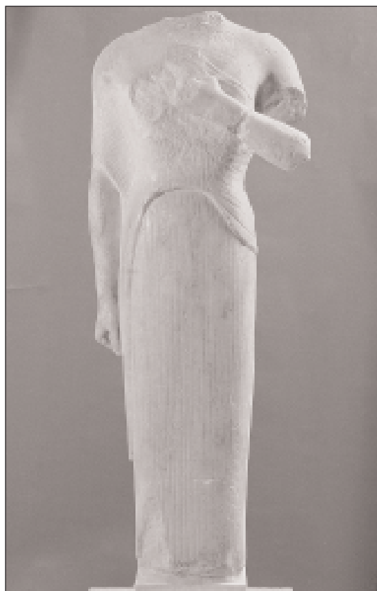
Εικ. 1. Κόρη Μουσείου Ακροπόλεως αρ. 619.

Ένα από τα κομμάτια γλυπτών που προέρχονται από τους λιθοσωρούς αναγνωρίστηκε ότι ανήκει στην κοι-