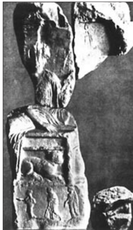
Εικ. 1. Τμήμα από το αμφίγλυφο του Τηλεμάχου με τα θραύσματα Μ. Ακρ. 2530 + Εθν. Μ. 2477 + Βρετ. Μ. 1920, 6-161 + Εθν. Μ. 2491.

μονικό μόχθο και να την δεχθείτε μαζί με την αγάπη μας ως ελάχιστο φόρο τιμής για τη δική σας προσφορά.