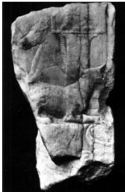
Εικ. 3α-β. Verona, Museo Maffeiiano. Θραύσμα του αμφιγλύφου του Τηλεμάχου.