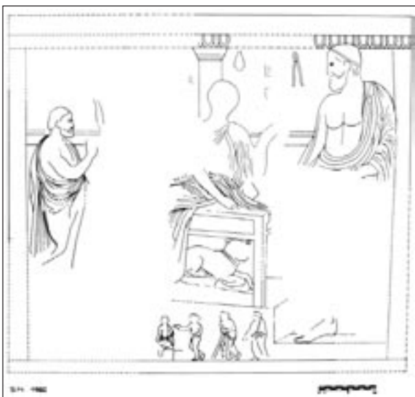
Εικ. 4. Σχεδιαστική αποκατάσταση του αμφιγλύφου (Α όψη).