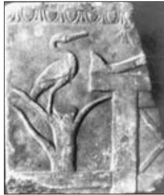
Εικ. 2α-β. Padova, Museo Civico. Θραύσμα του αμφιγλύφου του Τηλεμάχου.