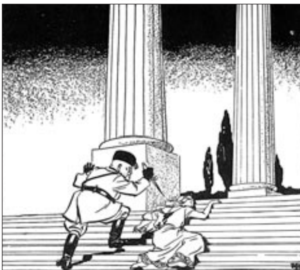
Εφημερίδα Daily Mirror, Λονδίνο, 19 Μαΐου 1941