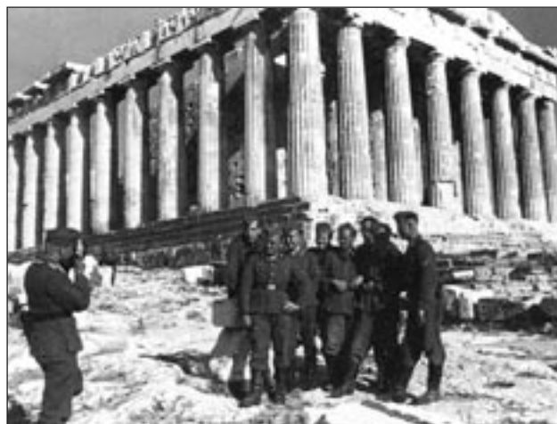
"Γερμανοί στρατιώτες ποζάρουν για μια αναμνηστική φωτογραφία μπροστά στον Παρθενώνα, 1941". Mark Mazower, INSIDE HITLER'S GREECE

Οι πολύτιμοι κίονες του Παρθενώνα στέκονται ογκώδεις μπροστά μας. Ήταν ο ναός των Παρθένων αφιερωμένος