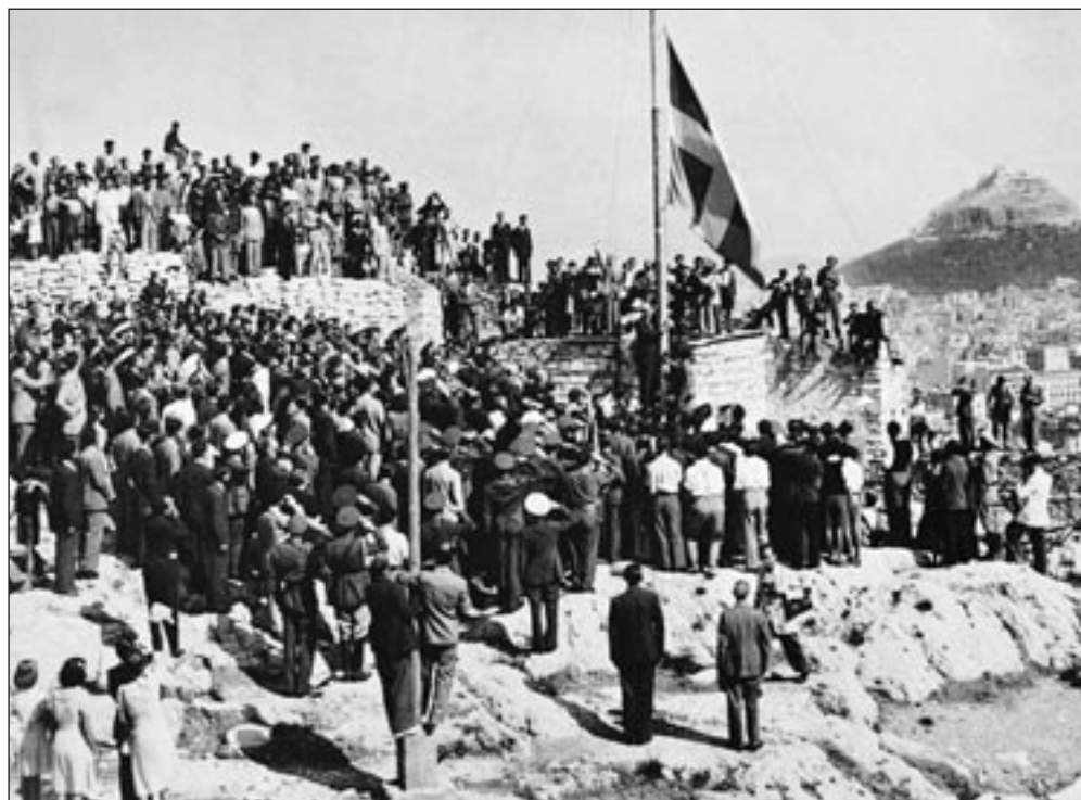
“Η Ελληνική σημαία αναπετάσσεται και πάλιν επί του Ιερού Βράχου της Ακροπόλεως”. ΕΚΘΕΣΙΣ ΤΗΣ ΠΟΛΕΜΙΚΗΣ ΑΡΕΤΗΣ ΤΩΝ ΕΛΛΗΝΩΝ, τ. Β΄