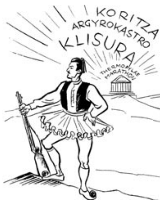
Σκίτσο σε βρετανική εφημερίδα του 1940

André Gide, Γαλλία, από γράμμα του στον Κ. Θ. Δημαρά από το Cabris, 31.12.1940