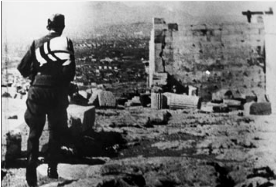
“Αθήνα, 12 Οκτωβρίου 1944. Οι Γερμανοί αποχωρούν από την πόλη. Ο τελευταίος Γερμανός στρατιώτης εγκαταλείπει την Ακρόπολη, μεταφέροντας τη ναζιστική σημαία. Η οβίδα που δεν μολύνει πια τον Ιερό Βράχο”. Εφημερίδα Η Καθημερινή, Κυριακή 25.4.1999