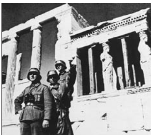
Βάσος Π. Μαθιόπουλος, ΕΙΚΟΝΕΣ ΚΑΤΟΧΗΣ