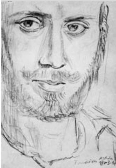
Αυτοπροσωπογραφία του Γιάννη Τσαρούχη, Αλβανία 27.3.1941