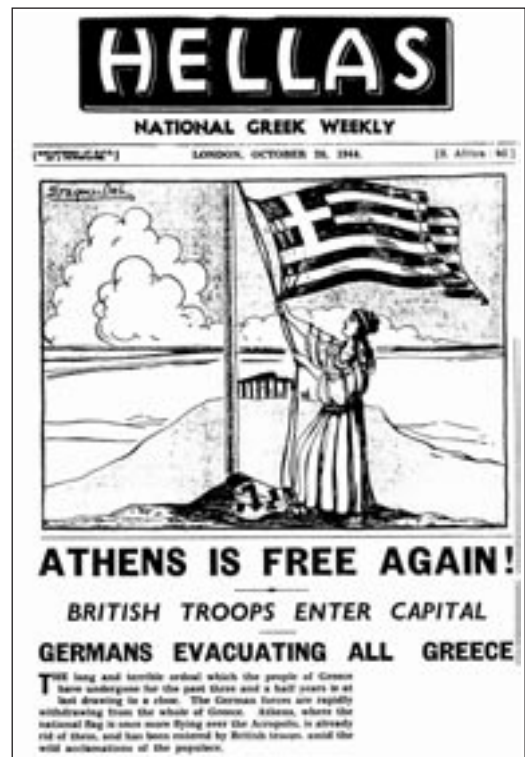
Εφημερίδα Hellas, Λονδίνο 20.10.1944

Λευτεριά ή θάνατος λευτεριά ή θάνατος –ο κόσμος μες στ’ ανοιχτά αυτοκίνητα φωνάζοντας– κι οι προκηρῦξεις κι οι άνθρωποι κυνηγώντας τις προκηρῦξεις και φωνάζοντας ζήτω σκουντουφλώντας πάνω στα τανκς και φωνάζοντας ζήτω