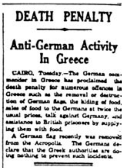
Εφημερίδα The Mercury, Hobart Αυστραλίας, 4.6.1941