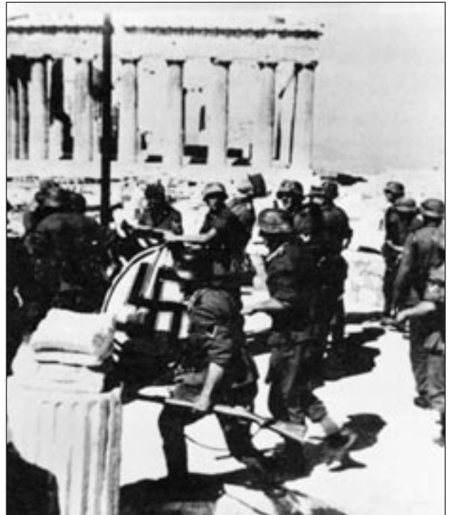
“Ακρόπολη, 27 Απριλίου 1941, ώρα περίπου 9.45 π.μ. Γερμανικό στρατιωτικό απόσπασμα, με την ορμή του νικητή, φθάνει στο τέλος της προσπάθειάς του. Σε λίγες στιγμές θα έχει υψώσει το κόκκινο και μαύρο λάβαρο της νίκης του”.