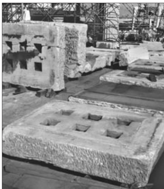
Ναός της Αθηνάς Νίκης. Οι φαντασματικές πλάκες της οροφής μετά την αποσυναρμολόγησή τους.