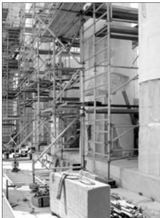
Παρθενών. Η ανατολική εσωτερική πρόσταση κατά το διάστημα της αναστηλώσεως. Άποψη από τα βόρεια.

Το παλιό σύστημα βασιζόταν στα χωριστά προγράμματα για την αποκατάσταση των μνημείων με την ευθύνη των μηχανικών που προΐσταντο σε καθένα από αυτά. Τα διοικητικά και τα οικονομικά θέματα χειριζόταν η Α' Εφορεία Προϊστορικών και Κλασικών Αρχαιοτήτων. Το σύστημα απέδωσε για πολλά χρόνια κι αυτό δεν ήταν άσχετο με τις πολύ μεγάλες ικανότητες των νέων τότε μηχανικών (1975-1977). Από το 1994 όμως, μετά την τελευταία διεθνή συνάντηση για την αποκατάσταση των μνημείων της Ακροπόλεως, γίνεται εμφανής η κρίση: αν και η ποιότητα παραμένει παντού αρίστη, η παραγωγικότητα πέφτει στα ελάχιστα και δημιουργείται η εντύπωση ότι τα έργα δεν θα τελειώσουν ποτέ.