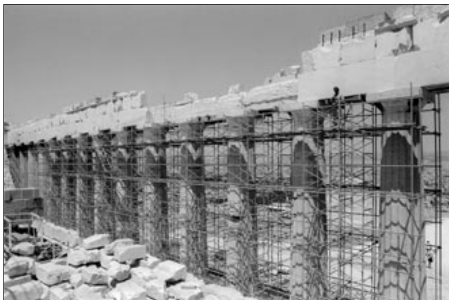
Παρθενών. Ισριώματα στη βόρεια κοινοστοιχία.