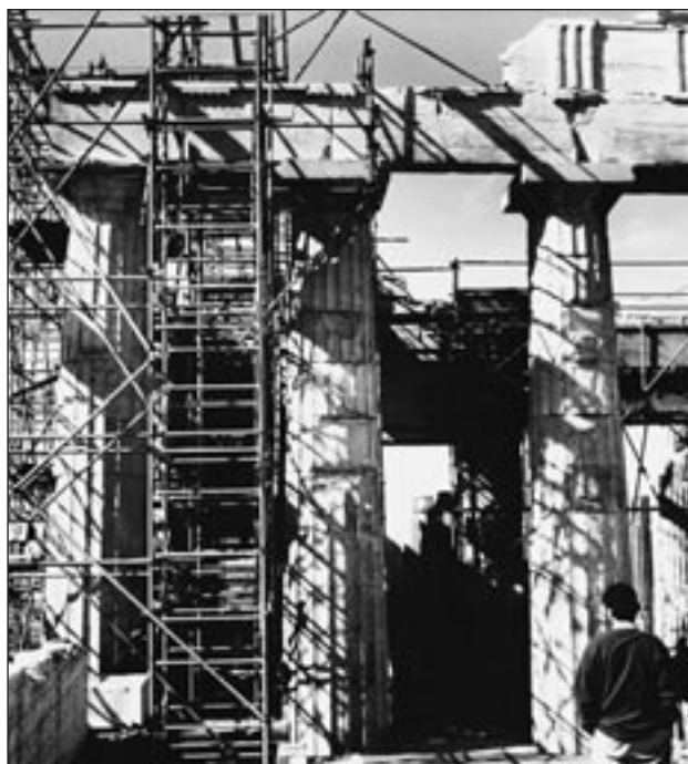
Προπύλαια. Το νότιο άκρο της ανατολικής στοάς με τα κριώματα αποκαταστάσεως της νοτιοανατολικής γωνίας.