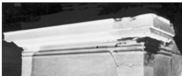
Προπύλαια. Το επίκρανο της παραστάδος της νοτιοανατολικής γωνίας μετά την αποκατάστασή του.

Στη βόρεια κιονοστοιχία η διάβρωση των οξειδωμένων δοκών και συνδέσμων στον θριγικό έχει οδηγήσει σε ετοιμορροπία. Η μελέτη έχει εκπονηθεί από τον κ. Κ. Ζάμπα, το 1997, έχει εγκριθεί από το Κεντρικό Αρχαιολογικό Συμβούλιο και περιλαμβάνει εκτός από την εξυγείανση των κιόνων και του θριγικού αφ' ενός την αντικατάσταση των τσιμεντένιων σφονδύλων της αναστηλώσεως Μπαλάνου από μαρμαρίνους και αφ' ετέρου την άρση των παρατοποθετήσεων των αρχαίων σφονδύλων. Το πρόγραμμα της βόρειας κιονοστοιχίας είναι το μεγαλύτερο από όλα στον Παρθενώνα, απαιτεί νέο μηχανολογικό εξοπλισμό και συντονισμένες ενέργειες, προκειμένου να μειωθεί η αισθητική επιβάρυνση με τη διάλυση τόσο του θριγικού όσο και των κιόνων. Το αναλυτικό χρονοδιάγραμμα της μεγάλης αυτής επεμβάσεως εγκρίθηκε προ μηνός από το Κεντρικό Αρχαιολογικό Συμβούλιο.