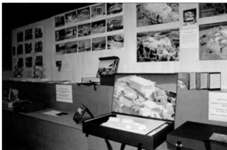
Εκθεση των μουσειοσκευών στο Κέντρο «Γαΐα» του Μουσείου Γουλανδρή Φυσικής Ιστορίας

Ήδη έχει ξεκινήσει η επόμενη φάση για να δοθούν στο εξωτερικό 100 αντίγραφα της αγγλικής έκδοσης της μουσειοσκευής «Πάμε στην Ακρόπολη», χάρη στη χορηγία του Ιδρύματος Σταύρος Σ. Νιάρχος. Οι 5 πρώτες μουσειοσκευές δόθηκαν στα μεγαλύτερα σχολεία του Βελγίου με το πιο έντονο ενδιαφέρον για τον ελληνικό πολιτισμό στις πόλεις Namur, Vise, Liege, Herstal, Mons. Τα σχολεία επιλέχθηκαν από το Υπουργείο