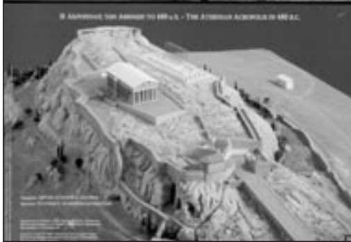
Η Ακρό- πολις των Αθηνών το 480 π.Χ.