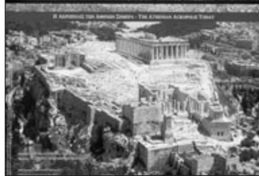
Η Ακρό- πολις των Αθηνών σήμερα

όπου οι Αθηναίοι λάτρευαν την προστάτιδα Θεά τους. Σχετική με την κατασκευή του αρχαίου ναού, είναι η δεύτερη μουσειοσκευή με τίτλο « Ένας Αρχαίος Ναός » που πραγματοποιήθηκε με τη χορηγία του Ιδρύματος Μποδοσάκη. Ανοίγοντας τη μουσειοσκευή βλέπει κανείς τον γνωστό πίνακα του Schinkel που αποδίδει μία φανταστική-ποιητική προσέγγιση ναού και ελληνικού τοπίου. Ένα αντίγραφο του Παρθενώνα σε κλίμακα 1:800 δείχνει στους μαθητές με παραστατικό τρόπο πώς ήταν ένας αρχαίος ναός. Αντίγραφα κιόνων των τριών ρυθμών της κλασικής αρχιτεκτονικής βοηθούν τα παιδιά να παρατηρήσουν και να αναγνωρίσουν τις επιμέρους μορφές των ρυθμών, να τους συγκρίνουν μεταξύ τους και να κατανοήσουν τα χαρακτηριστικά τους. Σε ένα συρτάρι υπάρχουν 16 σφραγίδες με τη βοήθεια των οποίων οι μαθητές μπορούν να συνθέσουν τον Δωρικό, τον Ιωνικό και τον Κορινθιακό ρυθμό.