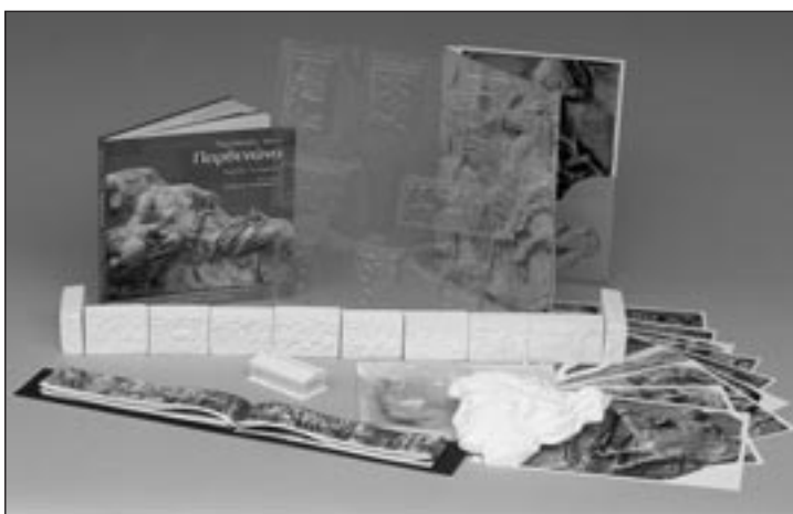
Μουσειοσκευή «Η Ζωφόρος του Παρθενώνα»

Με βάση το παραπάνω σκεπτικό αλλά και τη σπουδαιότητα που αποδίδει η Υπηρεσία μας στη λειτουργία των βιβλιοθηκών ως κύριων πολιτιστικών κεντρών της περιφέρειας, αρκετές από τις μουσειοσκευές μας δόθηκαν σε βιβλιοθήκες, δημόσιες, με κινητές μονάδες, σε βιβλιοθήκες του δικτύου του Κέντρου Παιδικού και Εφηβικού Βιβλίου καθώς και του δικτύου βιβλιοθηκών του νομού