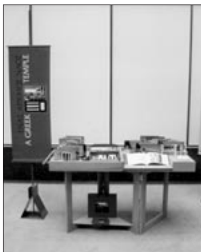
Έκθεση των μουσειοσκευών στις Βρυξέλλες