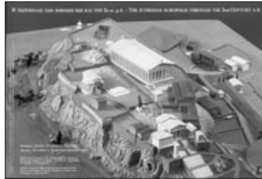
Η Ακρό- πολις των Αθηνών έως και τον 2ο αι. μ.Χ.