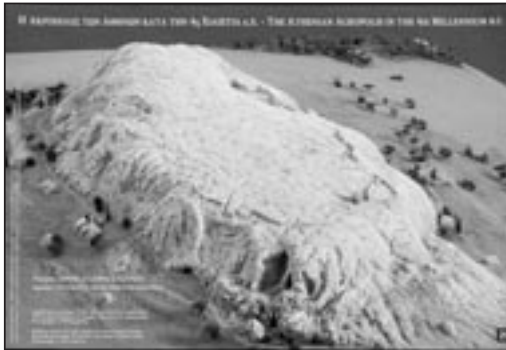
Η Ακρό- πολις των Αθηνών κατά την 4η χιλιετία π.Χ.