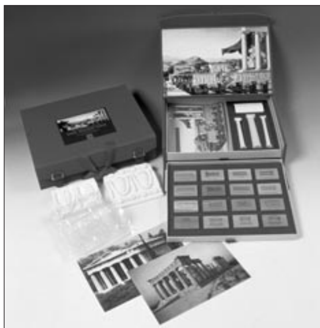
Μουσειοσκευή «Ένας Αρχαίος Ναός»

Από την πρώτη τους μορφή που υλοποιήθηκε στο πλαίσιο των εκπαιδευτικών προγραμμάτων της Ακρόπολης το 1990-1993, οι σημερινές μουσειοσκευές έχουν μετεξελιχθεί, έτσι ώστε να είναι πιο εύρηστες και να επιτρέπουν την πολλαπλή αναπαραγωγή τους, ανάλογα με τις ανάγκες που θα προκύψουν. Διακινούνται τόσο στην Ελλάδα, όσο και στο εξωτερικό και για τον λόγο αυτό το σύνολο των εντύπων έχει μεταφρασθεί και στην αγγλική γλώσσα. Το τμήμα μας μέχρι σήμερα δάνειζε 15 μουσειοσκευές σε περίπου 200 σχολεία τον χρόνο. Οι νέες μουσειοσκευές, μας έδωσαν για πρώτη φορά την ευκαιρία να τις προσφέρουμε σε εκπαιδευτικούς φορείς, αλλά και την ευχέρεια να τις δανείζουμε σε περισσότερα σχολεία τον χρόνο και για μεγαλύτερο χρονικό διάστημα.