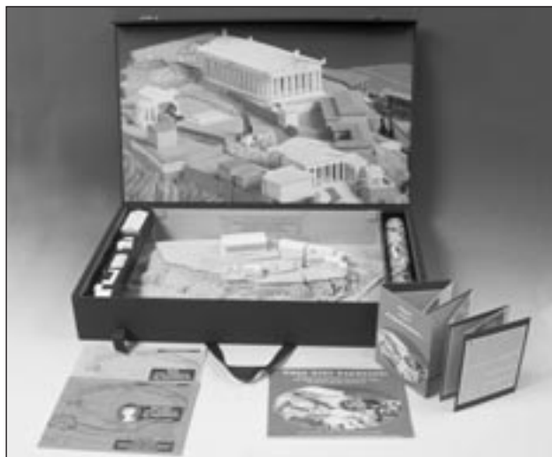
Μουσειοσκευή «Πάμε στην Ακρόπολη»

Τέσσερις αφίσες με την ιστορία του Βράχου, έντυπα για τον εκπαιδευτικό και τον μαθητή, με θέματα «Πάμε στην Ακρόπολη» και «Πάμε στον αρχαίο Περίπατο της Ακρόπολης» με αναπαράστασεις των μνημείων, των ιερών σπηλαίων και των θεάτρων τόσο κατά την κλασική εποχή όσο και σήμερα, βοηθούν τον μαθητή να ακολουθήσει ένα οδοιπορικό στον Βράχο και να αναπαραστήσει με τη φαντασία του το λαμπρό Ιερό,