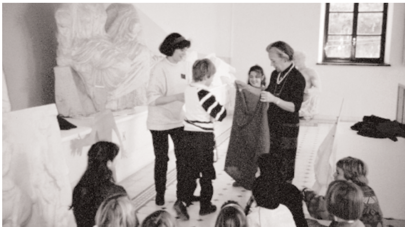
Μία Μέρα με τη Ζωφόρο του Παρθενώνα, Μάρτιος 1991.