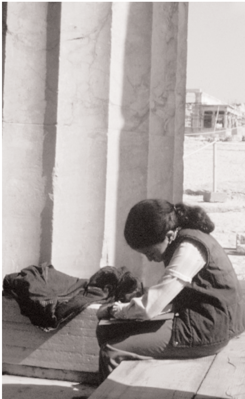
Μία Μέρα στην Ακρόπολη, Απρίλιος 1990.

Την επόμενη χρονιά, το 1995, συμμετέχουν και πάλι στην καμπάνια του Υπουργείου Πολιτισμού για το βιβλίο και παρακολουθούν το εκπαιδευτικό πρόγραμμα “Μια Μέρα στην Ακρόπολη, αναζητώντας τη θεά Αθηνά”.