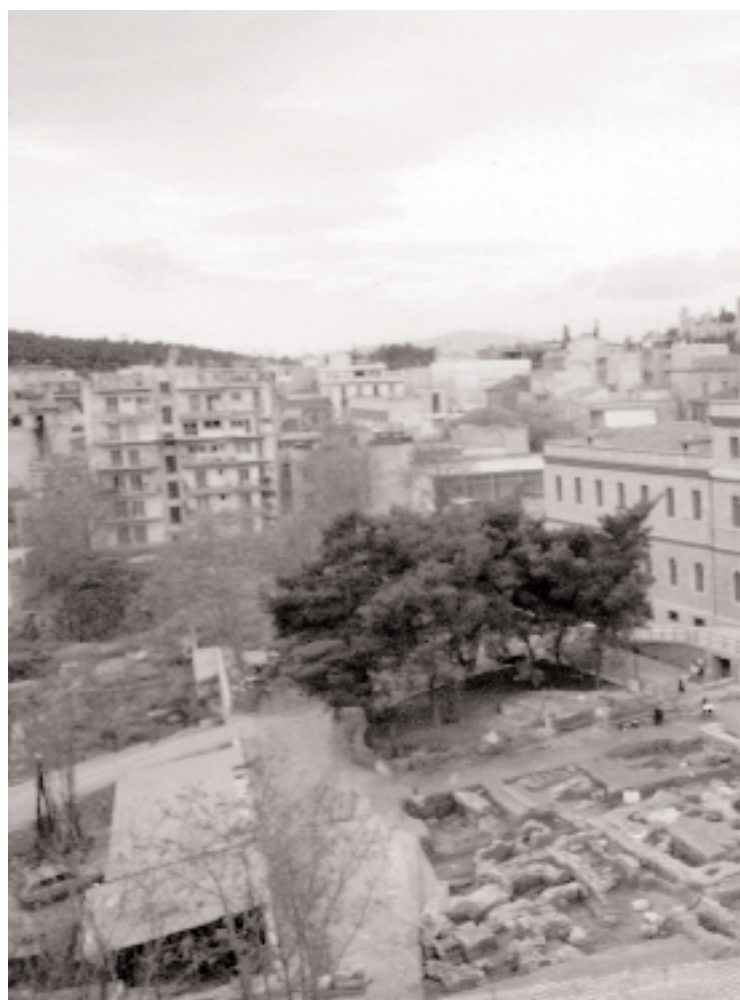
Ανασκαφή Μακρυγιάννη, γενική άποψη.

αλλά βρέθηκαν πολύ αποσπασματικά, για να επιτρέπουν μια κατανοητή ανασύνθεσή τους. Στα κατώτερα στρώματα και μέσα σε λαξεύματα του βράχου περισυλλέχθηκε και σημαντική κεραμεική των χρόνων, η περισσότερη μελαμβαφής καλής ποιότητας, αλλά ανάμεσα σε αυτήν και τμήματα αγγείων με αξιολογη ερυθρόμορφη διακόσμηση, όπως ένας γαμικός λέβητας, κρατήρες κ.ά. Επίσης αξιοσημείωτα είναι και δύο ωραία αθηναϊκά αργυρά τετράδραχμα, αλλά αυτά βρέθηκαν σε διαφορετικούς χώρους και προέρχονται από νεώτερες επιχώσεις.