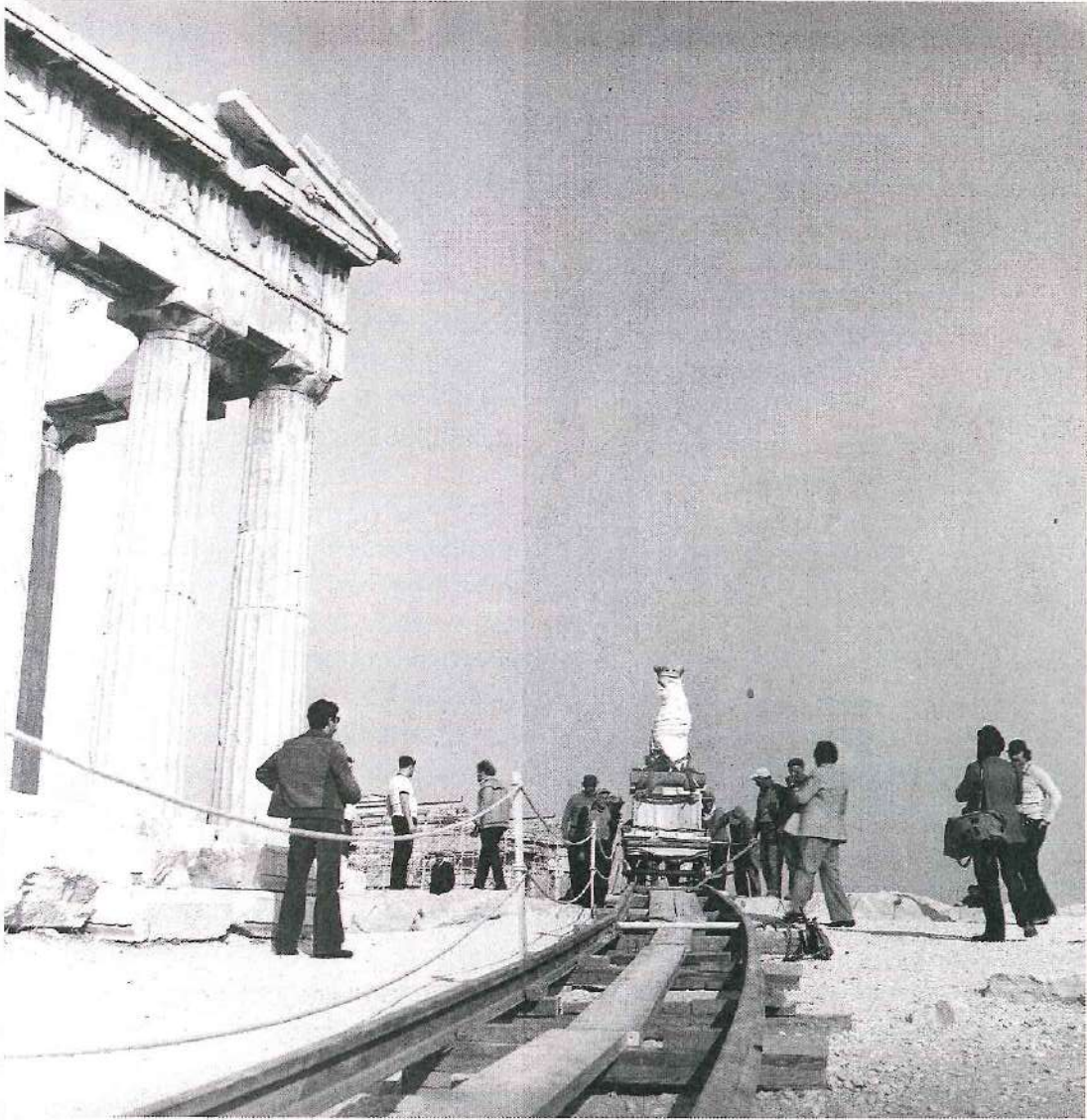
Μεταφορά της 5ης (από Δ) Καρυάτιδας στο Μουσείο της Ακρόπολης.

σχέδιο του Μανόλη Κορρέ. Μερικές εικόνες, αυθεντικές μαρτυρίες της εποχής, συγκλονίζουν, όπως το σχέδιο με την καταβίβαση της μετόπης από το συνεργείο του Έλγιν, όπου στο έδαφος είναι πεσμένα τα κομμάτια από τα γείσα και τις τριγλύφους που σπάστηκαν για να απελευθερωθεί η μετόπη. Πολλές άλλες λεπτομέρειες της πληροφόρησης μεταφέρουν τον αναγνώστη στο πνεύμα και στον τρόπο μεταχείρισης των μνημείων της εποχής.