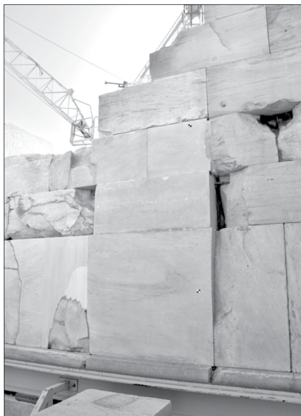
Εικ. 15. Συμπλήρωση της βυζαντινής θύρας στη βόρεια πλευρά του βόρειου τοίχου.

λωσης, αλλά τις περισσότερες φορές διαπιστώθηκε ότι θα βαρύνει μία από αυτές. Η ευθύνη των μηχανικών είναι μεγάλη και συγχρόνως ο διαθέσιμος χρόνος πολύτιμος. Παρόλα αυτά, οι καθημερινές εμπειρίες είναι μοναδικές. Στους μηχανικούς, που στελεχώνουν εδώ και 24 χρόνια το Τεχνικό Γραφείο Παρθενώνα, οφείλονται πολλές ευχαριστίες και θερμές ευχές για το μέλλον.