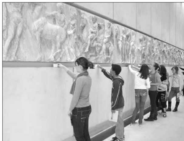
Εικ. 2. Εκπαιδευτικό Πρόγραμμα «Τα Γλυπτά του Παρθενώνα»

Ακολουθεί η κατηγορία των τακτικών προγραμμάτων. Με την έναρξη λειτουργίας του Νέου Μουσείου της