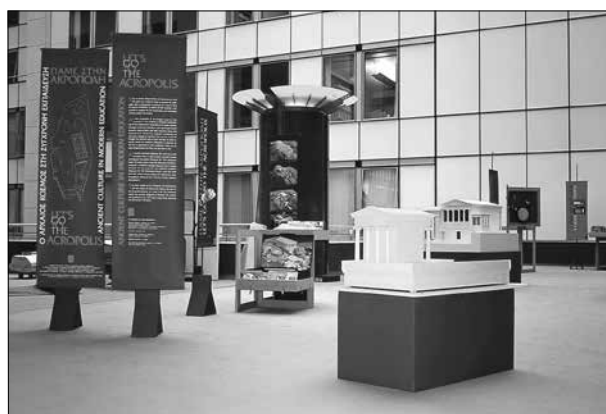
Εικ. 6. Έκθεση εκπαιδευτικού υλικού στο Ευρωκοινοβούλιο

Πολλές είναι βέβαια και οι προσκλήσεις που έχει δεχθεί όλα αυτά τα χρόνια η ΥΣΜΑ και για συμμετοχή σε σεμινάρια, συνέδρια, και εκθέσεις εκπαιδευτικού υλικού σε πολλές πόλεις της Ελλάδας και του εξωτερικού. Σημαντικότερα ορόσημα σε αυτή τη διαδρομή ήταν η συνεργασία με το Ελληνικό Τμήμα του Διεθνούς Συμβουλίου Μουσείων και η συμμετοχή σε μεγάλο αριθμό συνεδρίων, που αυτό έχει διοργανώσει σε όλη την Ελλάδα, η διοργάνωση έκθεσης των