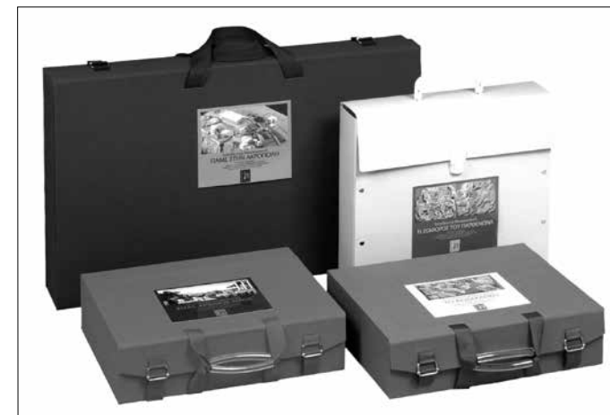
Εικ. 3. Εκπαιδευτικές Μουσειοσκευές

Η διεξαγωγή των προγραμμάτων αποτελεί όμως μόνον ένα σκέλος των εκπαιδευτικών δραστηριοτήτων, που εκπορεύονται από την ΥΣΜΑ. Καθώς οι αριθμοί των ενδιαφερομένων από τον χώρο της εκπαίδευσης είναι πολύ μεγάλοι, σύντομα διαπιστώθηκε ότι όσα προγράμματα κι αν γίνουν, ποτέ δεν θα είναι αρκετά για να καλύψουν τη ζήτηση των σχολείων. Έτσι, προκειμένου να αυξηθεί ο αριθμός των συμμετεχόντων στις εκπαιδευτικές δράσεις, δόθηκε μεγάλη έμφαση, αφενός στην παραγωγή και διάθεση εκπαιδευτικού υλικού και, αφετέρου, στην επιμόρφωση των εκπαιδευτικών.