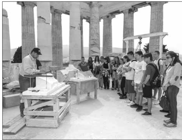
Εικ. 1. Εκπαιδευτικό Πρόγραμμα «Ακρόπολη και Αναστήλωση»

«Ακρόπολη και Αναστήλωση» (εικ. 1). Απευθύνεται σε σχολεία της Δευτεροβάθμιας Εκπαίδευσης και συγκεκριμένα σε μαθητές της Γ΄ Γυμνασίου και Α΄ Λυκείου. Διάρκει 2 ημέρες και συμμετέχουν συνολικά 300-400 μαθητές σχολείων της Αττικής. Στόχος είναι η γνωριμία των μαθητών με τα μνημεία και με το μεγάλο σύγχρονο αναστηλωτικό έργο που συντελείται στην Ακρόπολη. Πριν τη διεξαγωγή του προγράμματος πραγματοποιείται σεμινάριο στους συμμετέχοντες εκπαιδευτικούς, στο οποίο παρουσιάζεται το σύνολο του έντυπου και ψηφιακού υλικού της Υπηρεσίας, έτσι ώστε να προετοιμάσουν καλύτερα τους μαθητές τους για την επίσκεψη. Κατά τη διάρκεια του προγράμματος οι μαθητές παρακολουθούν μία σειρά παρουσιάσεων, που πραγματοποιούνται από το εξειδικευμένο προσωπικό της ΥΣΜΑ σε επιλεγμένες θέσεις στον χώρο της Ακρόπολης. Αρχαιολόγοι, αρχιτέκτονες, πολιτικοί μηχανικοί, τοπογράφοι, συντηρητές και μαρμαροτεχνίτες δείχνουν στα παιδιά την εργασία που διεξάγουν καθημερινά. Μαθητές και εκπαιδευτικοί επισκέπτονται το εσωτερικό των μνημείων και των εργοταξίων, ενημερώνονται για τα αίτια των φθορών, τις αρχές και τις μεθόδους των επεμβάσεων καθώς και για τα ολοκληρωμένα αλλά και τα τρέχοντα αναστηλωτικά προγράμματα.