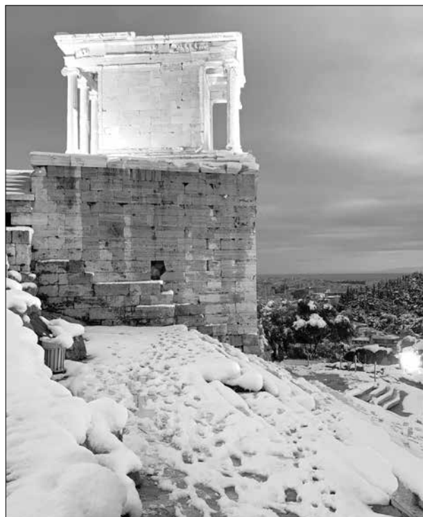
Ο αναστηλωμένος, το 2000-2010, για τρίτη φορά, ναός της Αθηνάς Νίκης. Άποψη από Β.

7. Τέλος, η μέγιστη δυνατή διαφάνεια, δημοσιοποίηση και κοινοποίηση των επεμβάσεων και διάχυση των επιτευγμάτων και των επιστημονικών κερδών τους με διάφορους τρόπους, κυρίως με δημοσιεύσεις που κυμαίνονται από ενημερωτικές και εκλαϊκευτικές έως τις πλέον επιστημονικές. Ιδιαίτερη μνεία πρέπει να γίνει στα εκπαιδευτικά προγράμματα που εκτελούνται για μαθητές διαφόρων τάξεων της πρωτοβάθμιας και μέσης εκπαίδευσης, τα οποία υπήρξαν πρωτοπόρα στο είδος τους και άνοιξαν δρόμο σε παρόμοιες δρα-