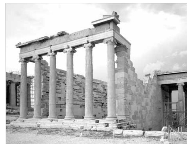
Το Ερεχθείο από ΒΔ με αποκατεστημένους τη ΒΑ γωνία και τον βόρειο τοίχο. Φωτ. Κ. Μαμαλούγκας, 2023

και στο πρόγραμμα αποκατάστασης του βόρειου τοίχου του σηκού· συνέχιση του προγράμματος στερέωσης του Περιμετρικού Τείχους (τρέχουσα επέμβαση στην περιοχή Β12), του προγράμματος καταγραφής και διευθέτησης των διασπαρτων πάνω στο πλάτωμα του βράχου μελών, του έργου στερέωσης των βράχων των κλιτύων του λόφου της Ακρόπολης (η πρώτη φάση του έργου έχει