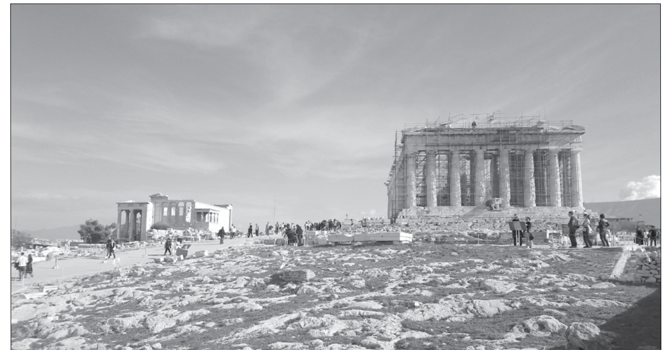
Στο τέλος του 2023 αποκαταστάθηκε το Β. τμήμα του Δ. αετώματος του Παρθενώνα, αποδίδοντάς του πάλι το γνωστό περίγραμμα. Οι εργασίες συνεχίζονται στο νότιο τμήμα, όπου προβλέπεται πλήρης συμπλήρωση του τμημάτων με χρήση αρχαίων θραυσμάτων και ενός λίθου εξ ολοκλήρου από νέο μάρμαρο. Φωτ. Β. Ελευθερίου, 2024

Την Τετάρτη, 19 Φεβρουαρίου του 2020, εγκαινιάσαμε στον Τάραντα την έκθεση «Σμίλη και Μνήμη» και το ίδιο βράδυ, στο δείπνο που παρέθεσαν οι διοργανωτές, η Σχολή Εξειδίκευσης για την Αποκατάσταση των Μνημείων του Πολυτεχνείου του Μπάρι και η τοπική Εφορεία Αρχαιοτήτων, αντικείμενο της συζήτησης ήταν η νέα μολυσματική ασθένεια, κρούσματα της οποίας είχαν παρουσιαστεί στο Μιλάνο. Είκοσι ημέρες αργότερα, με Πράξεις Νομοθετικού Περιεχομένου, λαμβάνονταν μέτρα για τον περιορισμό της διάδοσης της πανδημίας σε όλη την ελληνική επικράτεια. Στο εξής όσοι κυκλοφορούσαν θα έπρεπε να είναι εφοδιασμένοι με την κατάλληλη βεβαίωση και η εξ αποστάσεως εργασία νομιμοποιήθηκε εν μία νυκτί. Το Σάββατο 21 Μαρτίου με τη συνάδελφο Ε. Δρακοπούλου συμπληρώσαμε και υπογράψαμε 150 υπηρεσιακές βεβαιώσεις για την κυκλοφορία του προσωπικού κατά την εβδομάδα που θα ακολουθούσε, ενέργεια