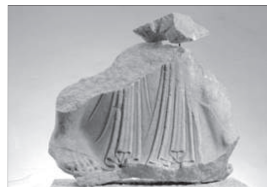
Εικ. 6. Η τρέχουσα μορφή του βόρειου ακρωτηρίου

το λυγισμένο δεξιό θα κρατούσε το δόρυ. Όταν βρέθηκε στην ανασκαφή του 1903, το κάτω μέρος του σώματός της σωζόταν σε ένα μεγάλο θραύσμα που άρμοζε κατά θραύσιν, αλλά δε βρέθηκε στα νεώτερα χρόνια, πιθανώς έσπασε σε μικρότερα κομμάτια τρία που αποδίδονται στο σχέδιο θεωρήθηκε ότι συναποτελούσαν το θραύσμα. Την προσπάθεια απόδοσης των θραυσμάτων αντιλαμβάνεται κανείς στο σχέδιο της αναπαράστασης του νότιου αετώματος, (εικ. 8) στο οποίο σχεδιάζονται ένα-ένα τα θραύσματα που είναι πιθανό να ανήκουν στις μορφές.