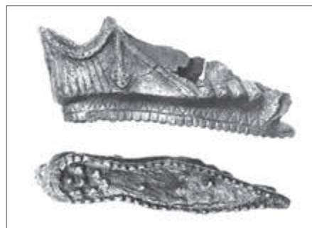
Ομοίωμα χάλκινου πέδιλου από την Ακρόπολη ΕΜ Χ 6737 (πλάινη και κάτω όψη)