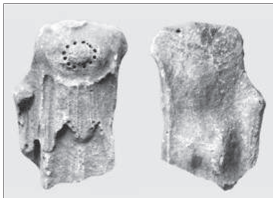
Εικ. 3. Η Αθηνά από το νότιο αέτωμα του ναού

Ο ναός (εικ. 1-2) με προσανατολισμό από βορρά προς νότο και όχι ανατολικά, δυτικά, όπως συνηθίζεται, έχει διαστάσεις στον στυλοβάτη 11,98 μέτρα πλάτος και 23,20 μέτρα μήκος. Έχει 6 κίονες στις στενές πλευρές και 11 στις μακρές. Ο σηκός είχε πρόναο με δύο κίονες ανάμεσα στις παραστάδες. Οι κίονες και ο θριγκός ήταν λαξευμένοι σε πωρόλιθο από τις Κεγχρεές επιχρισμένο. Η σίμη, η κεράμωση και ο γλυπτός διάκοσμος είναι από μάρμαρο παριανό. Σημειώνει η Τουλούπα ότι ο Παπανικολάου διαπίστωσε στα γλυπτά δυο μεγέθη. Συμφωνεί λοιπόν ότι οι μορφές των ακρω-