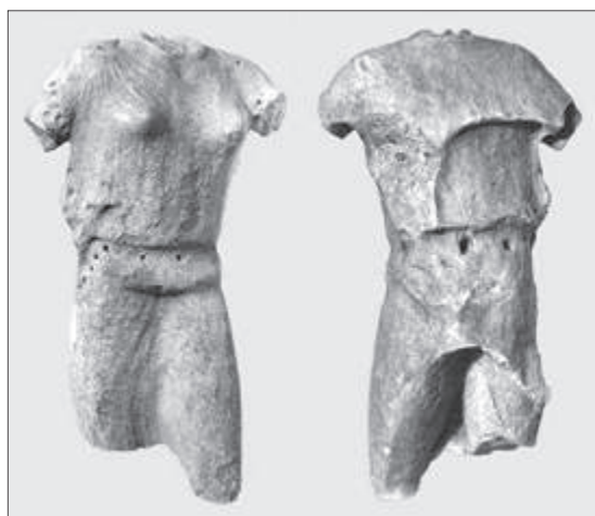
Εικ. 4. Η Αμαζόνα του νότιου ακρωτηρίου του ναού

τηρίων είναι πιο μεγάλες από τις μορφές του αετώματος, πράγμα που δεν είναι ο κανόνας, αλλά συναντιέται και σε άλλα μνημεία, όπως π.χ. στον ναό του Δαφνηφόρου Απόλλωνος στην Ερέτρια.