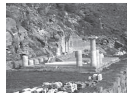
Εικ. 1. Ο ναός της Αθηνάς στην Καρθαία (από Καρθαία 2009)

Απόλλωνα στο κάτω άνδρηλο και βρήκε ένα κολοσσικό ακέφαλο άγαλμα του θεού καθώς και πολλά θραύσματα γλυπτών από παριανό μάρμαρο. Τα ευρήματά του φόρτωσε σε ένα αγγλικό εμπορικό πλοίο, το Bella Nina με προορισμό τη Μάλτα. Δεν τα αναζήτησε αμέσως, αργότερα δεν μπόρεσε να τα εντοπίσει και έκτοτε αγνοούνται. Λεπτομέρειες για τον Bröndstedt και τις δραστηριότητές του θα βρει κανείς στο άρθρο της Αριστέας Παπανικολάου-Cristensen, το δημοσιευμένο στο Ανθέμιον του 2008 (Παπανικολάου-Cristensen, 2008).