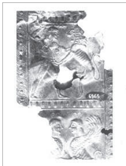
Θραύσμα όχανου της πρώιμης αρχαϊκής εποχής με παράσταση του μύθου Ηρακλή-λέοντα (άνω) και δύο αντωπών σφριγγών (κάτω)

Ομότιμη Καθηγήτρια Κλασικής Αρχαιολογίας ΑΠΘ