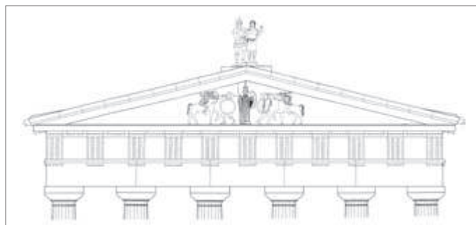
Εικ. 7. Αναπαράσταση των κεντρικών μορφών και του ακρωτηρίου της νότιας πλευράς το ναού της Αθηνάς στην Καρθαία. Σχέδιο S. Tufano

σίμης. Έχει παρατηρηθεί και βεβαιωθεί ότι η μορφή των γραμμάτων δεν είναι σύγχρονη με το στυλ των αγαλμάτων που έφεραν και θεωρείται ότι χαραχτήκαν αργότερα, στα μέσα του 4ου αιώνα, όταν η Κέα επανήλθε στην αθηναϊκή συμμαχία. Ως Αντιόπη (εικ. 4) αναγνωρίζεται η ακέφαλη γυναικεία μορφή, η οποία βαδίζει με μεγάλο διασκελισμό προς τα δεξιά με το αριστερό πόδι μπροστά και το δεξιά πίσω. Τα χέρια της είναι σπασμένα από το μέσο περίπου του βραχίονα και τα πόδια της περίπου από τα γόνατα. Φοράει έναν πέπλο, που θα συγκρατιόταν στους ώμους με δύο περόνες, όπως δείχνουν οι οπές. Το αριστερό της χέρι θα ήταν εκτεταμένο προς τα μπροστά, το δεξιά θα φερόταν προς τα πίσω. Το ένδυμα πίσω καλύπτει τους γλουτούς, ενώ κοντά στη μέση έχει δυο τρύπες, οι οποίες είτε σχετίζονται με μια πρόσθετη ζώνη ή, πιθανώς, εκεί θα στερεωνόταν το αριστερό χέρι του Θησέα που θα την κρατούσε από τη μέση της. Οι οπές στην πλαϊνή δεξιά πλευρά θα μπορούσαν να στερεώνουν ένα αντικείμενο που θα κρεμόταν από τη ζώνη ή θα συνδεόταν με ένα άλλο αντικείμενο.