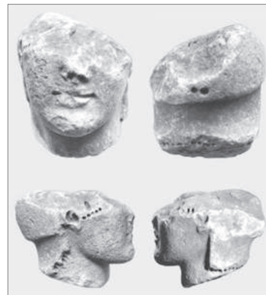
Εικ. 5. Η κεφαλή του Θησέα από το νότιο ακρωτήριο του ναού

Το θέμα του αετώματος, καταλήγει η Τουλούπα, ότι ήταν η αμαζονομαχία. Στην υπόθεση οδηγείται από κάποια από τα θραύσματα, όπως π.χ. το άκρο χέρι με τη χειρίδα το άκρο πόδι με κνημίδα (εικ. 8), καθώς και στα πολυάριθμα κομμάτια από σκέλη, σπλές και ουρές αλόγων, τμήμα κεφαλής αλόγου και θραύσμα από χαιτή, που δείχνουν ότι στη σύνθεση συμπεριλαμβάνονταν έφιππες μορφές και συνεπώς εικονίζονταν μια μάχη μεταξύ έφιππων μορφών και σπλιτών. Η παρουσία της Αθηνάς (εικ. 3) θεωρεί η Τουλούπα ότι υποδεικνύει τους σπλίτες ως Αθηναίους και συμπεραίνει ότι πρόκειται για τη μάχη των Αθηναίων με τον Θησέα εναντίον των Αμαζόνων στη Θεμίσκυρα. Στο μέσον λοιπόν, όπως είπα, τοποθετείται το άγαλμα της Αθηνάς το οποίο σώζεται από τη ρίζα του λαιμού ως το μέσο περίπου των μηρών. Η θεά φοράει χιτώνα και ιμάτιο και στο στήθος μια μεγάλη αιγίδα που καλύπτει όλο τον πάνω κορμό, με γοργόνειο στο μέσον με τρυπούλες στην περίμετρο, στις οποίες θα στερεώνονταν τα χάλκινα κεφάλια των φιδιών. Το αριστερό της χέρι είναι σπασμένο, πιθανώς θα κρατούσε την ασπίδα, με