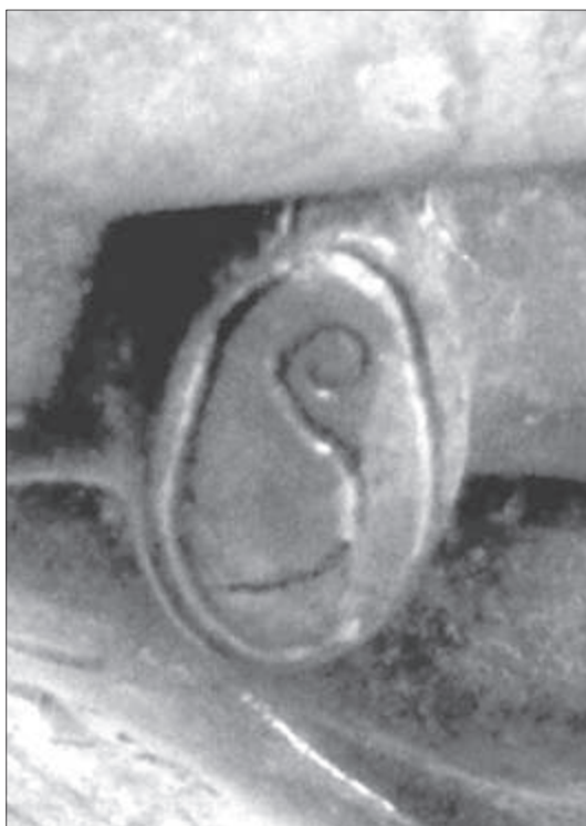
Το δαχτυλίδι του Αυγούστου, Αθήνα, Εθνικό Αρχαιολογικό Μουσείο X 23322.

Διατυπώθηκε και η αντίθετη υπόθεση, ότι το δαχτυλίδι του οιωνοσκόπου δεν τον χαρακτηρίζει ως Pontifex Maximus αλλά απλά σαν στρατηγό imperator, διορισμένο από τη Σύγκλητο της Ρώμης, που είχε το δικαίωμα να ερμηνεύει τους οιωνούς, επομένως μπορεί να δημιουργήθηκε πολύ νωρίτερα, γύρω στα 27 π.Χ. μετά το άγαλμα της Prima Porta. Κατά μια άλλη θεωρία, το άγαλμα του Αυγούστου είναι αντίγραφο ενός νεανικού πορτρέτου, που στήθηκε από τη Σύγκλητο κοντά στα rostra του Forum Romanum μετά τον θάνατο του Ιουλίου Καίσαρα, το 43 π.Χ., για να τιμήσει τον κληρονόμο του, που τότε ονομαζόταν Οκταβια-